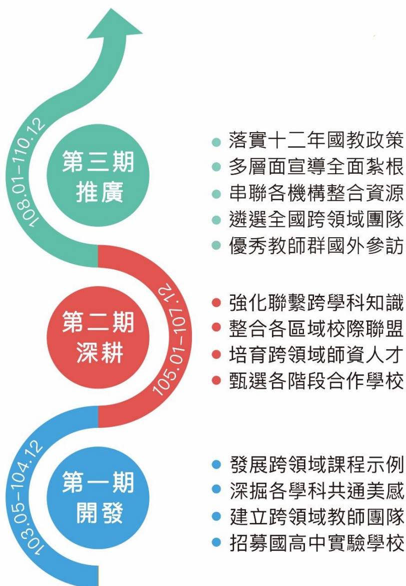
圖一 跨領域美感教育計畫三期三階段執行理念進程圖

隨著十二年國民基本教育的啟動，臺灣教育改革走向新的里程碑。強調培養以人為本的「終身學習者」，以「自發」、「互動」及「共好」為理念，本計畫自許成為美感教育的卓越領航，故擴充先前「中等學校暨國小階段跨領域美感教育實驗課程開發計畫」的實驗成果，擬持續深耕於跨領域美感教育課程面向，並以輔導與推廣為本階段計畫之主軸，連結十二年國民基本教育階段，建構更全面而永續的跨領域美感教育樣態。