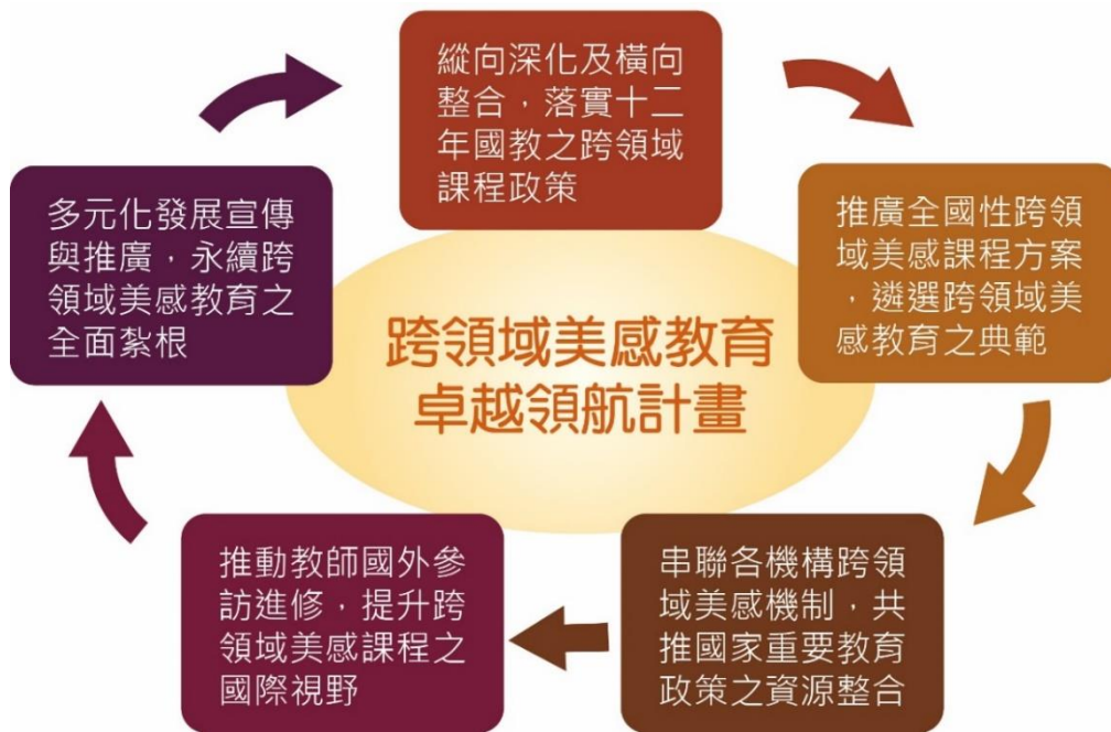
圖二 跨領域美感卓越領航計畫總體執行方針

本計畫以三年三階段為工作期程，以第一與第二期跨領域美感教育課程為基礎，並配合十二年國民基本教育核心素養之訴求，發展「宣導—培訓→成效—評估→交流—擴展—再宣導」為計畫實行方向。總體執行方針規劃如下：