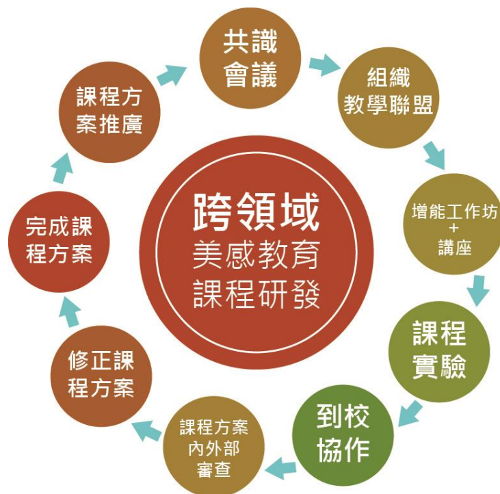
圖四 跨領域美感課程研發循環圖

計畫實施時，與師資培育大學及諮詢委員成立共識會議，並組織各校藝術領域教師作為校內跨領域美感課程之啟動者，串聯各縣市相關機構資源，組成跨領域美感課程團隊，並與學校教師共同研討與開發跨領域美感教育課程方案。跨領域美感課程研發循環如圖所示。