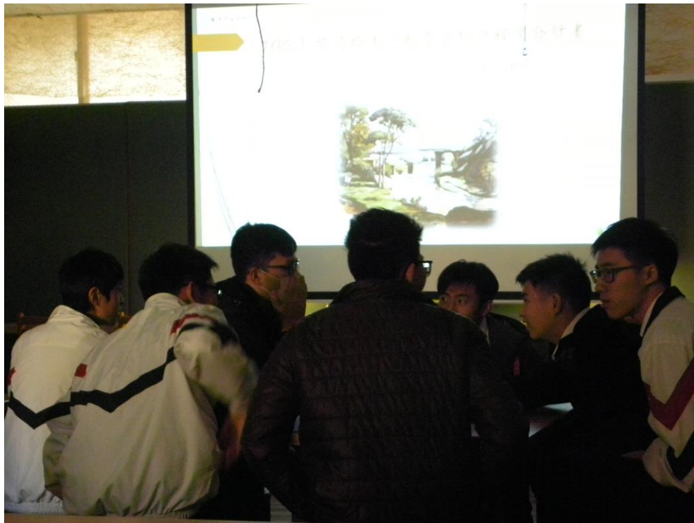
2. 學生於課堂中進行小組討論