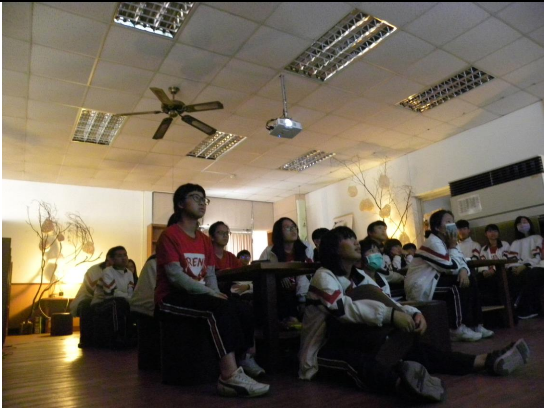
8. 學生於美好氛圍中聆賞課程內容