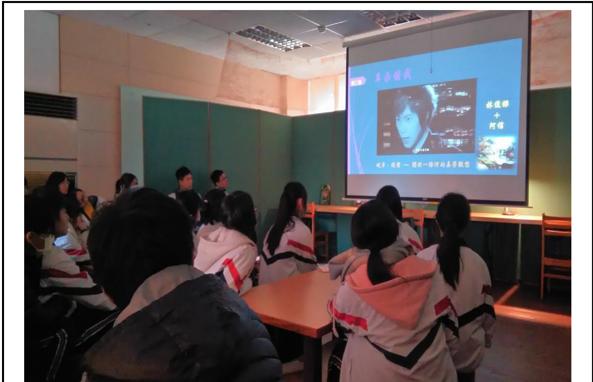
6. 學生於議題歌曲引導中領略過去未曾看懂之詞曲意境