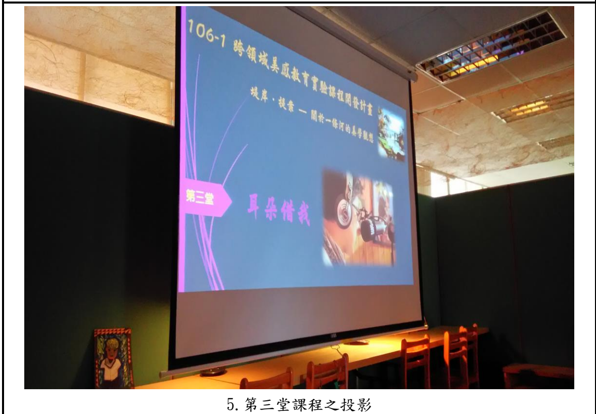
5. 第三堂課程之投影