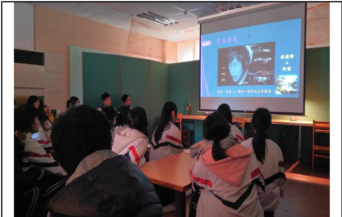
6. 學生於議題歌曲引導中領略過去未曾看懂之詞曲意境