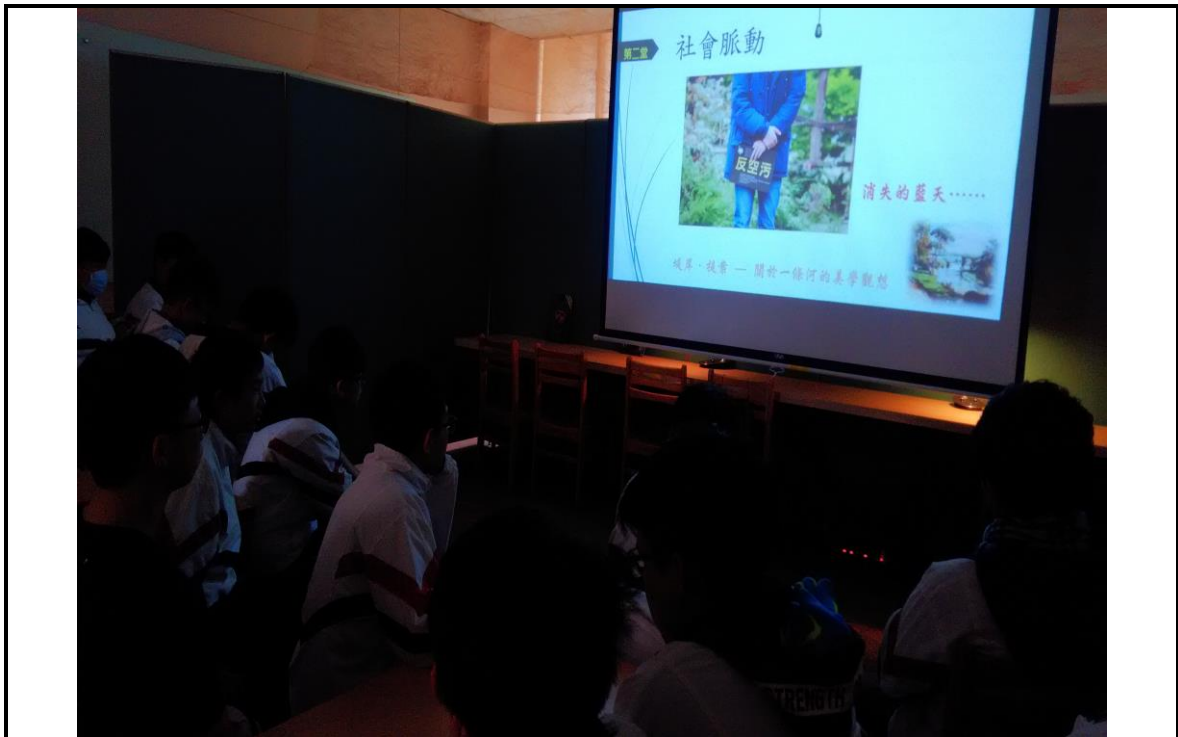
4. 學生專注觀看課程之進行