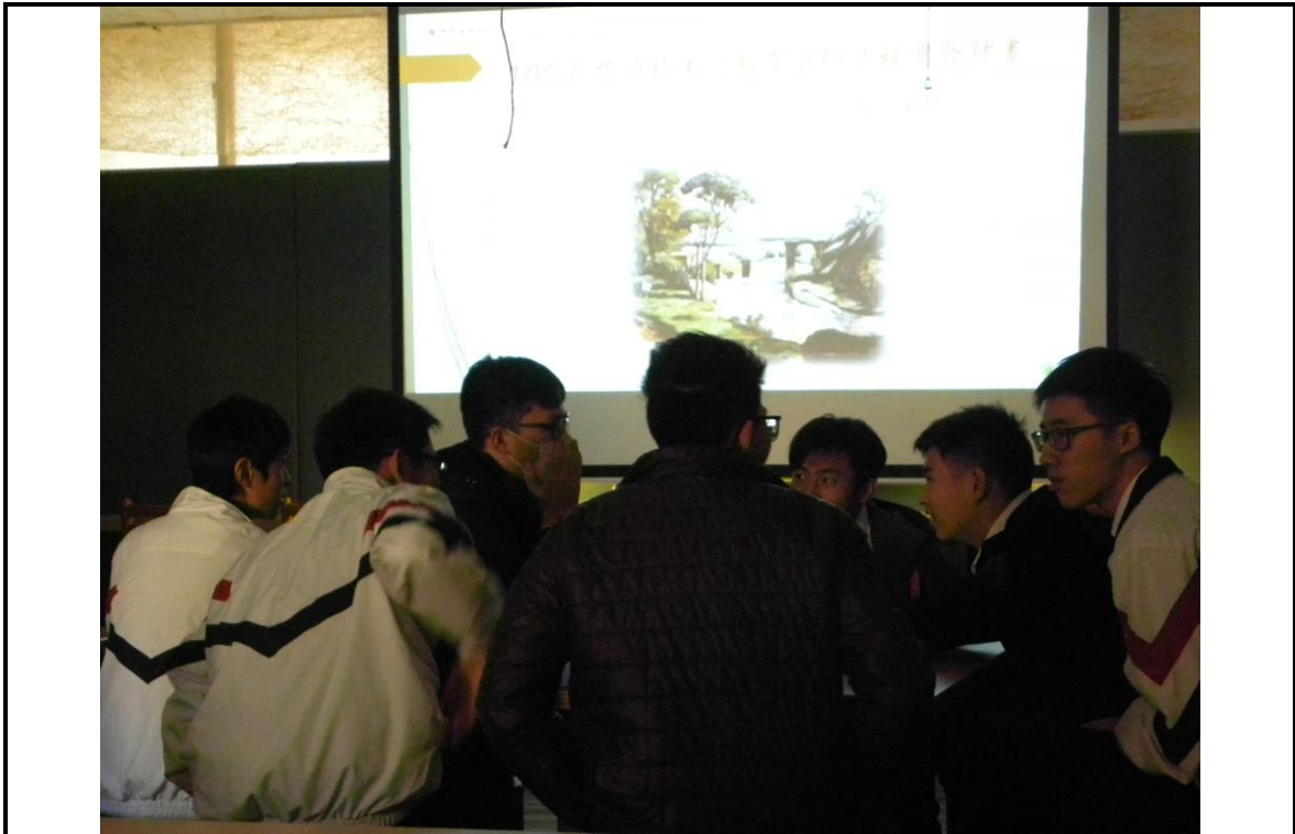
2. 學生於課堂中進行小組討論