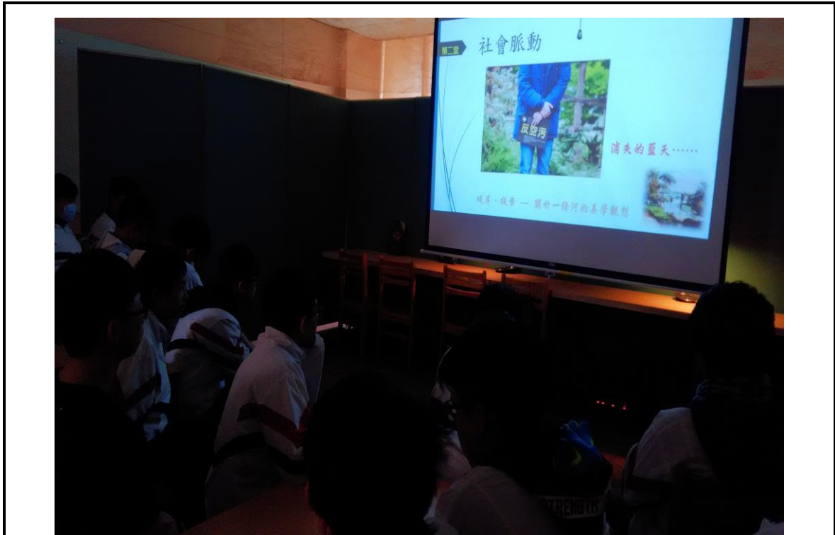
4. 學生專注觀看課程之進行