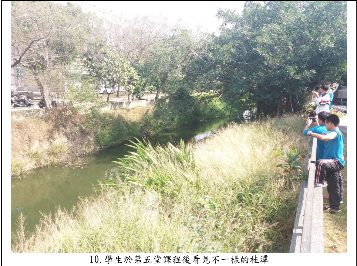
10. 學生於第五堂課程後看見不一樣的桂潭