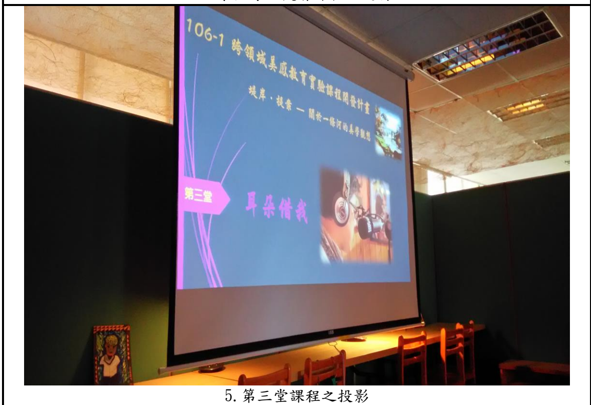
5. 第三堂課程之投影