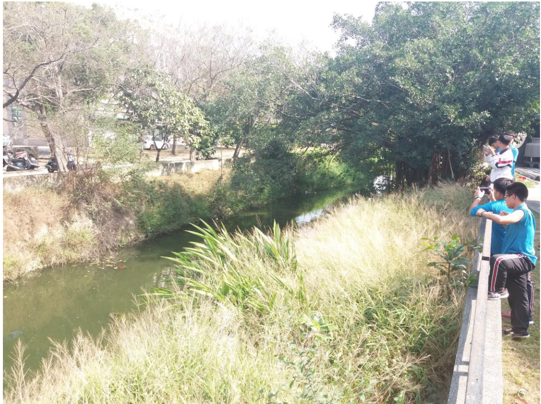
10. 學生於第五堂課程後看見不一樣的桂潭