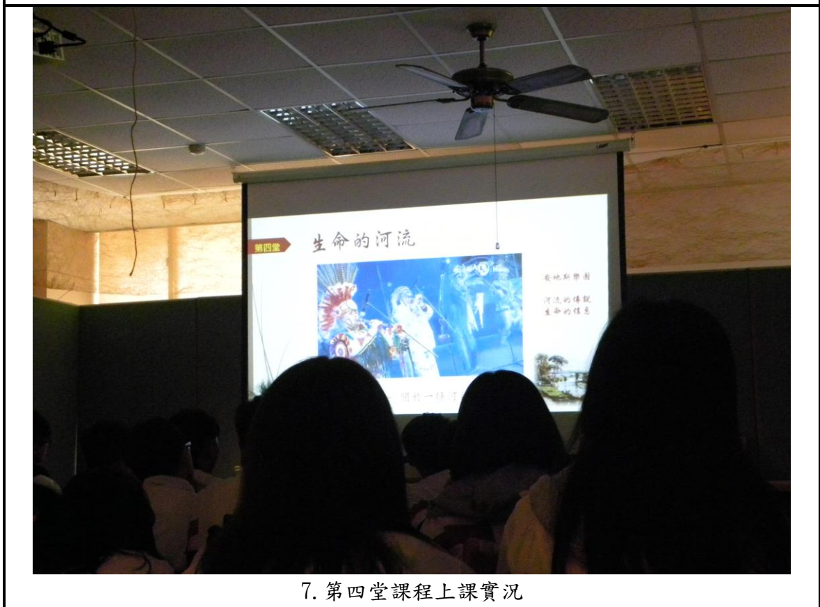
7. 第四堂課程上課實況