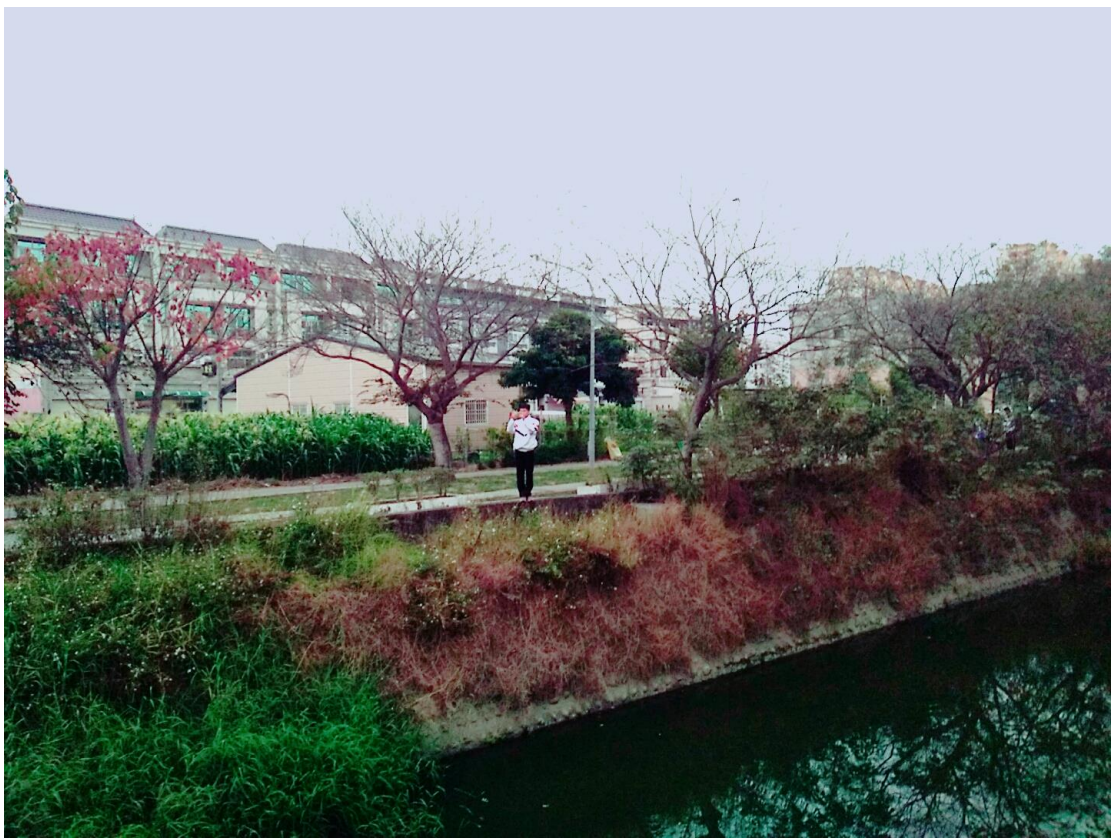
9. 學生於第五堂課程後進行桂潭之拍攝