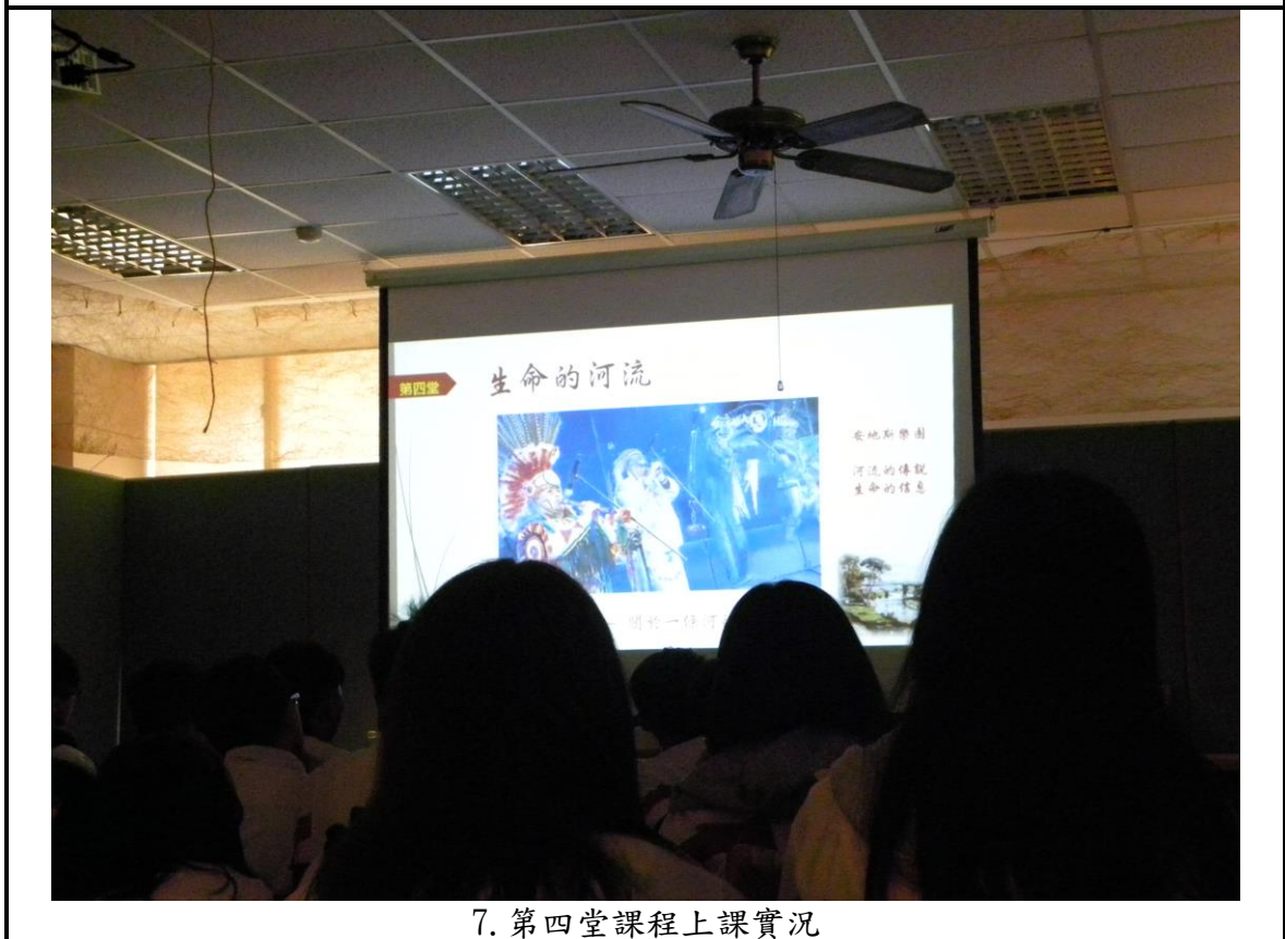
7. 第四堂課程上課實況