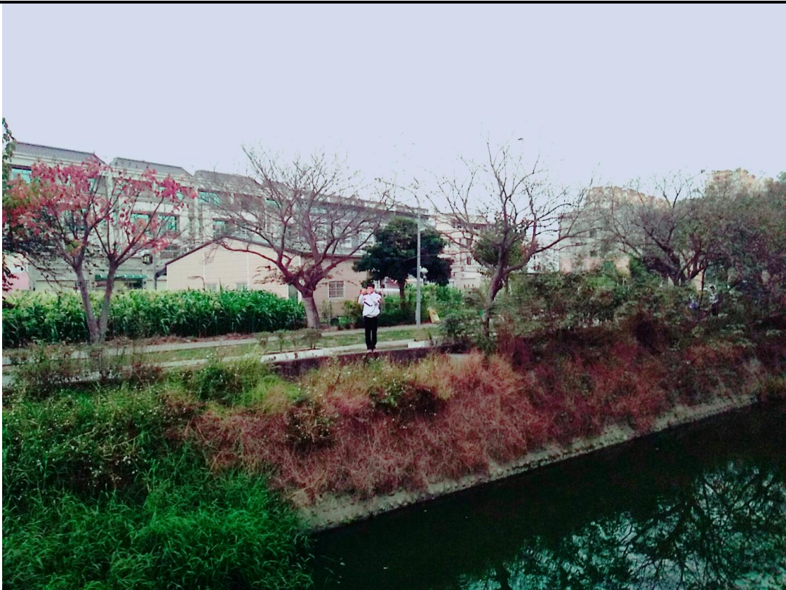
9. 學生於第五堂課程後進行桂潭之拍攝