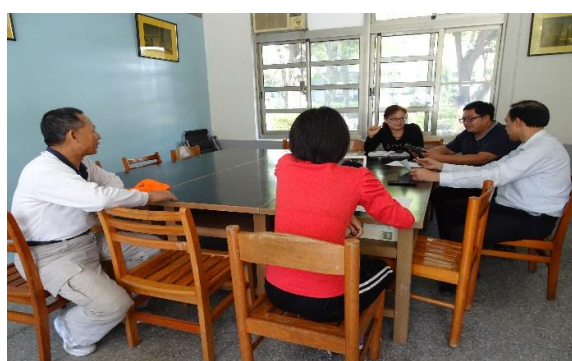
(上圖左) 糕餅之美體驗(上圖右) 校長出席共備討論