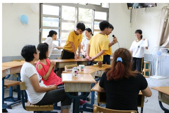
(上圖左) 謝師宴食物製備(上圖右) 謝師宴活動