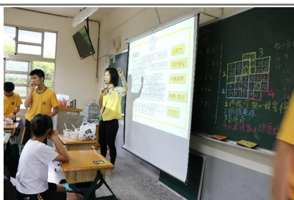
(上圖左) 飲食滋味表達課程(上圖右) 學生說食分享