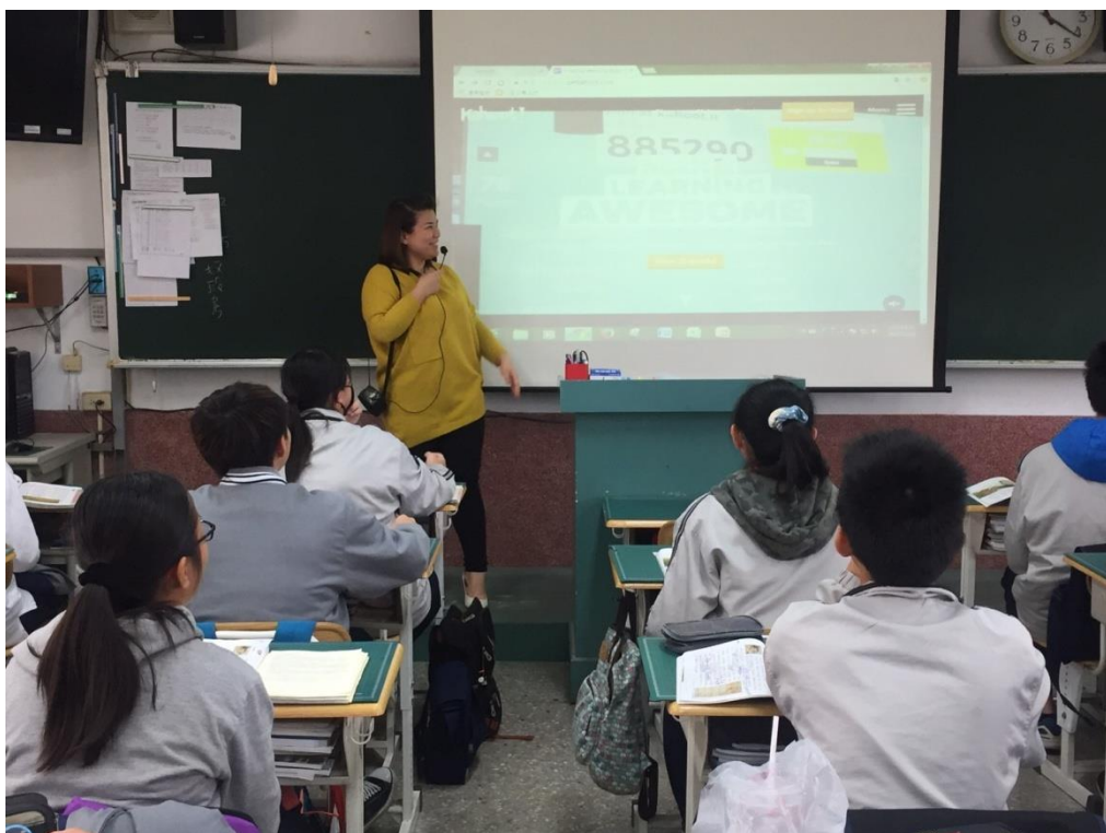
國文課—說明活動規則及介紹 Kahoot