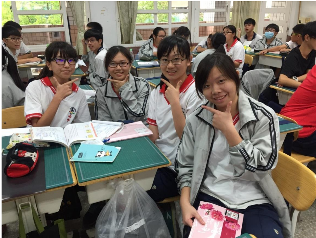
高一 1 學生