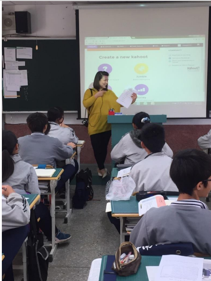
國文課—說明活動規則及介紹 Kahoot