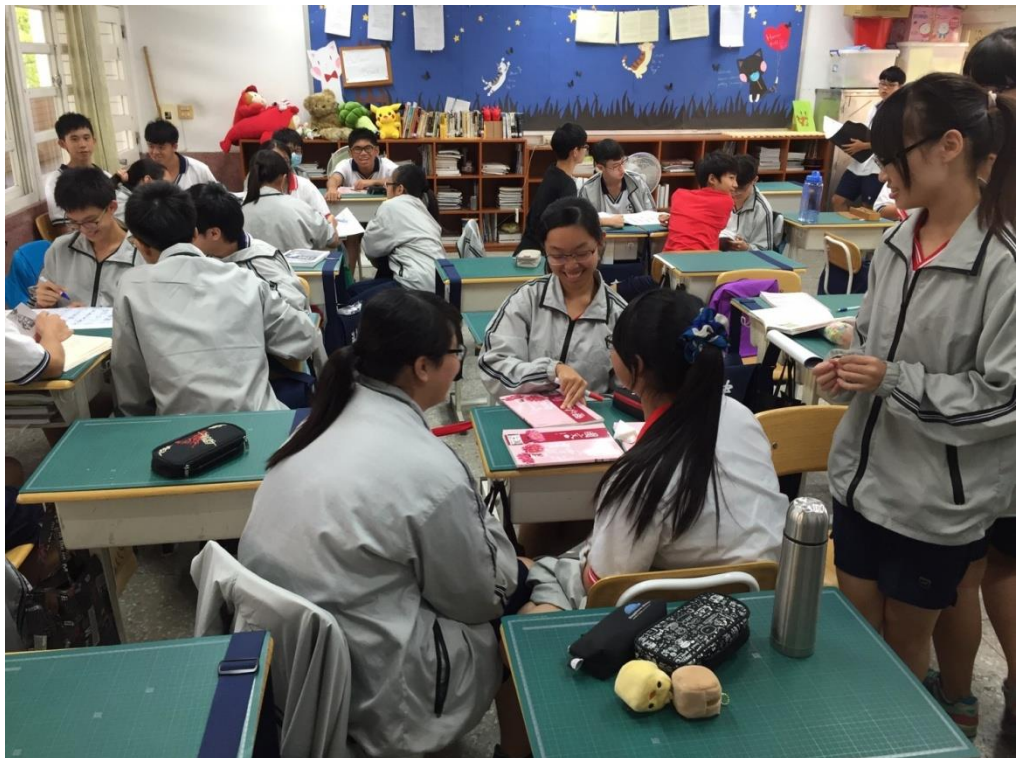
高一 1 學生