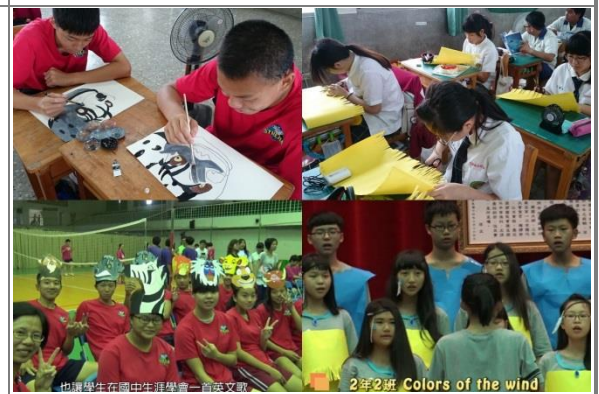
美術道具製作、呈現