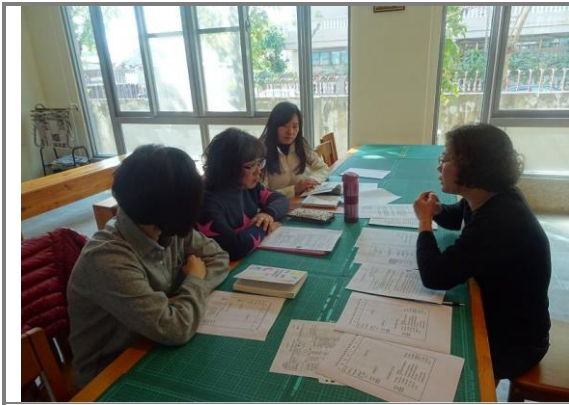
課程計畫討論、共備