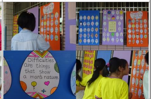
彩蛋製作、發表、美感欣賞