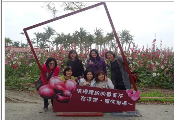
美感教育校外研習