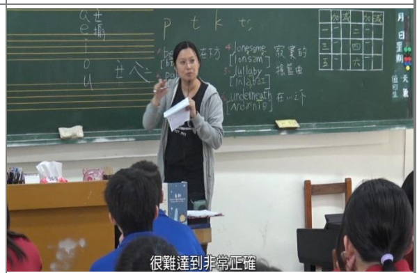
英語老師協同正確發音