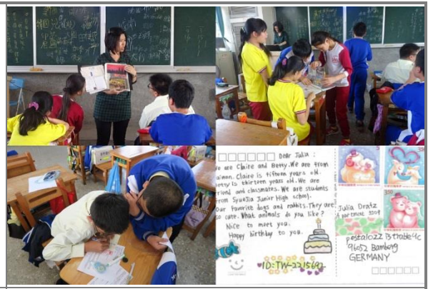
英語明信片介紹、製作