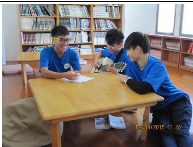
圖書館尋索祖先的線索、故鄉的故事