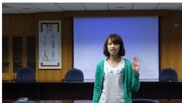
國文宗明珊教師與同學說明〈故鄉書寫〉蒐集資料之課前準備事宜