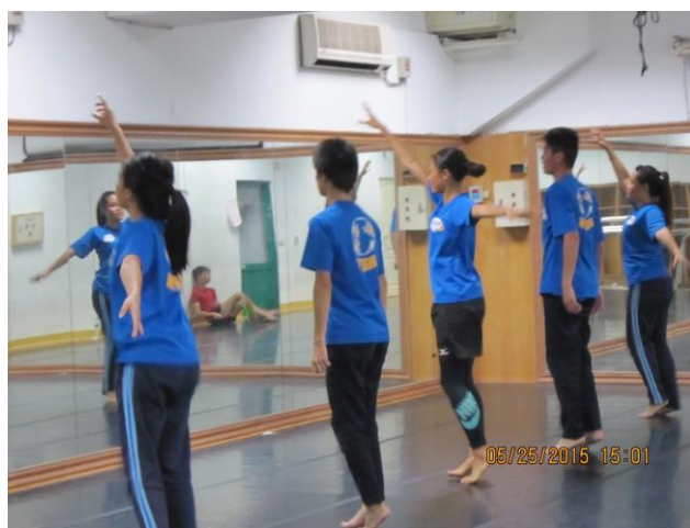
表演藝術配合創作樂曲之意涵舞動肢體