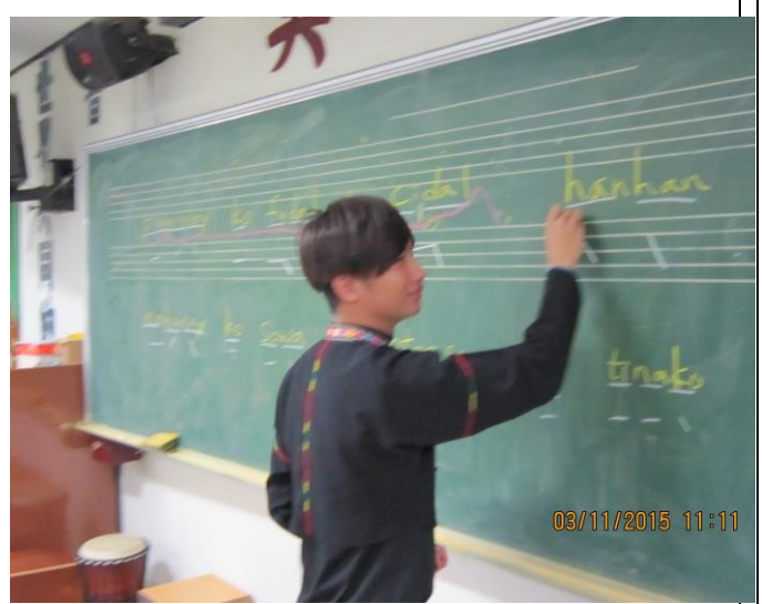
語言與旋律線條的關係