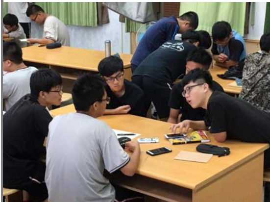
分組討論～題目抽籤