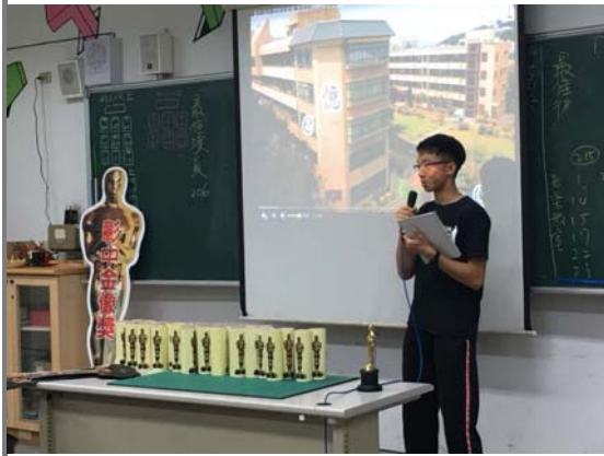
班級影展～作品分享與討論