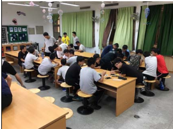
分組討論～題目抽籤