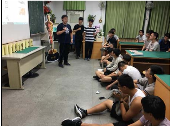
班級影展～作品分享與討論