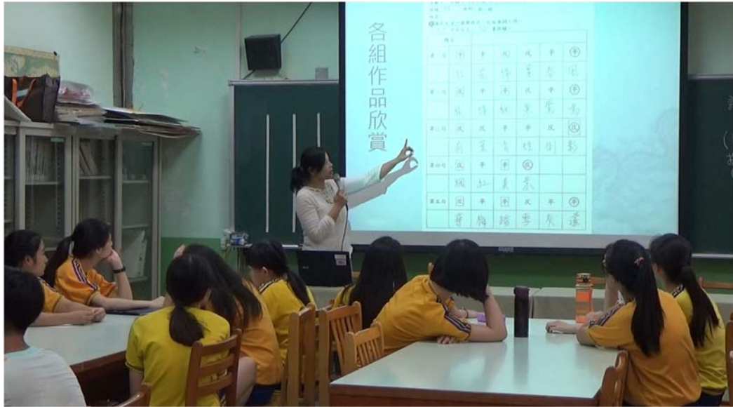
學生對各組填詞作品進行評分