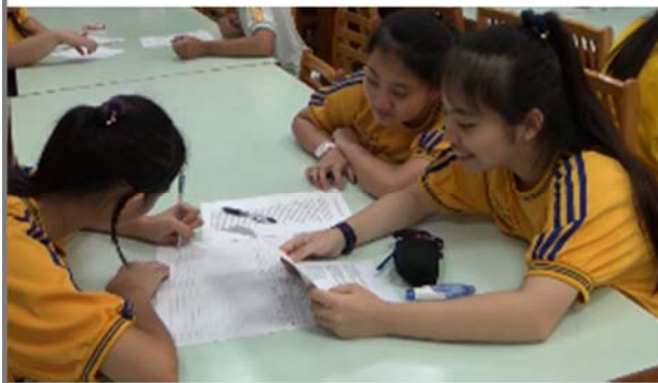
學生分組討論音樂文本比較活動