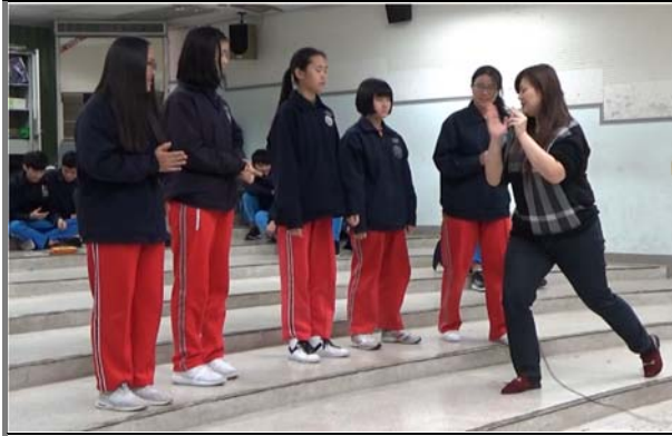
音樂老師指導學生進行「找聲音玩節奏」活動