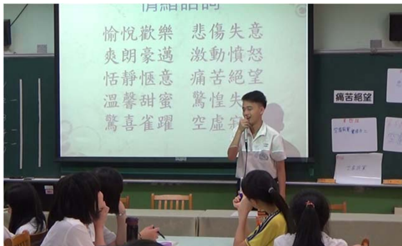
各組上台朗讀自己組別的作品進行「聲音傳情」活動