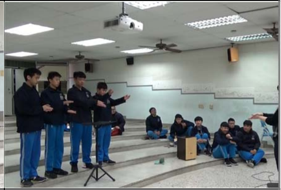
音樂老師指導學生進行「找聲音玩節奏」活動