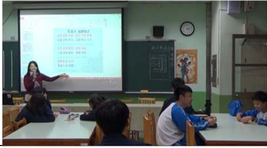
教師講解元曲〈天淨沙〉曲牌格式