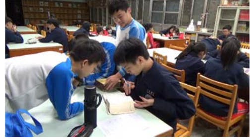
學生分組練習填詞活動