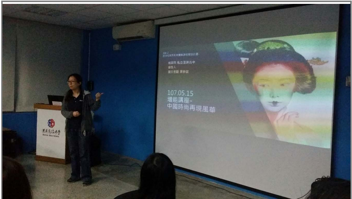
增能講座為本校同仁推廣跨領域概念