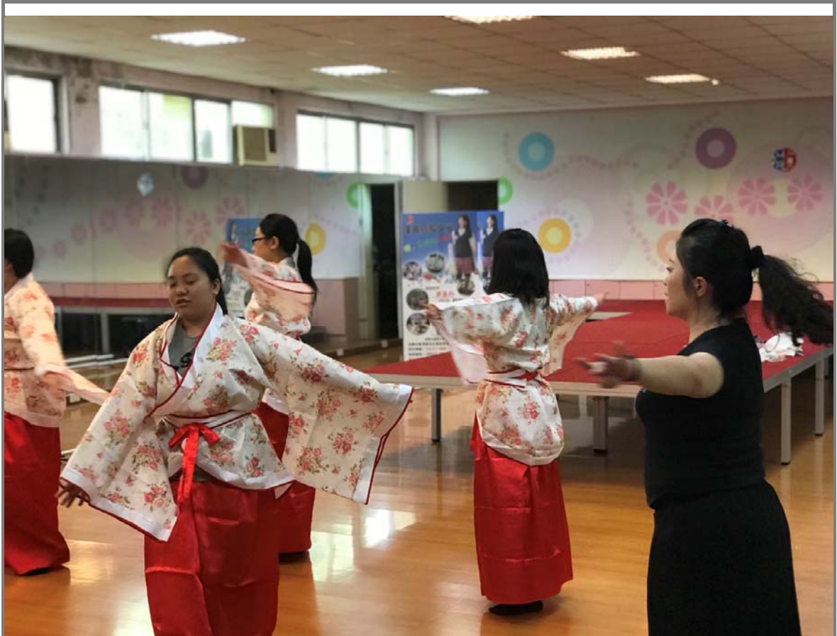
老師示範唐舞平手旋轉的動作