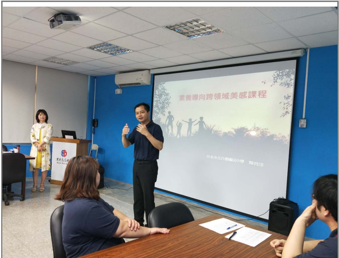
教務主任為大家說明學校課程安排的想法