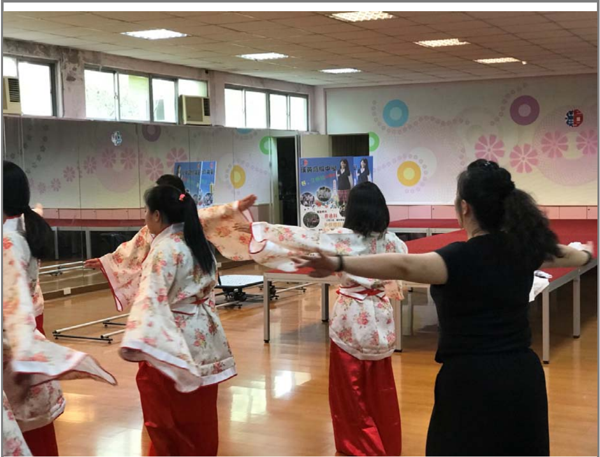
老師指導學生腳跟旋轉平手的技巧