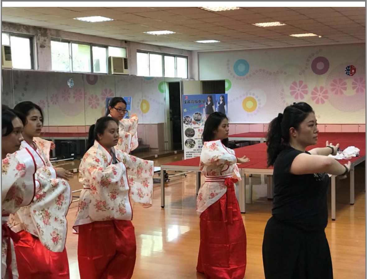
老師示範唐舞身段與腳步