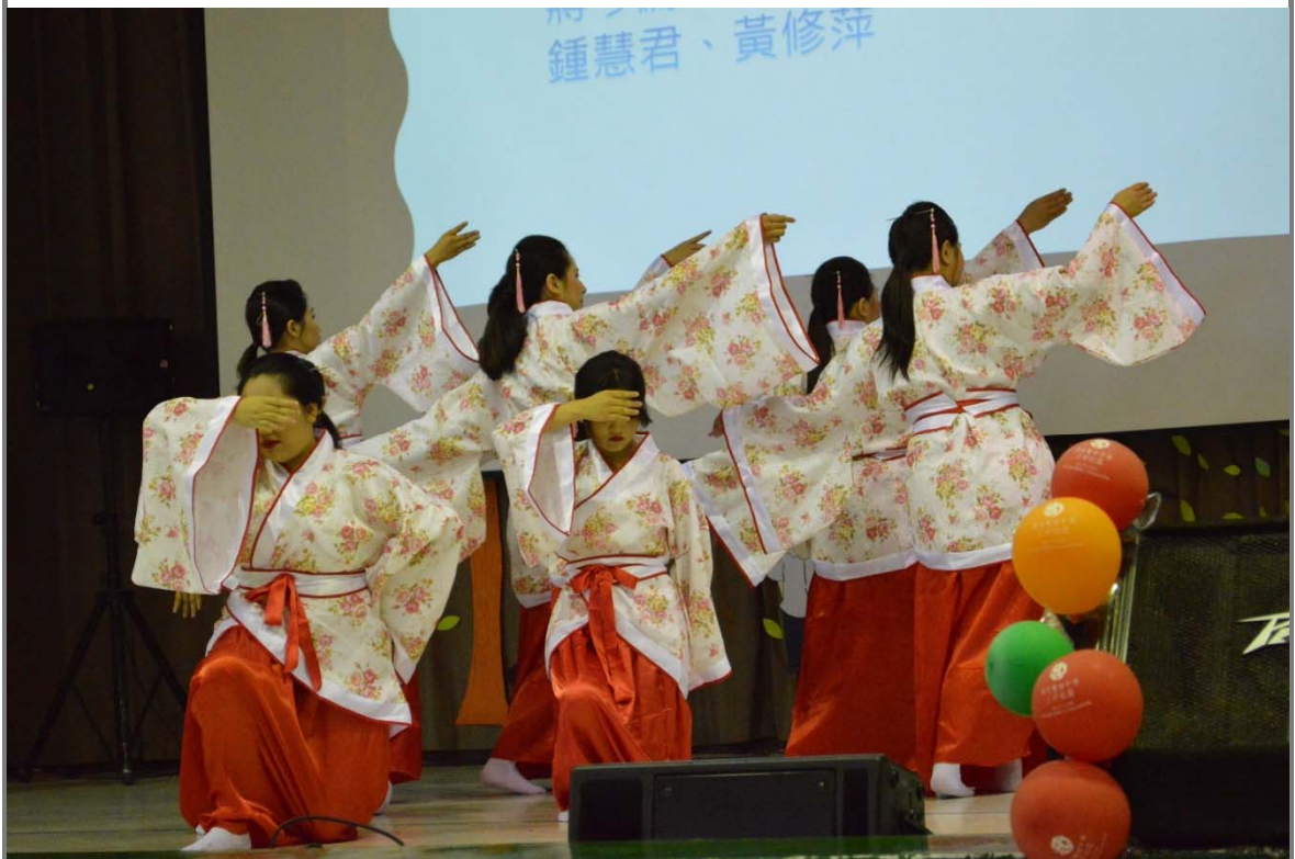
成果發表演出：唐袖舞今采