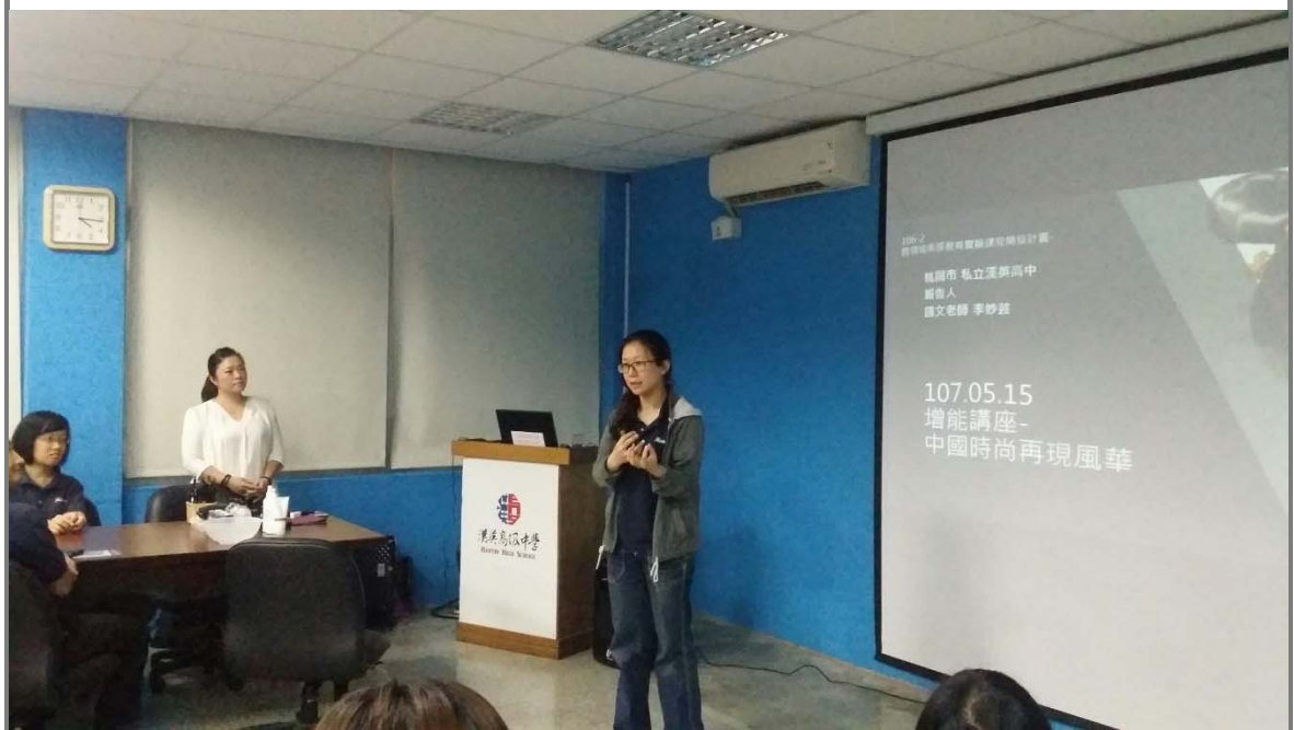
為同仁建構本校跨科的計畫與願景