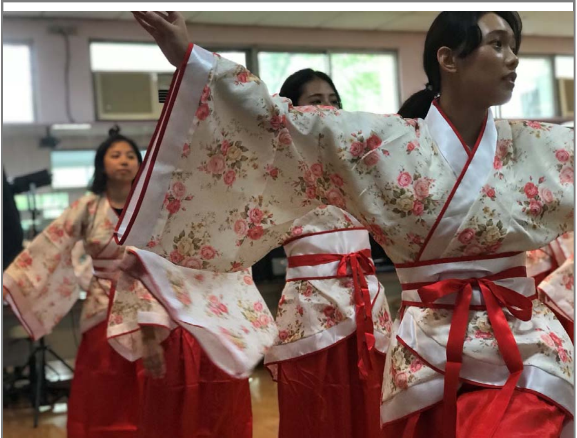
學生專注而投入在舞步與音樂之中