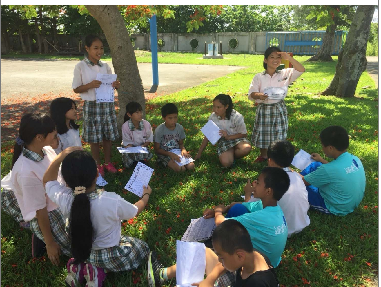
國語課讀劇本練習