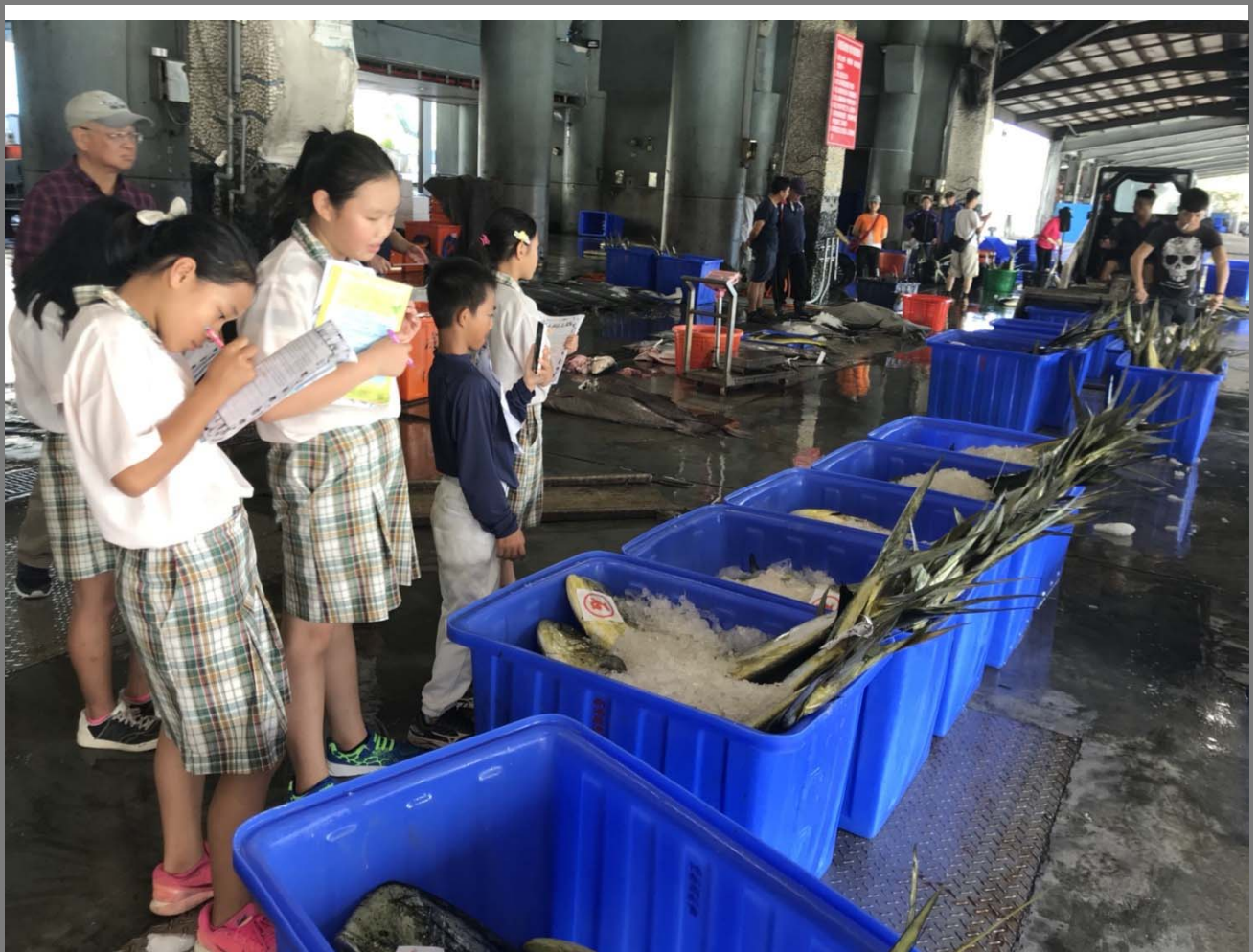
社會課至新港漁港實地踏查