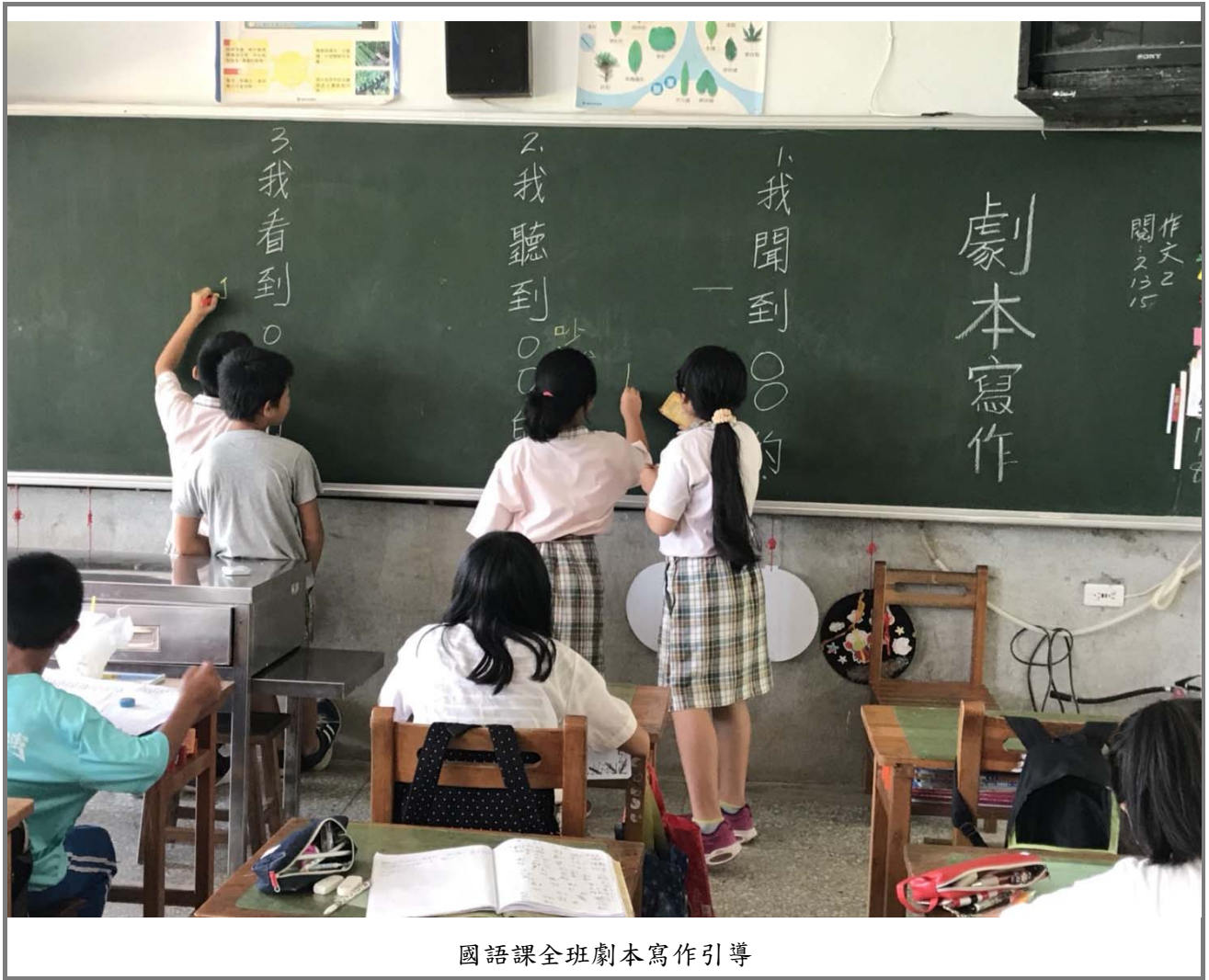
國語課全班劇本寫作引導