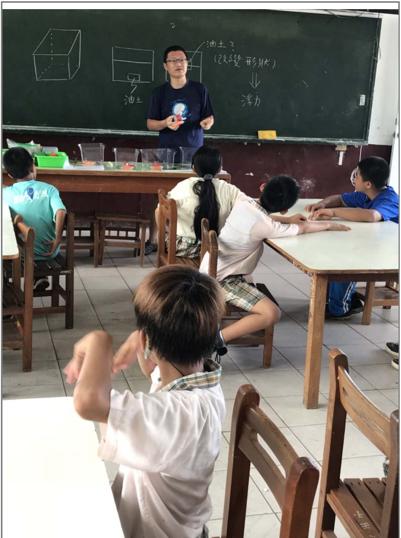
自然課浮力實驗說明