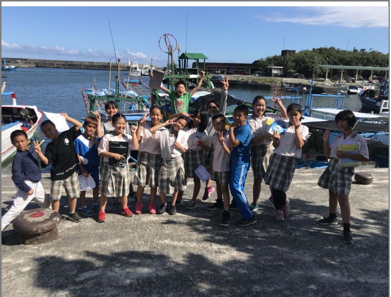
學生觀察港口船隻為自然科浮力作課前引導