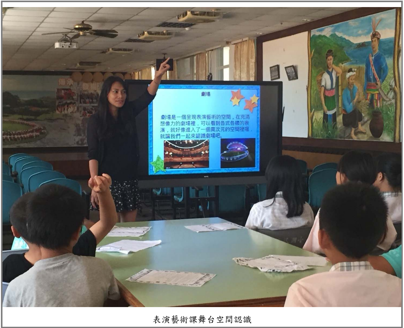
表演藝術課舞台空間認識