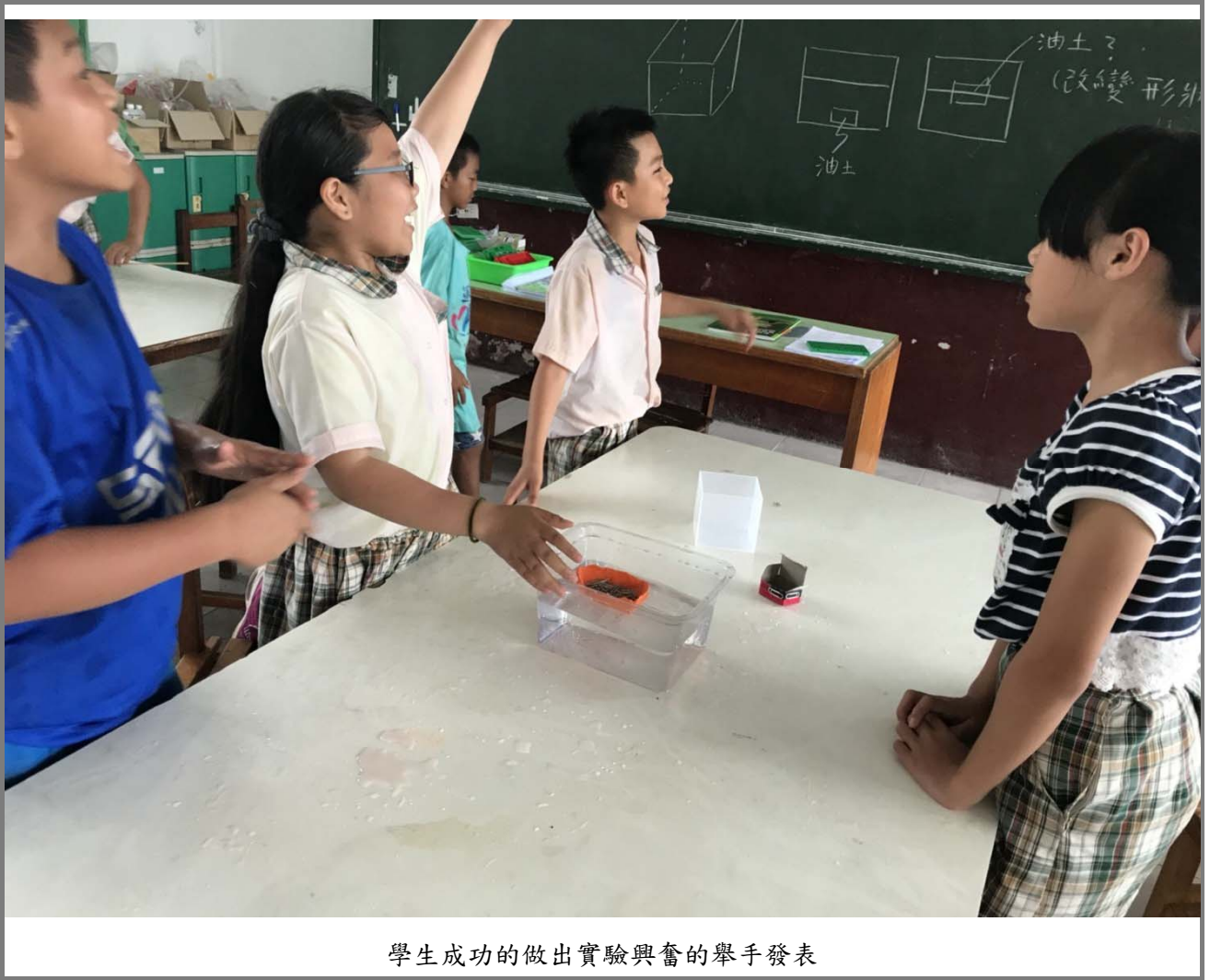
學生成功的做出實驗興奮的舉手發表