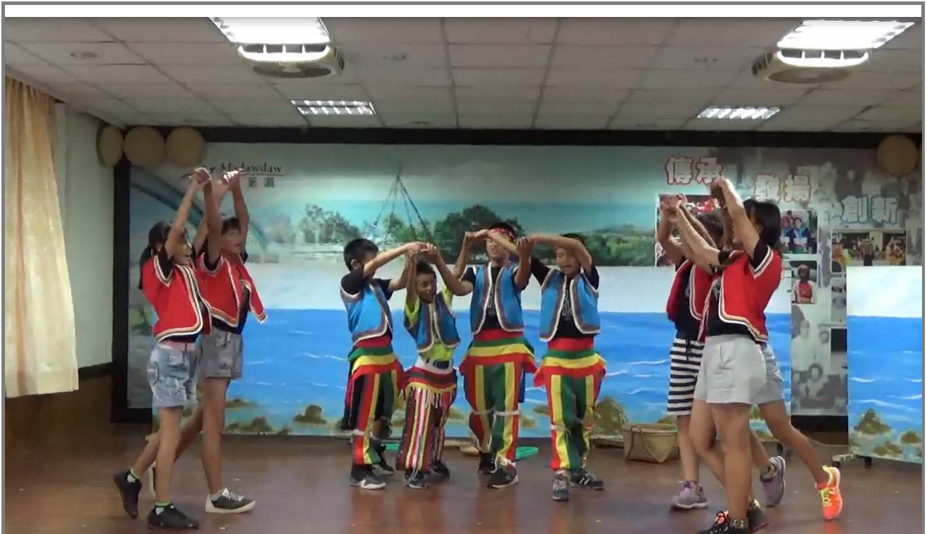
舞台走位彩排練習