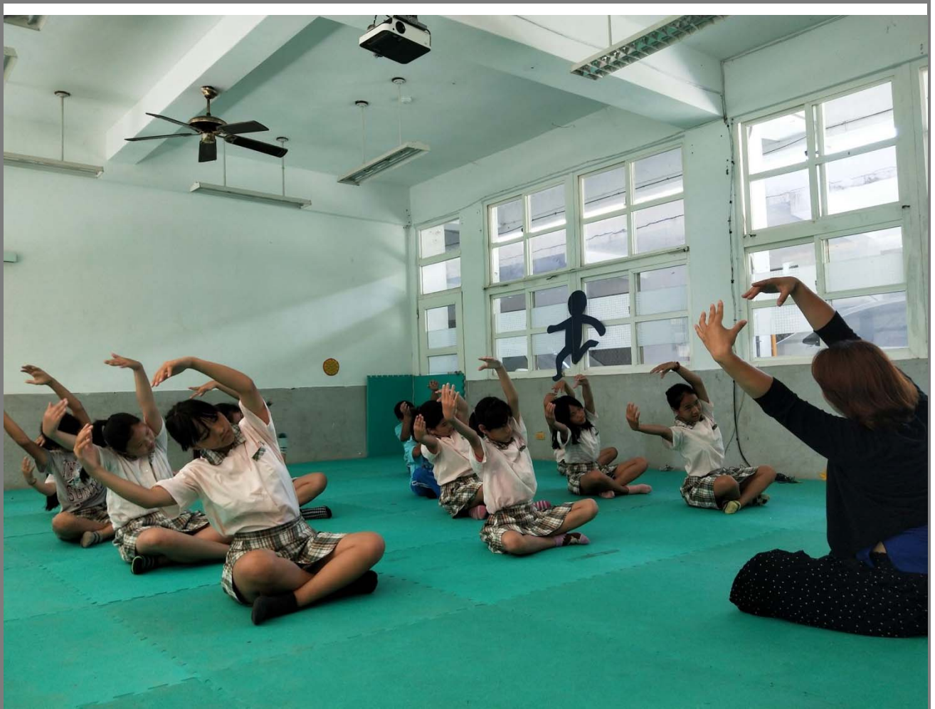
表演藝術課肢體伸展