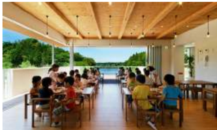
■ 日本三重縣TN保育所廳 校園與週圍環境共構