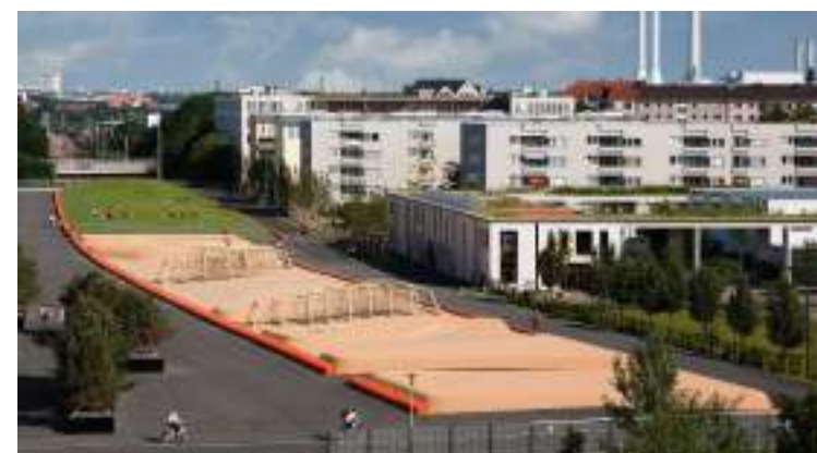
■ 德國慕尼黑特蕾西婭社區廣場 鏈結校園與社區間的教育場，體認地域中的山與海記憶