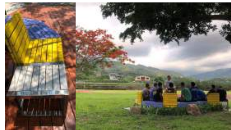
■ 國立水里高級商工職業學校 校園空間中，我們創造對話的山景記憶