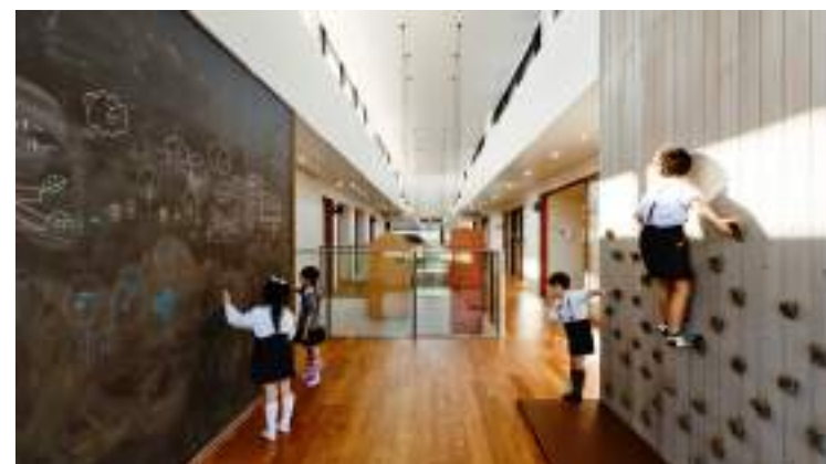
■ 日本神奈川縣AN幼兒園 身體的探知即為美感記憶的發起線