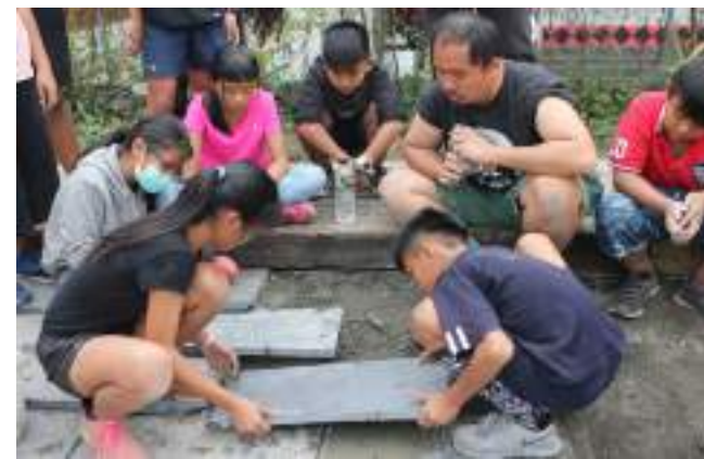
■ 屏東縣泰武鄉泰武國民小學 營造校園共同美學，傳承文化思辨能力