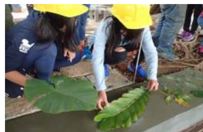
■ 新北市八里區米倉國民小學 發掘校園自然生態的肌理之美