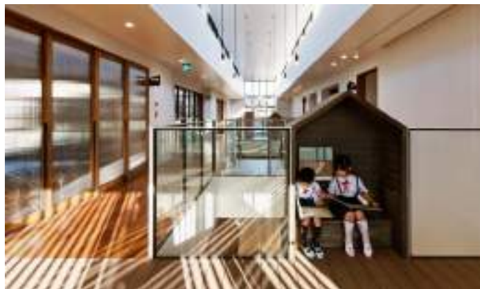
■ 日本神奈川縣AN幼兒園 創造光影流動的空間體驗