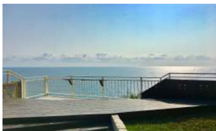
■ 新北市瑞芳區鼻頭國民小學 打開圍牆，看見學校就在太平洋的海崖旁