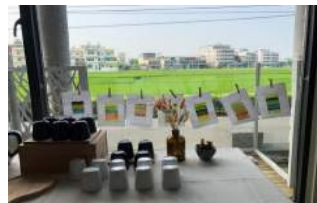
■ 臺中市立霧峰國民中學 打開教室牆壁，探索環境色彩感染力