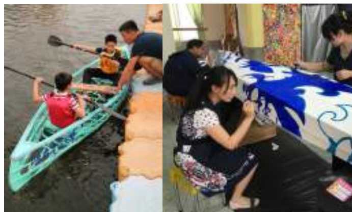
■ 高雄市立彌陀國民小學 由教師引領學生探索河域文化的行為美學