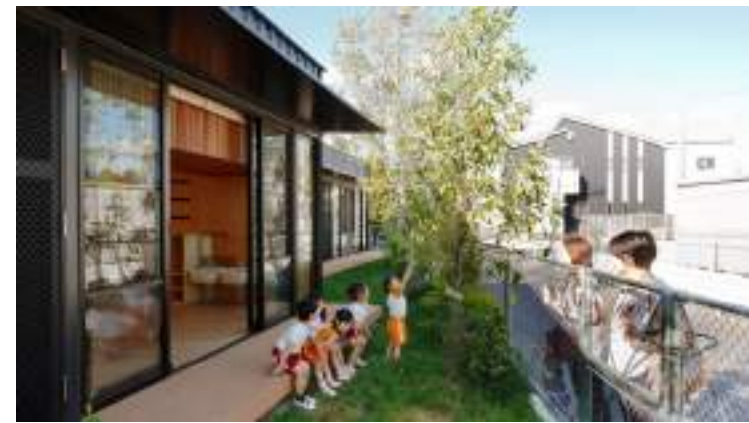
■ 日本埼玉縣OA 幼兒園 打破圍籬，打造無界線的校園與社區關係