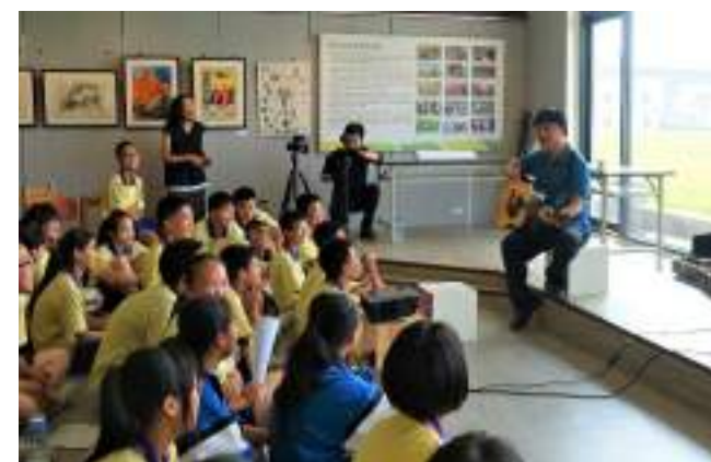
■ 臺中市立霧峰國民中學 具感動力的教育空間，創造師生共同回憶