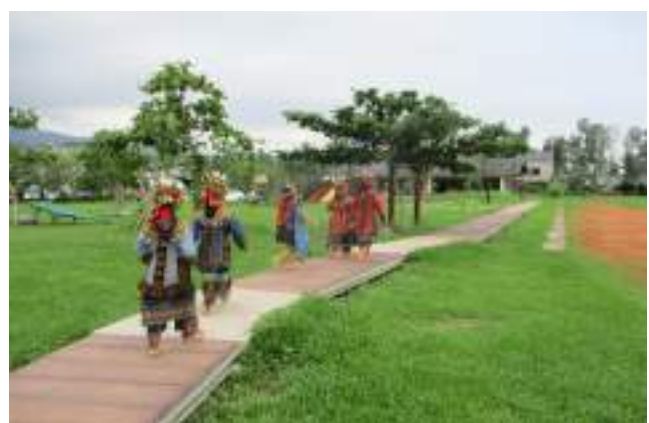
■ 屏東縣泰武鄉泰武國民小學 一條古謠步道創造師生複合性的共同故事