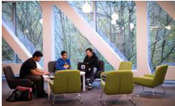
■ 比利時布魯塞爾市布魯塞爾國際學校 多元文化校園營造創智跨能的學習角落