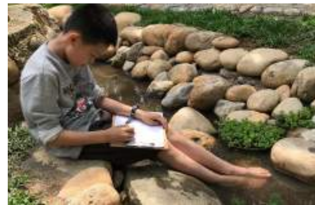
■ 桃園市八德區霄裡國民小學 微風、水紋、水草...，學習校園存在的美感基因