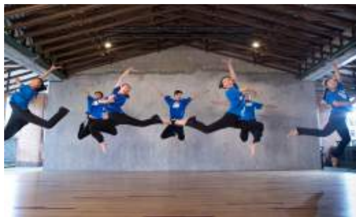
■ 宜蘭縣立復興國民中學 將閒置廁所改造為飛躍的創意逐夢劇場