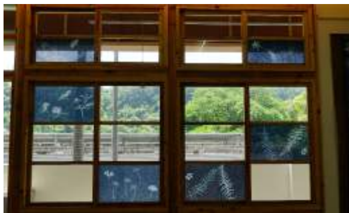
■ 新竹縣芎林鄉五龍國民小學 透過藍染濾鏡欣賞不同的山、光、景、色