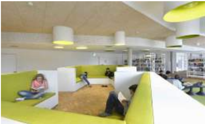
■ 德國漢堡市易北河島中小學 創造校園多層次的空間載體，促進對話關係