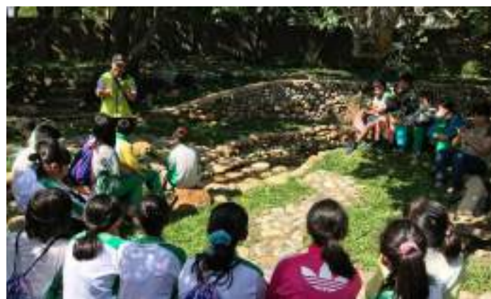
■ 桃園市八德區霄裡國民小學 重現湧泉創造師生共同討論環境美學原素課程