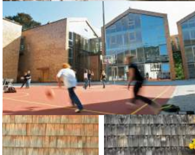
■ 奧地利薩爾茲堡市聖吉爾根國際學校 對傳統與歷史致敬，重現山城文化美學