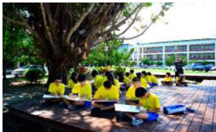
■ 臺東縣立新生國民中學 改善樹下生態，拉進基地共學課程的感受力