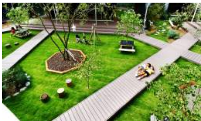
■ 日本茨城縣土合舍利保育園 (Doaishari幼兒園) 身體與行為探知的校園美感