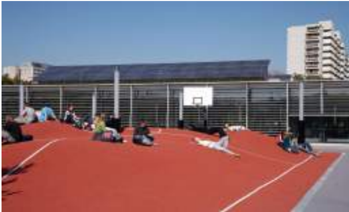
■ 德國慕尼黑市慕尼黑市立職業學校 營造青少年彼此間的互動交流場域