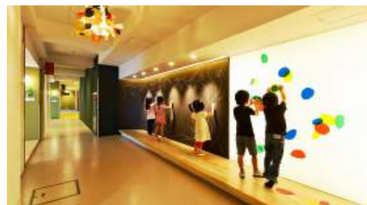
■ 日本神奈川縣MK幼兒園 發現色彩與構成的探索場域