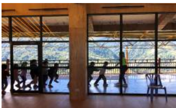
■ 臺中市立梨山國民中小學 打通教室的籬牆，看見高山的山林美學