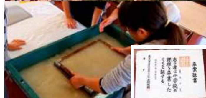
■ 日本埼玉縣宮代町立笠原小學校 連結校園與社區文化自然美學的教育場