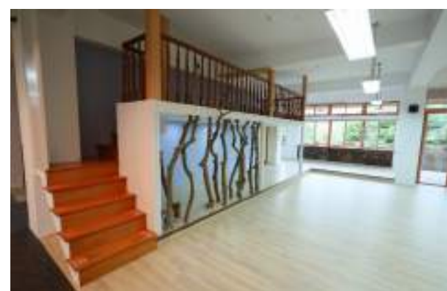
■ 宜蘭縣立人文國民中小學 引入在地農產故事，讓質感與孩子直接對話