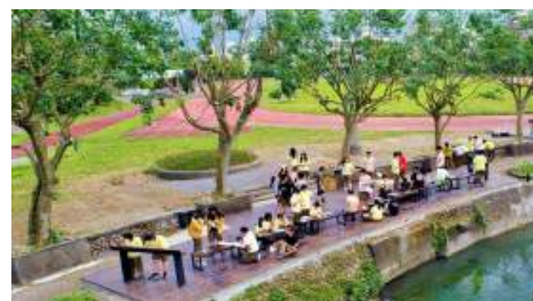
■ 國立羅東高級中學 強調「學校」與「河道」空間的關係美學