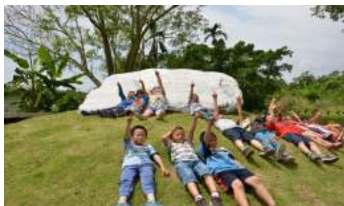
■ 花蓮縣秀林鄉崇德國民小學 拆掉人工遊具，立霧山下就有最美樂園