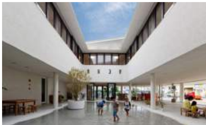
■ 日本熊本縣Daiichi 幼兒園 運用藍天白雲和庭園地標的複合空間