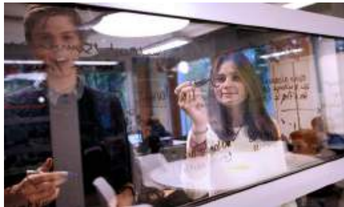
■ 比利時布魯塞爾市布魯塞爾國際學校 選擇玻璃帷幕的教室隔牆，促成教學與對話