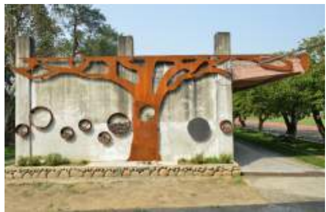
■ 新竹縣新埔鎮寶石國民小學 尋找舊建築的肌理美學，發現校園四季變化