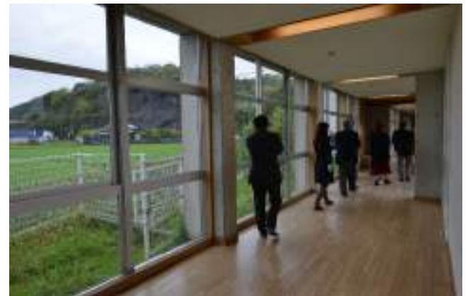
■ 日本福岡縣嘉麻市立下山田小學 強調「學校」與「社區」間的場域美學教育場