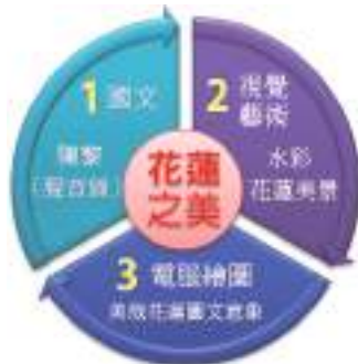
圖 1 第一次循環課程架構圖