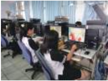
圖 58 學生電腦繪圖課