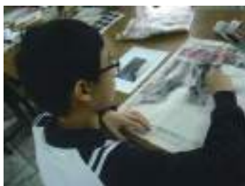
圖 36 學生參考圖片以報紙印拓太魯閣隧道美景