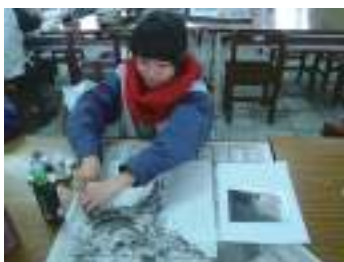
圖 35 學生參考圖片以報紙印拓太魯閣山石之美