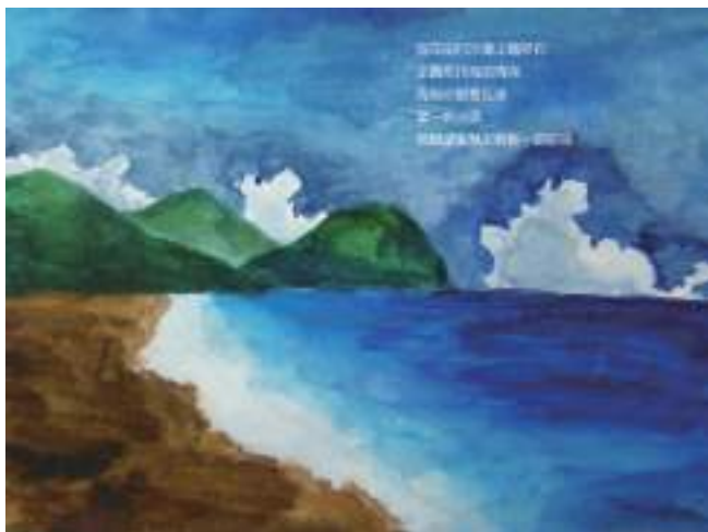
圖 28 另一位詩人詠七星潭之詩作，學生描繪七星潭海景