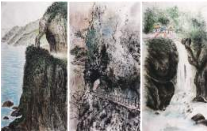
圖 39 學生描繪之水墨四開作品：太魯閣國家公園一中橫攬勝、清水斷崖、長春飛瀑