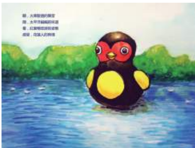
圖 29 學生自行創作之詠花蓮之新詩，圖文洋溢學子之純真