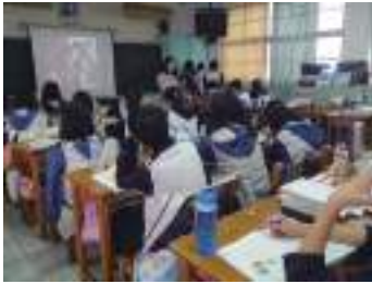
圖 15 學生簡報報導太平洋 詩歌節