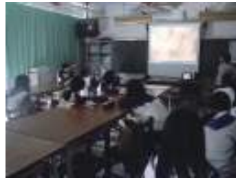
圖 32 繪本《紋山》圖像表現：水墨山石肌理