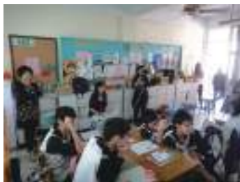
圖 53 學生發表成果：訪視委員觀課（錄影中）