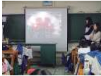
圖 16 學生上臺簡報報告花 蓮之聲