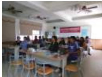
圖 6 老師們聆聽花蓮古蹟建築融入美感教育