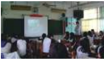
圖 48 老師播放未來空中運輸影片