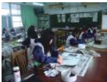
圖 38 學生參考圖片以報紙印拓太魯閣山石之美