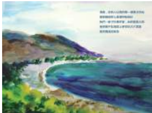
圖 27 花蓮詩人詠七星潭之詩作，學生插圖描繪七星潭海景