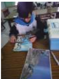
圖 21 學生參考書本清水斷崖圖片描繪太平洋