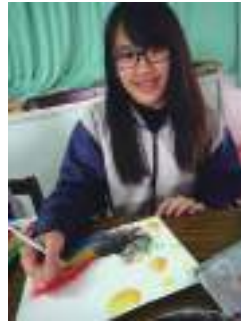
圖 24 太魯族學生描繪彩虹幻化之美少女