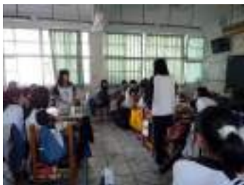
圖 52 學生分組報告並分組交叉提問討論