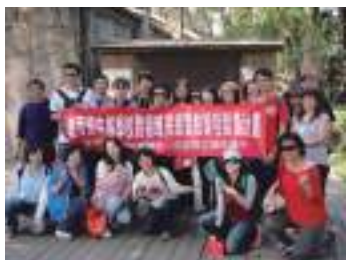
圖 11 陸軍兵事部（松園別館）—美感教師工作坊：實地踏查教師合影