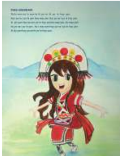
圖 26 這位學生是阿美族學生，詩文部分則改以阿美族歌謠