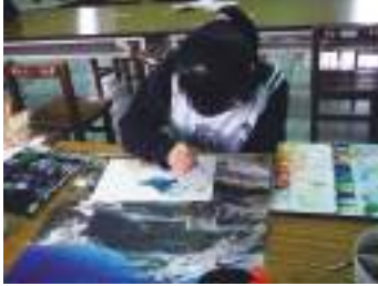
圖 23 學生參考月曆圖片描繪合歡山雪景