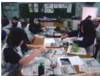
圖 37 學生參考圖片以報紙印拓太魯閣山石之美