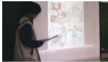
圖 49 學生以簡報圖檔發表 2030 花蓮未來想像圖