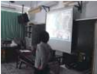
圖 31 湯師簡報介紹繪本《紋山》與中橫開發