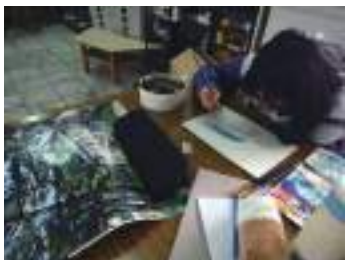
圖 19 學生參考月曆圖片描繪松園之美