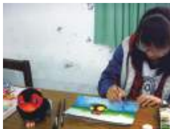
圖 22 學生參考花蓮鯉魚潭紅面鴨玩偶與照片創作