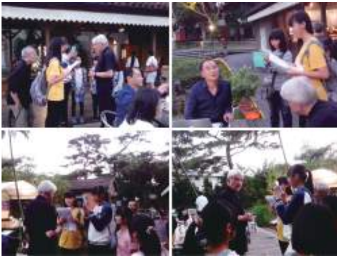
圖 25 學生課餘時間至花蓮松園採訪 2014 第九屆太平洋詩歌節