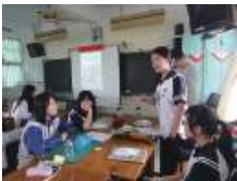
圖 50 學生分組報告並分組交叉提問討論