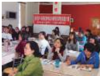
圖 10 校長與教師們在會議室專注聽講—〈花蓮日治時期遺跡踏查〉