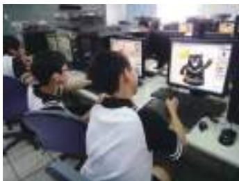
圖 56 學生電腦繪圖描繪黑熊：並加上 Hualien 字