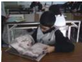
圖 34 學生閱讀繪本《紋山》