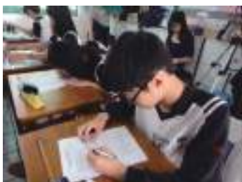
圖 44 學生填寫歷史補充教材之學習單：訪視委員