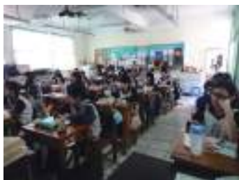
圖 43 學生專注聆聽