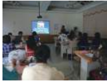
圖 8 邱上林老師介紹花蓮飛行前輩：東華大學音樂系教授彭興讓，發掘巨觀花蓮美景