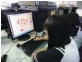
圖 55 學生電腦繪圖課描繪阿美族少女