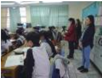
圖 17 學生發表成果錄影中