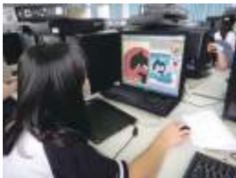
圖 54 學生電腦繪圖課描繪賞鯨