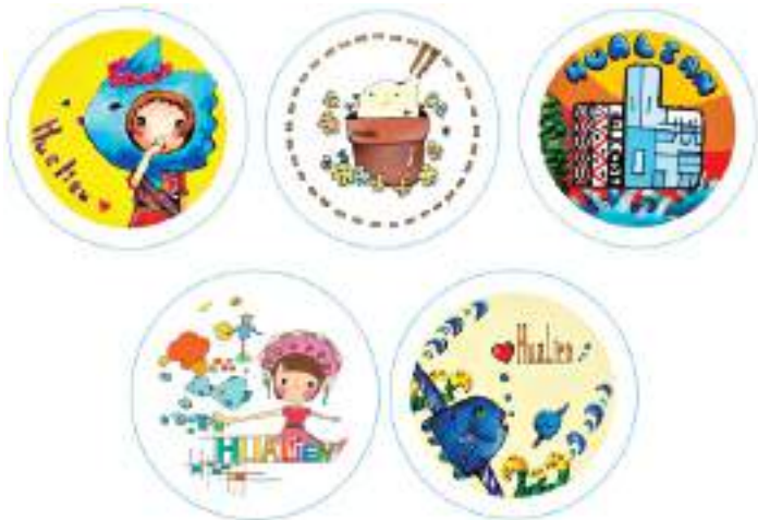
圖 60 學生徽章電腦繪圖作品