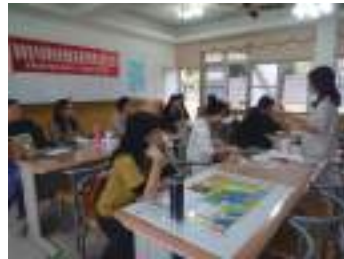
圖 4 本校藝文領域教師研習工作坊