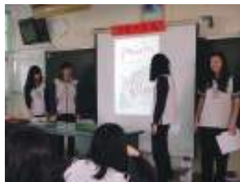
圖 51 學生上臺報告分組合作學習之簡報圖