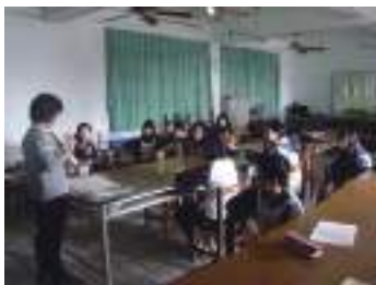
圖 33 學生聆聽湯師導覽介紹繪本《紋山》