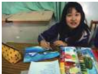
圖 20 學生描繪七星潭海景，詩文在旁