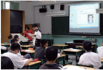
圖 14 介紹配樂作曲家