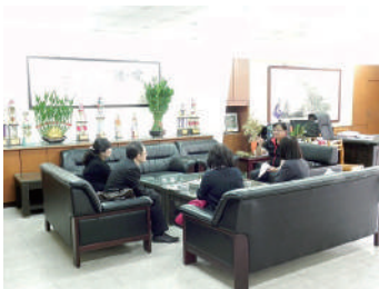
圖 3 教授訪視前於校長室與校長座談