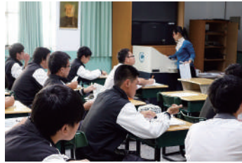
圖 15 英文老師引導學生歌詞填空