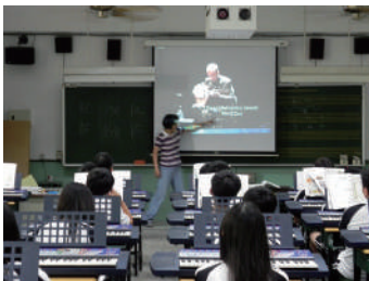
圖 18 音樂科以圖片介紹阿拉伯樂器烏德琴