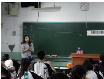
圖 20 數學老師以鍵盤圖為例介紹等比級數