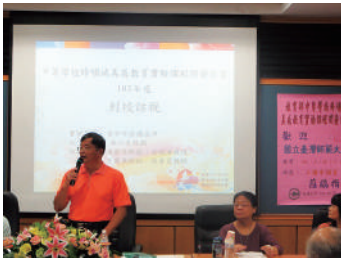
圖 1 掛牌儀式中本校校長致詞

議，讓我們在教學中不斷改進，也激發出原來沒有想到過教學火花；工作坊的進行更是在教材教法上給教師群非常大的幫助，每次工作坊講師的演講內容，都使參與的同仁私下不斷詢問是否有更進階的內容，我想，這種種都反應了不斷的刺激和反芻都是教學工作成長的重要步驟（參考圖 1-4）。