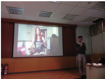
圖 8 介紹日本的島唄及三弦