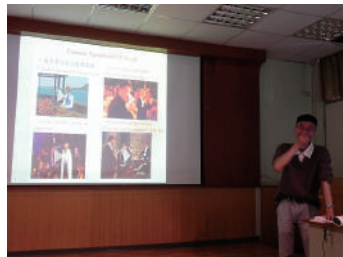
圖 9 介紹拿坡里民謠