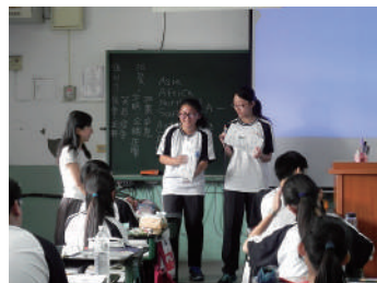
圖 25 同學上臺報告以英語報告同組同學所做的說明