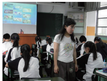
圖 21 英文科老師引導學生欣賞