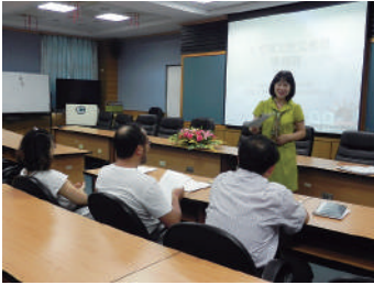
圖 10 魏老師為與會老師說明主題