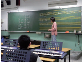
圖 16 利用電子琴鍵盤介紹歌曲結構