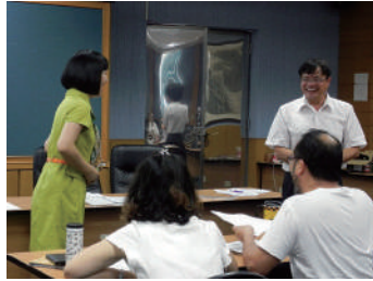
圖 11 本校校長為工作坊開場