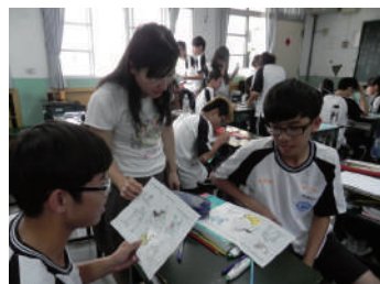
圖 23 英文科老師以著色引導學生動機