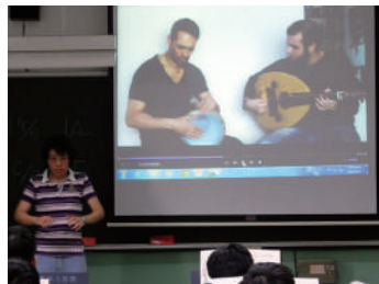
圖 19 音樂科介紹阿拉伯手鼓打法和欣賞