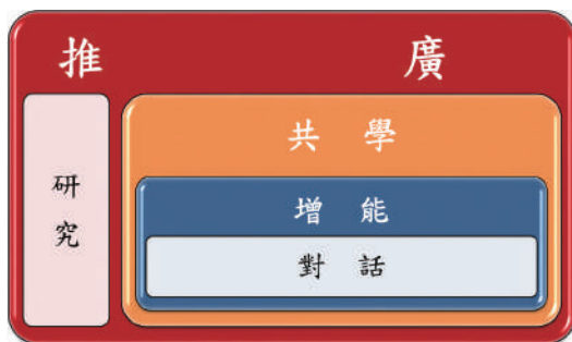
圖 1 實施方式五階段互為表裡

如前所述，實施方式分為五個階段：對話、增能、共學、研究與推廣（見圖 1），雖起於對話，終於推廣，其實每個階段互為表裡，均為落實美感教育目標的基礎。如果沒有教授團隊跟夥伴學校行政與老師端的對話、藝術教師與其他學科老師的對話，夥伴學校無法成立、跨領域美感實驗教案無法落實；如果沒有增能研習工作坊，跨領域的美感教學知能無法發展；如果沒有建立「學習共同體」的共學文化，跨領域美感協同教學無法推動；如果學校教師沒有多元的研究素養，跨領域的美感實驗工作無法進行；如果實驗課程的成果沒有夥伴教師在縣市、全國甚至於網站上的教學平臺演示，跨領域的推廣工作無法成功。