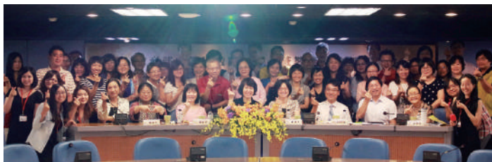
圖 2 聯席會議與諮詢會議合照

會議中安排各區教授團隊與夥伴學校行政團隊於國立臺灣師範大學相見歡（見圖 2），使夥伴學校瞭解跨領域之內涵，並讓教授團隊聽取夥伴學校執行之問題，最後初步擬定教學草案之方向，並且規劃訪問夥伴學校之適宜時程。