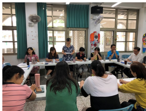
素碧老師提出課程實施方式與時間