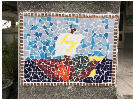
馬賽克作品妝點美麗的校園