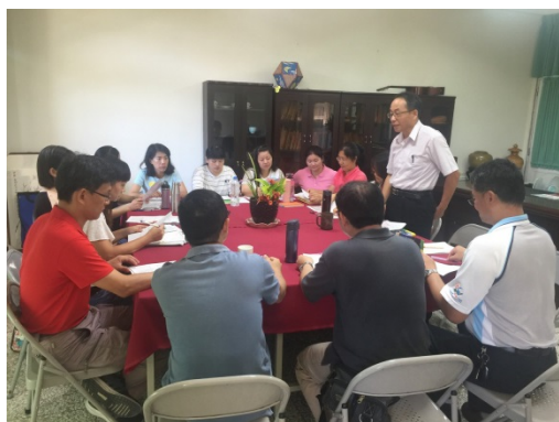
陳校長取得全體教師共識申請該計畫