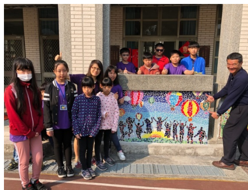
六甲師生一起在作品前合影留念