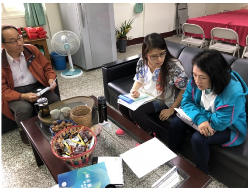
行政人員與藝術老師討論課程內容