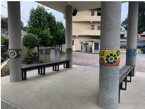
馬賽克作品妝點美麗的校園