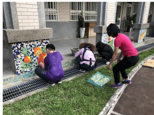
麗娟老師協同教學協助學生完成作品