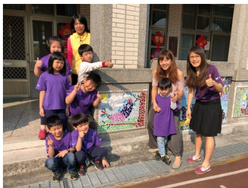
一甲師生一起在作品前合影留念