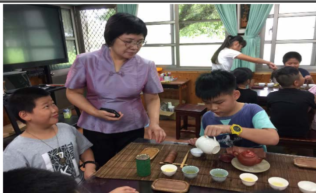
老師指導泡茶方法及禮儀