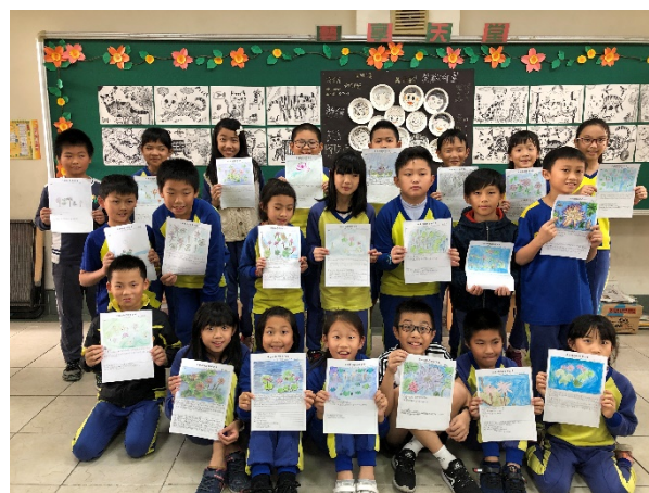
學生完成水生植物寫生學習單