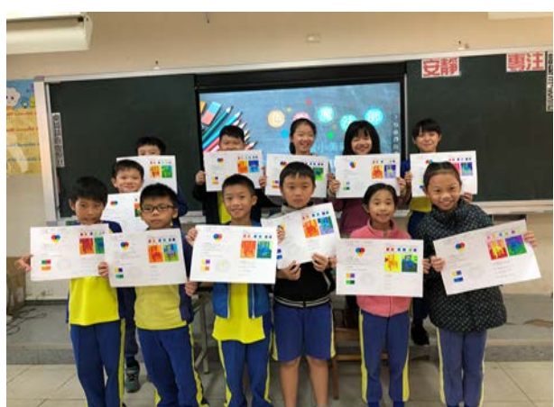
學生完成色彩魔法師學習單成果。

*十二年國教課程綱要參考網址： https://www.naer.edu.tw/files/15-1000-14113,c639-