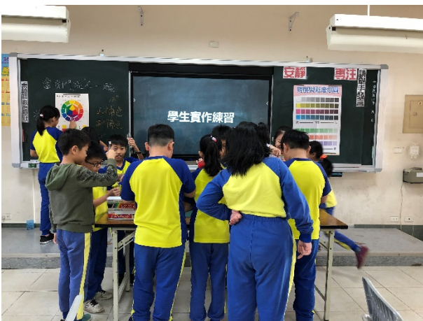
下課後學生興致勃勃玩色彩。