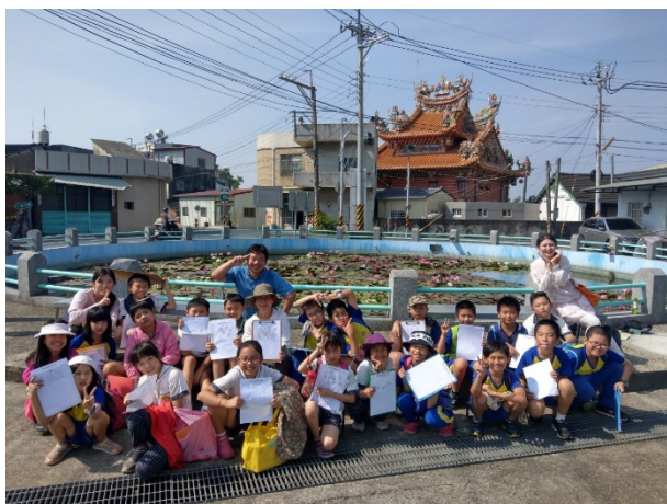
水生植物觀察記錄