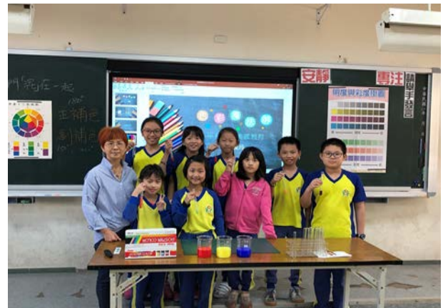
學生利用試管實作老師指定的色彩。