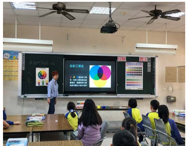
老師介紹色彩三原色。