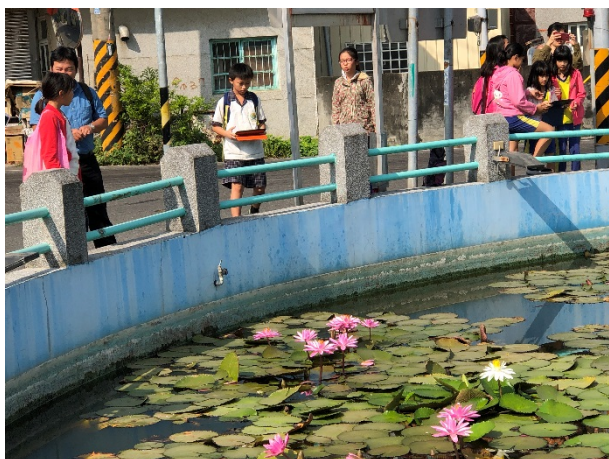
利用平板記錄睡蓮姿態