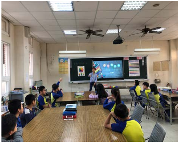
引起動機，老師提問。