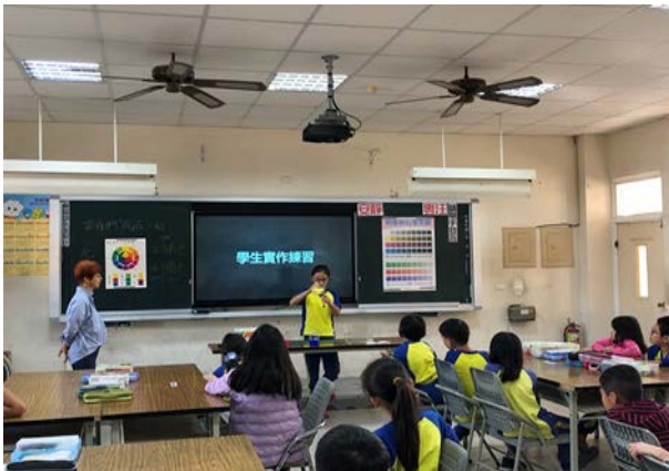
學生利用試管實作老師指定的色彩。