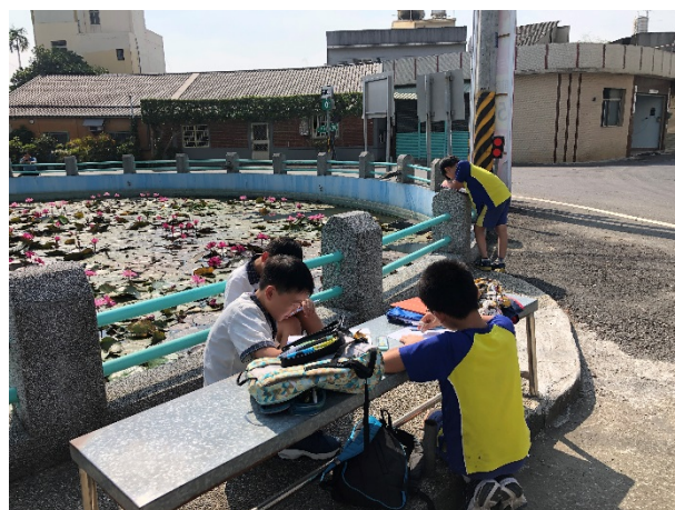
努力地把睡蓮最美的姿態畫下來