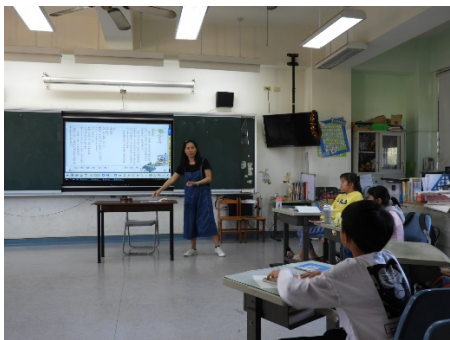
指導說明劇本內容