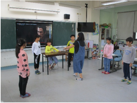
教師指導動作及表情的呈現