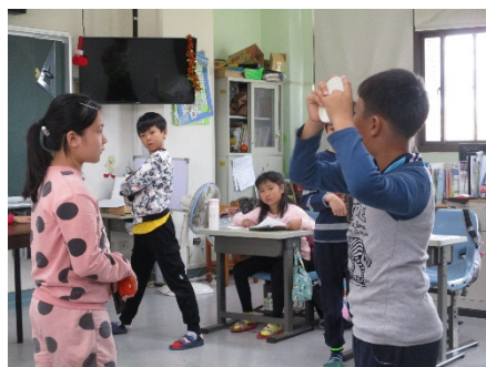
學生表現出故事角色的動作

*十二年國教課程綱要參考網址： https://www.naer.edu.tw/files/15-1000-14113,c639-1.php?Lang=zh-tw