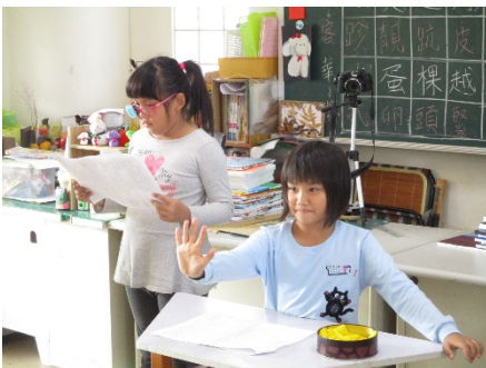
三年級練習肢體表情演出