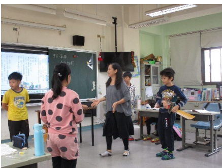
教師指導學生排演戲劇