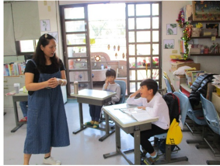
討論表演後的省思