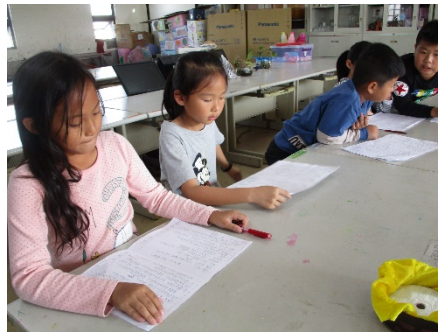
練習朗讀劇本內容