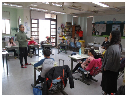
公開觀課教師進行教學