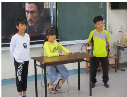
學生扮演劇情角色