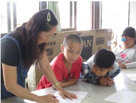
指導學生認識劇本