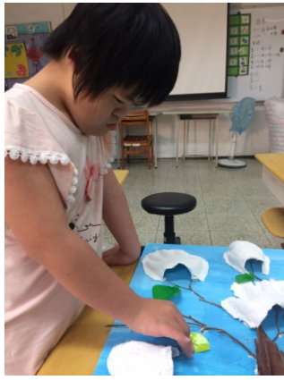
我的手模放在那裡好呢？