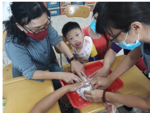
學生不耐煩了，一直想抽手，有阿姨來幫忙，5 比 1，才完成