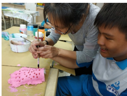
老師扶著學生的手進行手模彩繪