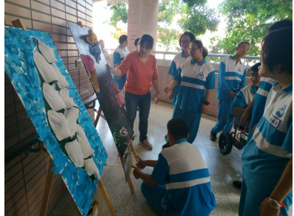
成果展，種籽教講解作品欣賞