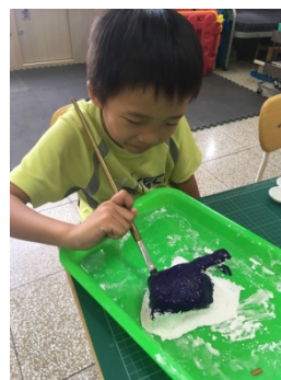
小二學生自己畫蛙哦