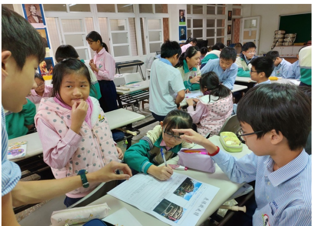
社會領域：透過實地踏察，分成五組，完成「ORID 鹿港微走讀」學習單。