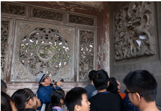
認識龍山寺經典-八卦夔龍窗及兩側「青龍」「白虎」雕刻的圖騰意涵。