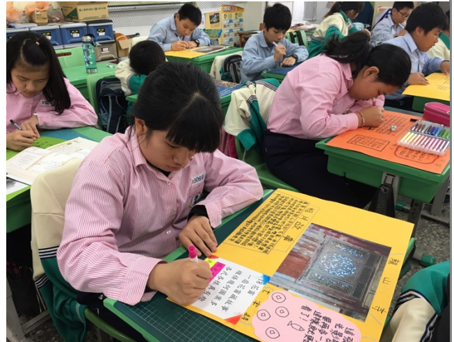
選一張自己拍得最有感的照片，完成「七字詩」解說、心得、美編。完成後，做為實體展覽。