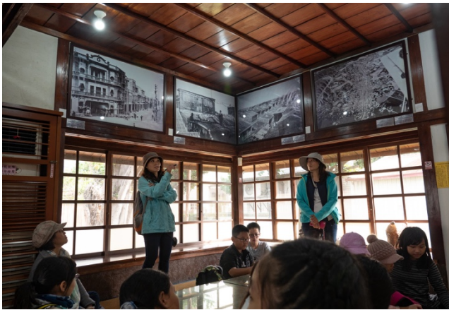
和室建築，這裡是街役所，了解鹿港鎮的「鎮徽」圖騰是由日文字演化而來。