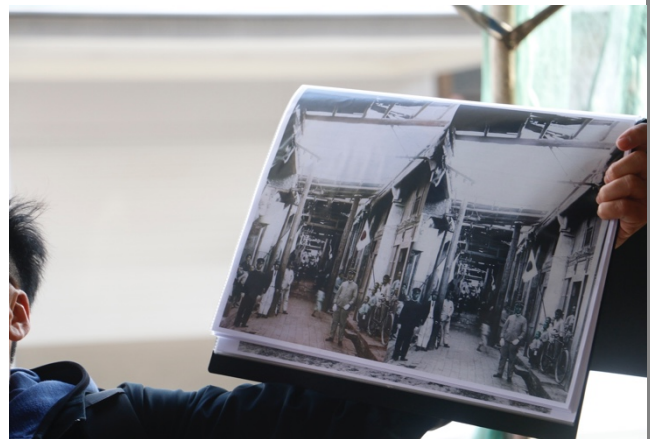
走在現場街道上與日治時期的照片比對，見證時代的變遷。照片，記錄了時代，記錄了你我。