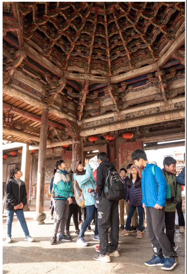
「八卦藻井」的紅藍黃色彩美學、書法名家字帖、擴音戲台設計、完全不用一根釘子的建築工學。