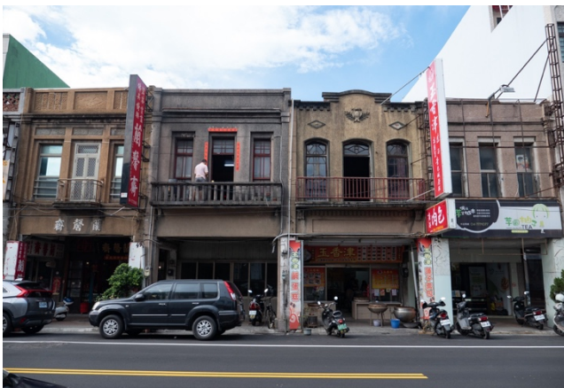
認識、欣賞街道立面的獨特之處，洗石子的工法、不同的泥塑裝飾、不同的木窗框花紋，有日治、有現代。