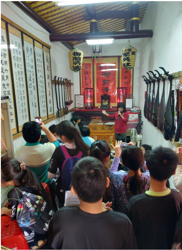
參觀位於龍山寺內的南管館閣「聚英社」，認識並實際體驗南管樂器，共 11 樣，以及南管工尺譜的手抄本。