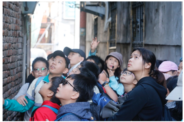
仔細看察紅磚建築上的「美美角角」，一邊是紅磚牆，另一邊是水泥。走在巷弄裡，時空交錯。