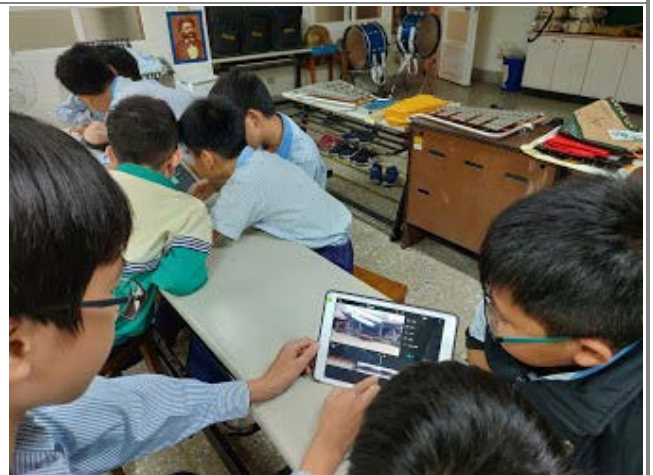
2-3 人一組，利用 iMove 軟體，完成一趟輕旅行的影片，選取合適的配樂、上字幕。