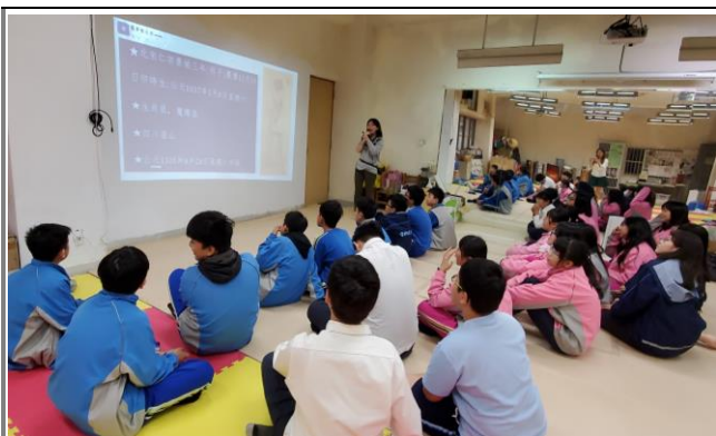
跨校共備，並彼此互相進入對方課室為協同教師