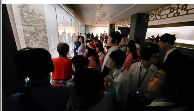
結合校外人力資源與博物館資源，深化學習