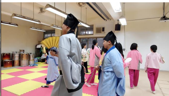
學生邊走邊念水調歌頭的詞