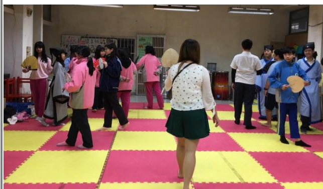
表演藝術教師帶領學生以傳統戲曲搵扇進入想像