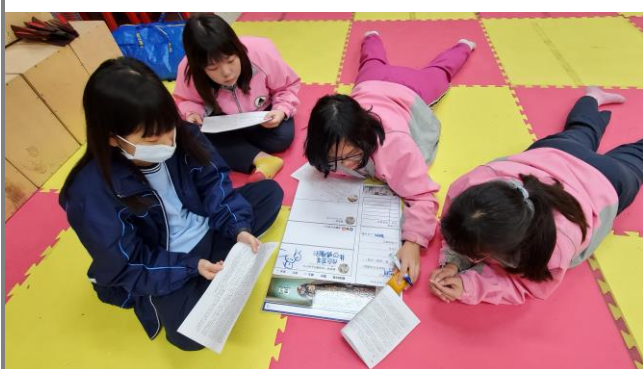
以小組為單位寫下古人的 FB 打卡動態