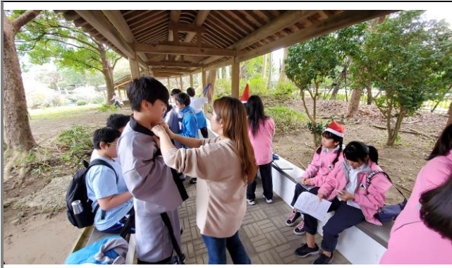
於至善園進行圖文創作與影片錄製