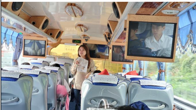
出發前往台北故宮博物院時，教師交代小組任務