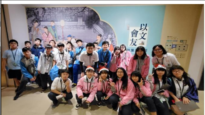
參觀「以文會友—雅集圖」展，學生表示大開眼界