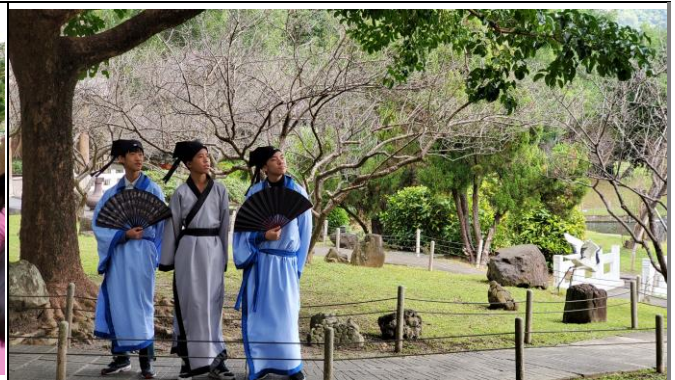
學生創作的圖文作品之一(其餘如附件)