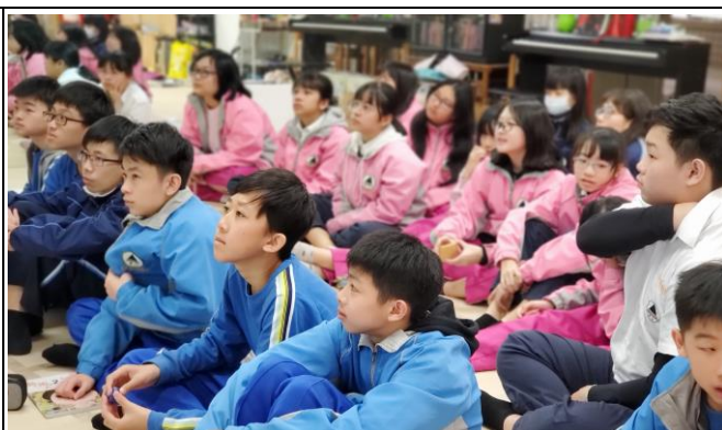
學生連上國文課都非常專注的表情