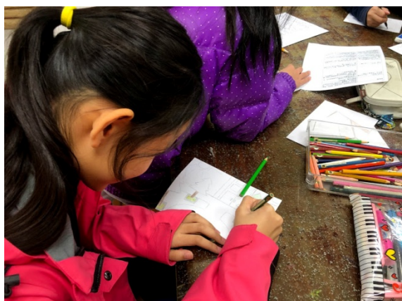
繪製背景與偶的設計圖