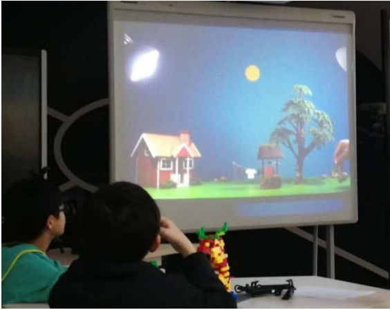
逐格動畫影片欣賞