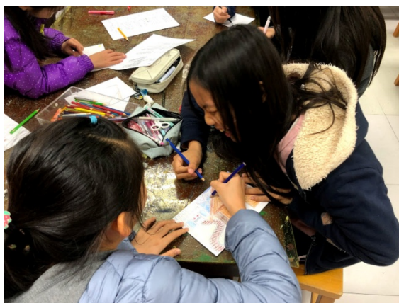
繪製背景與偶的設計圖