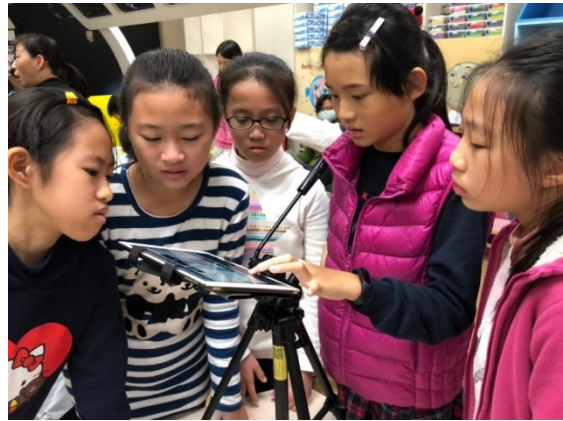
利用 iPad 拍攝逐格動畫