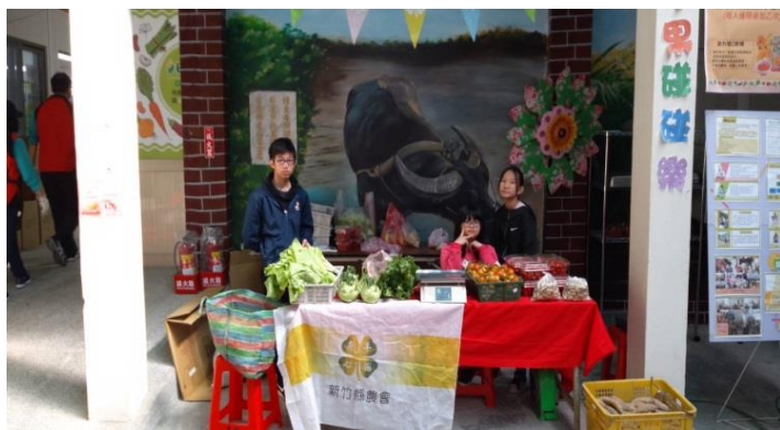
社區服務學習-芎林番茄節販售蔬果