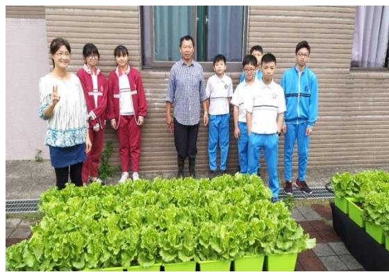
農家樂-無毒菜收成