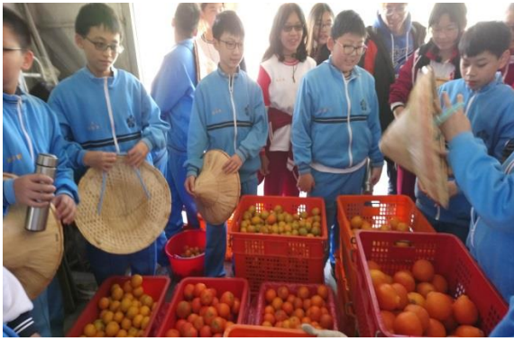
認識柑橘品種與種植