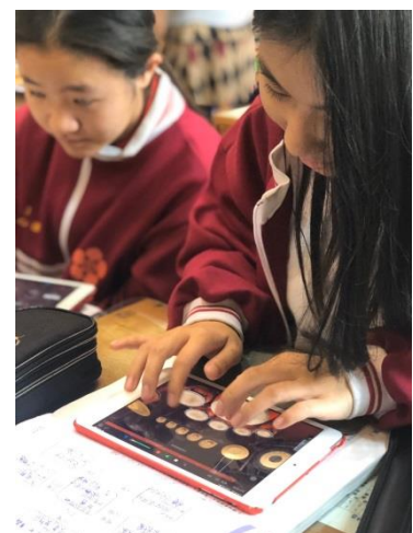
Garage Band<鼓>樂器模擬學習單<村童野徑的四季五感練習曲>