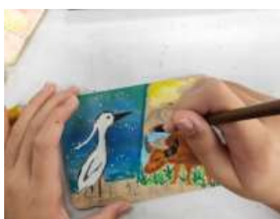
課程說明：彩繪四張犁聚落風情