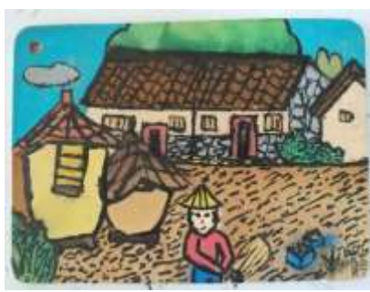
課程說明：彩繪四張犁聚落風情