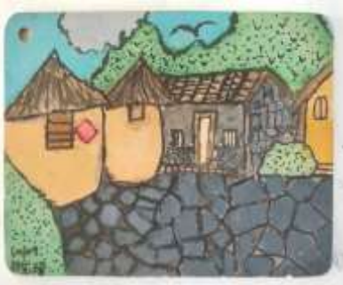
課程說明：彩繪四張犁聚落風情