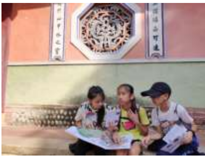
課程說明：走讀文昌廟尋寶