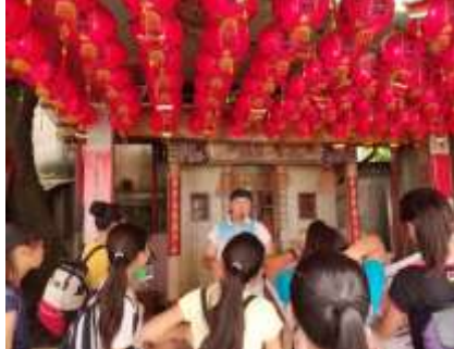
課程說明：走讀合福祠尋寶