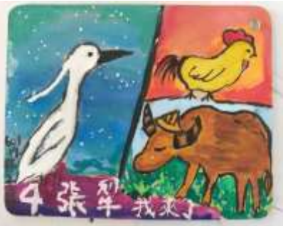
課程說明：彩繪四張犁聚落風情