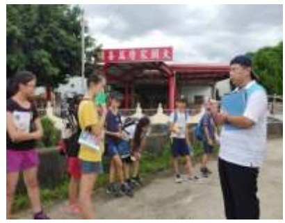
課程說明：走讀戴潮春事件