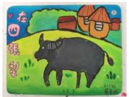
課程說明：彩繪四張犁聚落風情