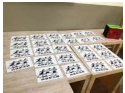
課程說明：版印明信片成果