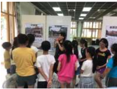
課程說明：版印明信片圖像導賞