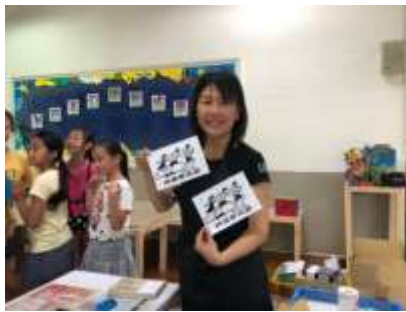
課程說明：版印明信片示範