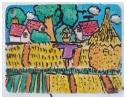
課程說明：彩繪四張犁聚落風情