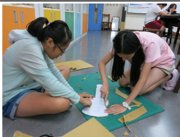
樂器設計-合作學習解決問題