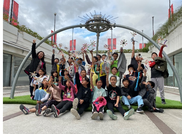
「藝動奇蹟」觀展體驗活動大成功！