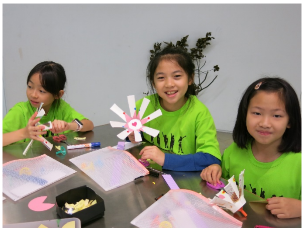
「動力藝術實驗室」工作坊創作體驗