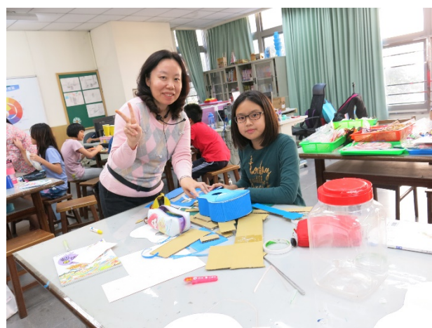
視覺藝術-創意樂器 DIY