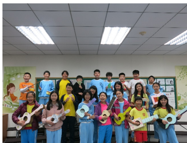
耶!我們的樂器創作成果展現!