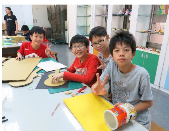
樂器創作樂在其中