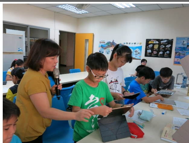
自然課-Quizizz 即時互動評量