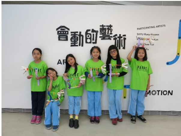
沉浸體驗藝術與科學結合的動力藝術展