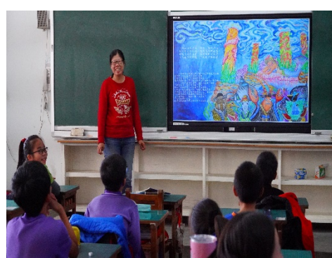
能源繪本故事之分析

*十二年國教課程綱要參考網址： https://www.naer.edu.tw/files/15-1000-14113,c639-1.php?Lang=zh-tw