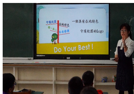
設計一個具有在地特色守護校園的 logo