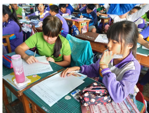
思考能源設計與美感的內容