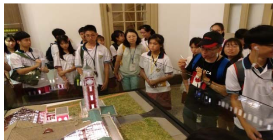
圖六 府城踏查——觀察建築特色