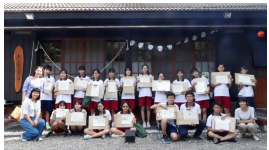
圖二 野帳採集——新化日式宿舍群