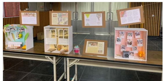
圖十四 櫥窗佈置成果展

*十二年國教課程綱要參考網址： https://www.naer.edu.tw/files/15-1000-14113,c639-1.php?Lang=zh-tw