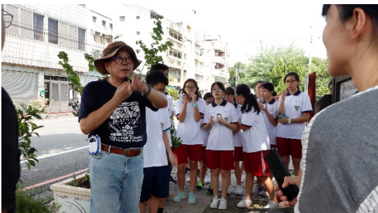
圖五 專家導覽——觀察日式建築特點