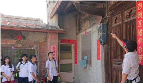
圖七 蘇家古厝踏查——觀察傳統建築