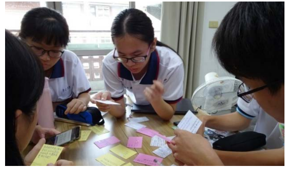
圖八 六頂思考帽教學