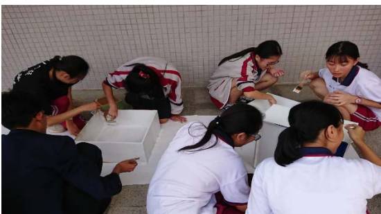
圖十三 櫥窗佈置實作 2