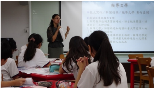
圖九 報導寫作教學