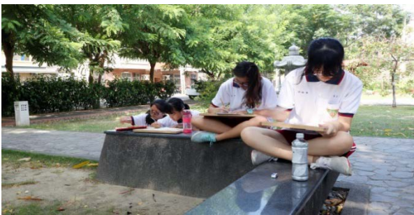
圖一 野帳採集——新化日式宿舍群