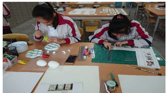
圖十二 實櫥窗佈置作 1