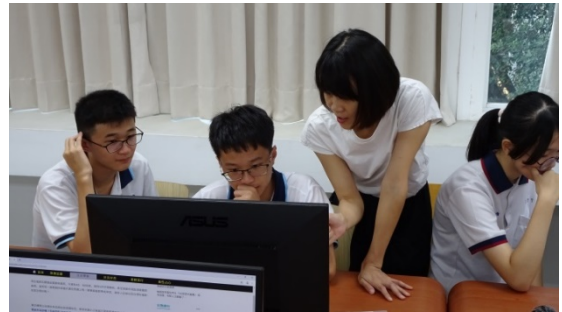
圖十 報導寫作實作