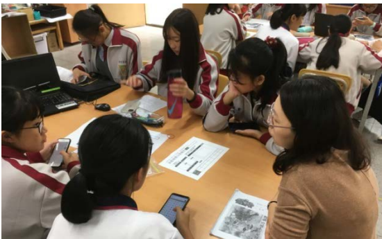
圖十一 櫥窗布置討論