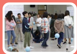
▲ 角色扮演，讓老師們扮演的是施暴者