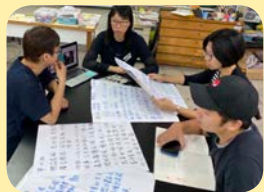
▲ 教師團隊共備情形