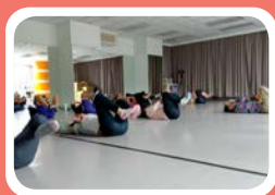
▲ 身體延展與滾動練習