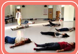
▲ 靜躺傾聽來自身體的訊息