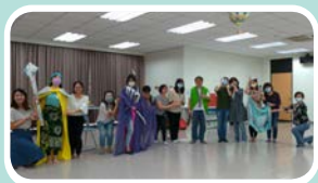
▲ 各組呈現設計理念