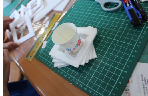
課堂上課一景與學生作品