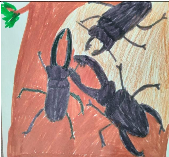
木都新語 校園自然觀察與繪畫