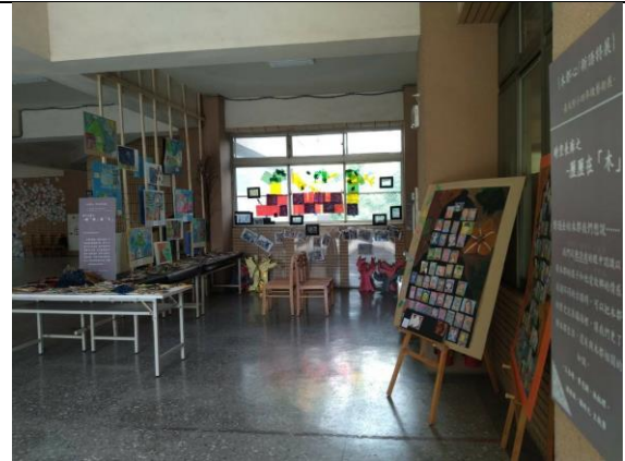
木都新語 班際接力策展