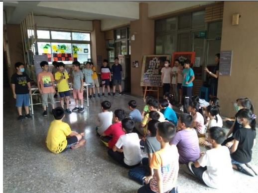
木都新語策展 校內導覽