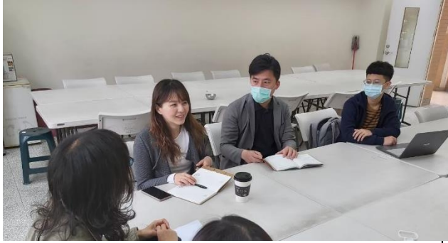
木都新語 策展會議