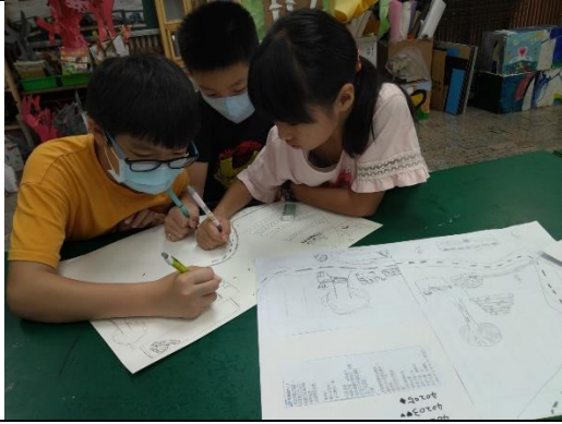
木都印象 合作畫詩