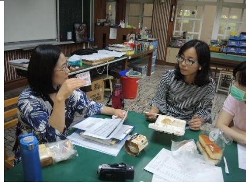
木都印象 教授指導