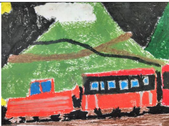
小火車與阿里山粉蠟筆創作