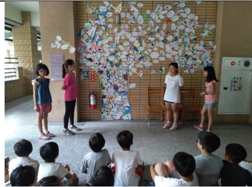
木都新語策展 校內導覽