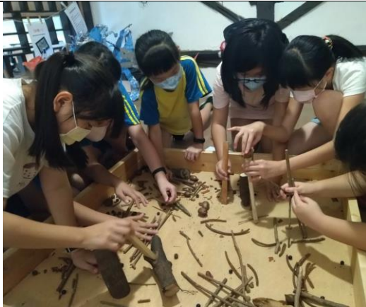
融榮特展 互動展區