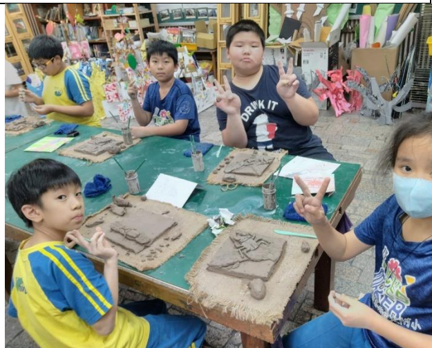
木都新語 自然與交趾陶