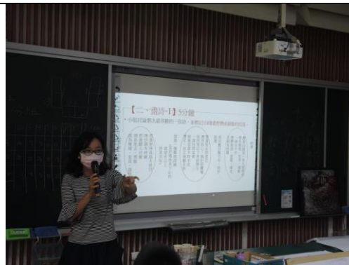
木都印象 讀詩畫詩