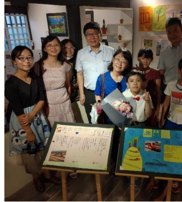
木都新語 融榮特展