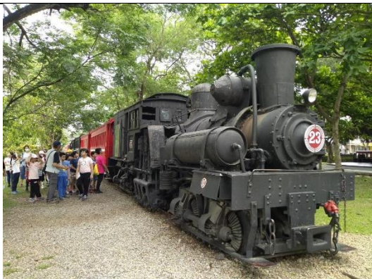
木都印象 參觀車庫園區