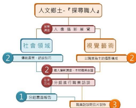
跨領域美感課程架構圖