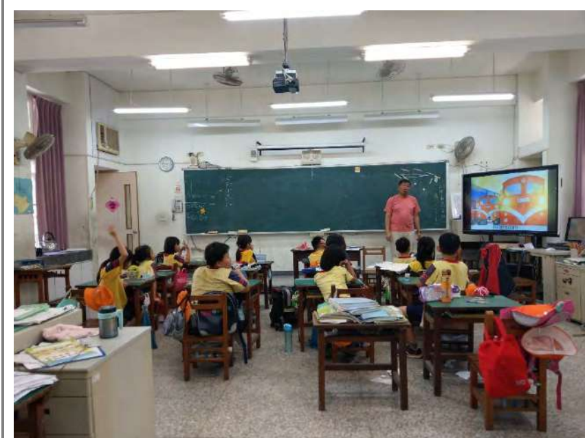
「越過山崗」電子書簡介