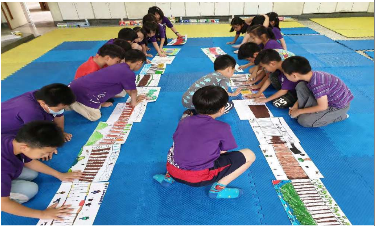
大家一起動手組合鐵軌