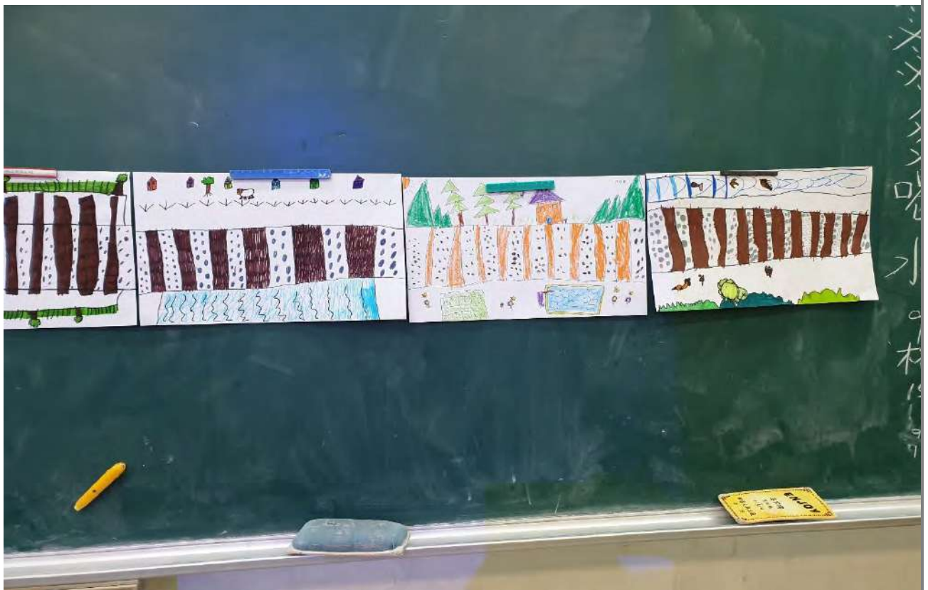
每個人畫的鐵軌都不太一樣喔