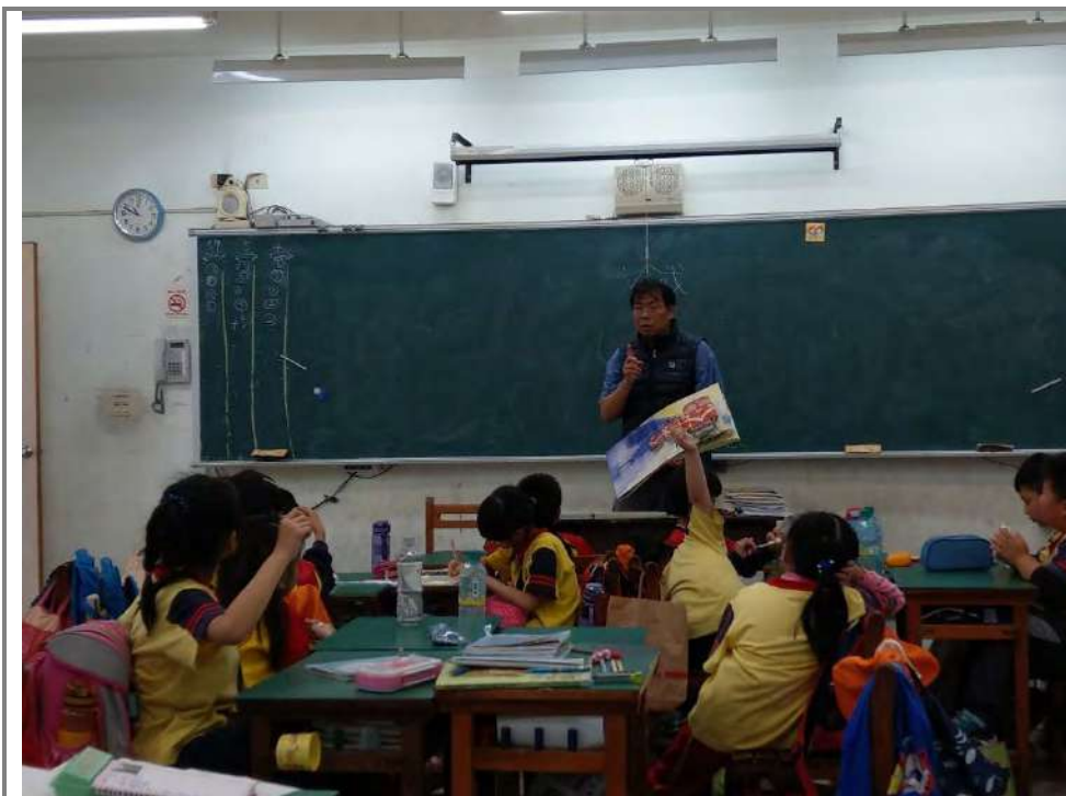
「越過山崗」立體書教學