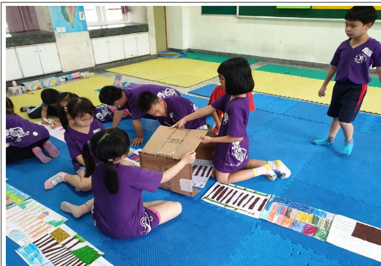
討論如何做出山洞