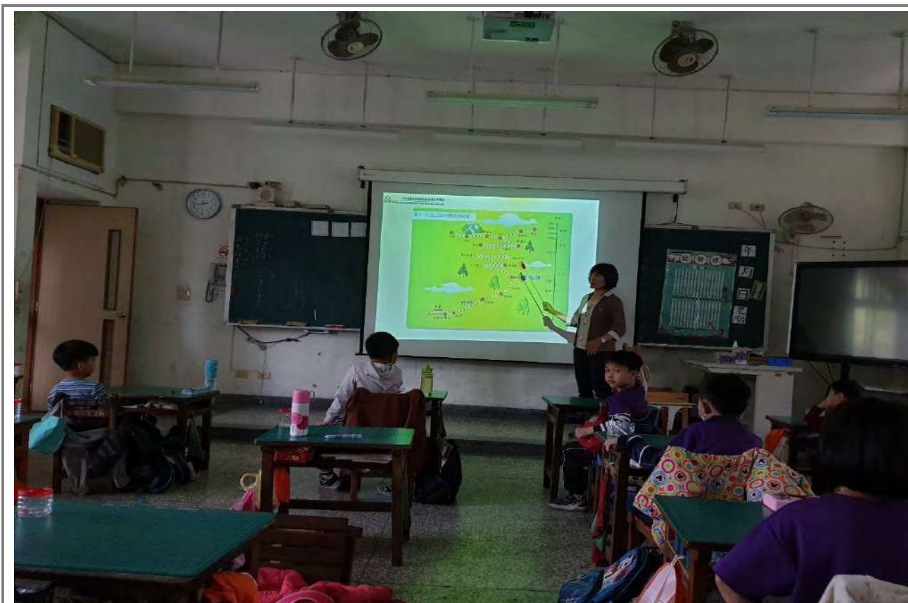
簡介阿里山森林鐵路