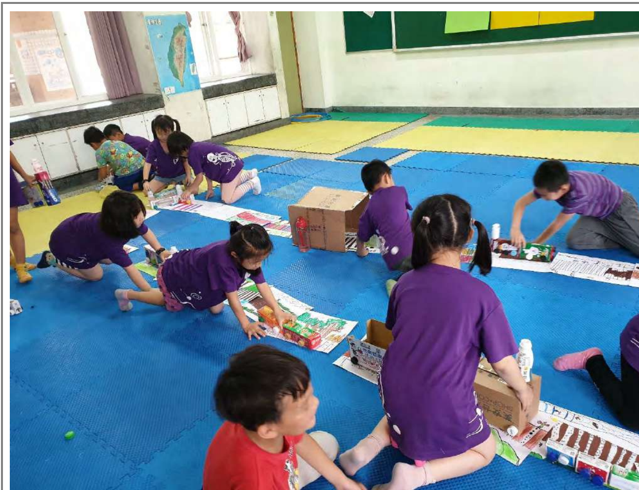
沉醉在火車遊戲中