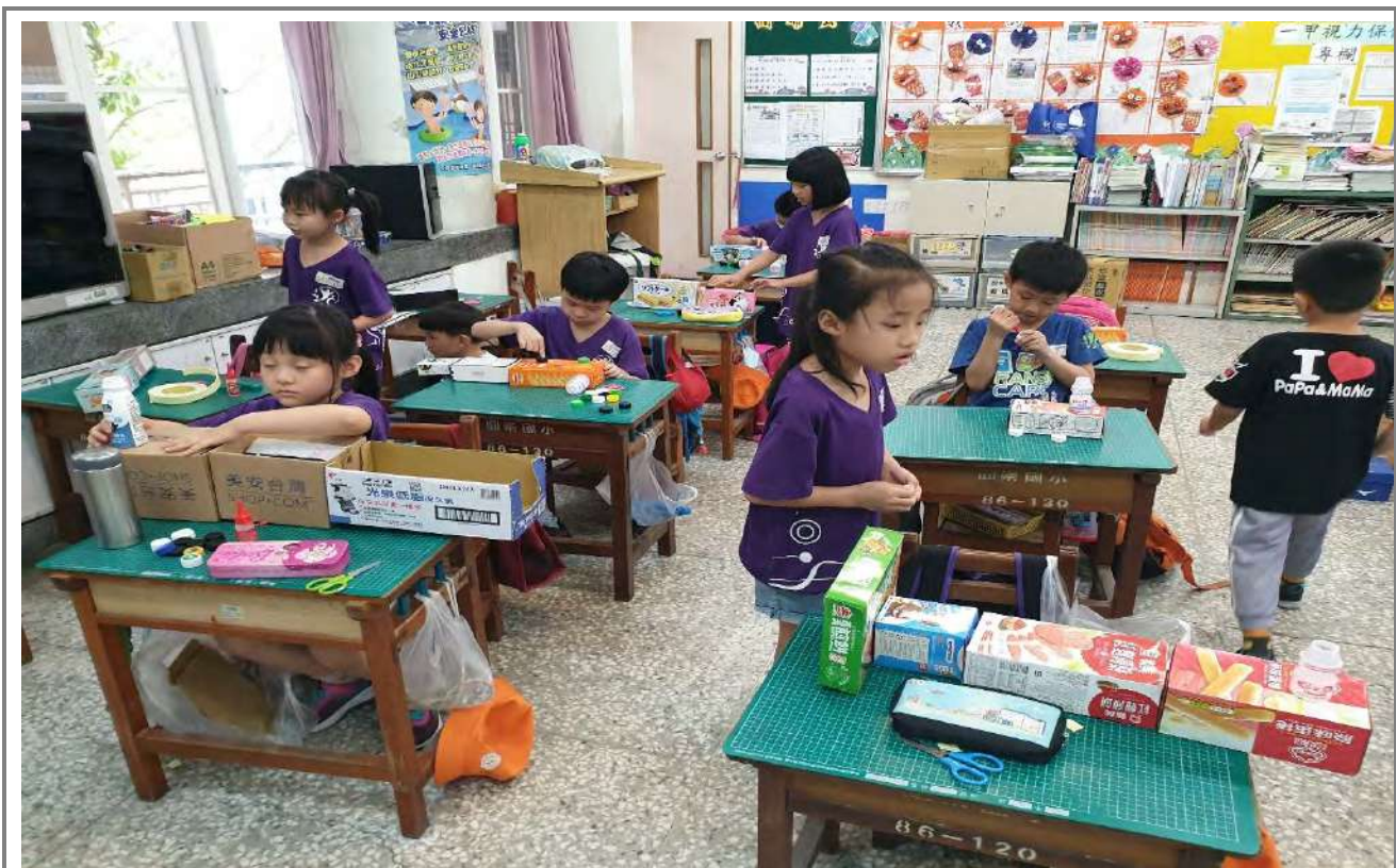
利用廢紙盒組裝火車