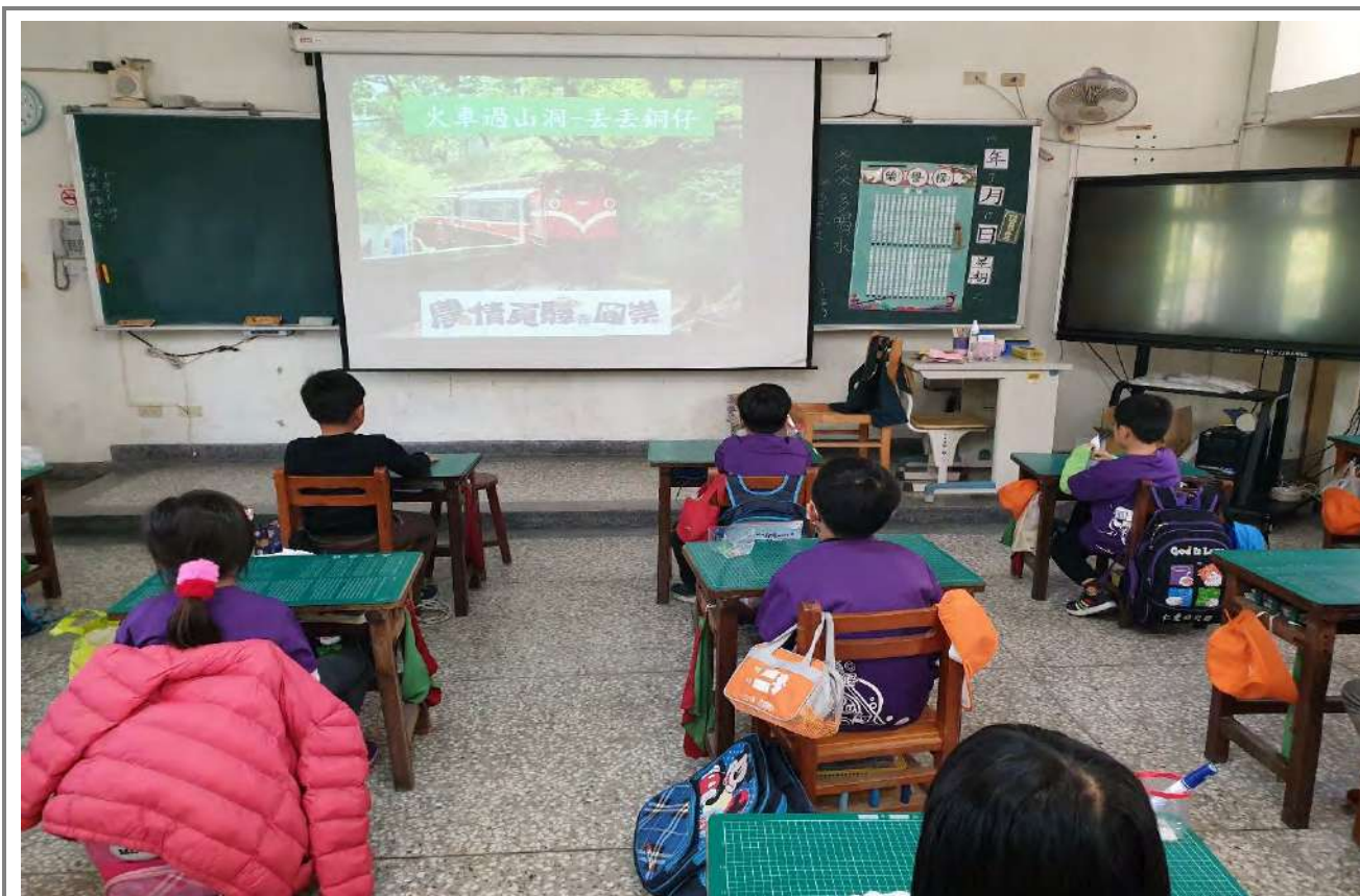
丟丟銅仔歌曲介紹