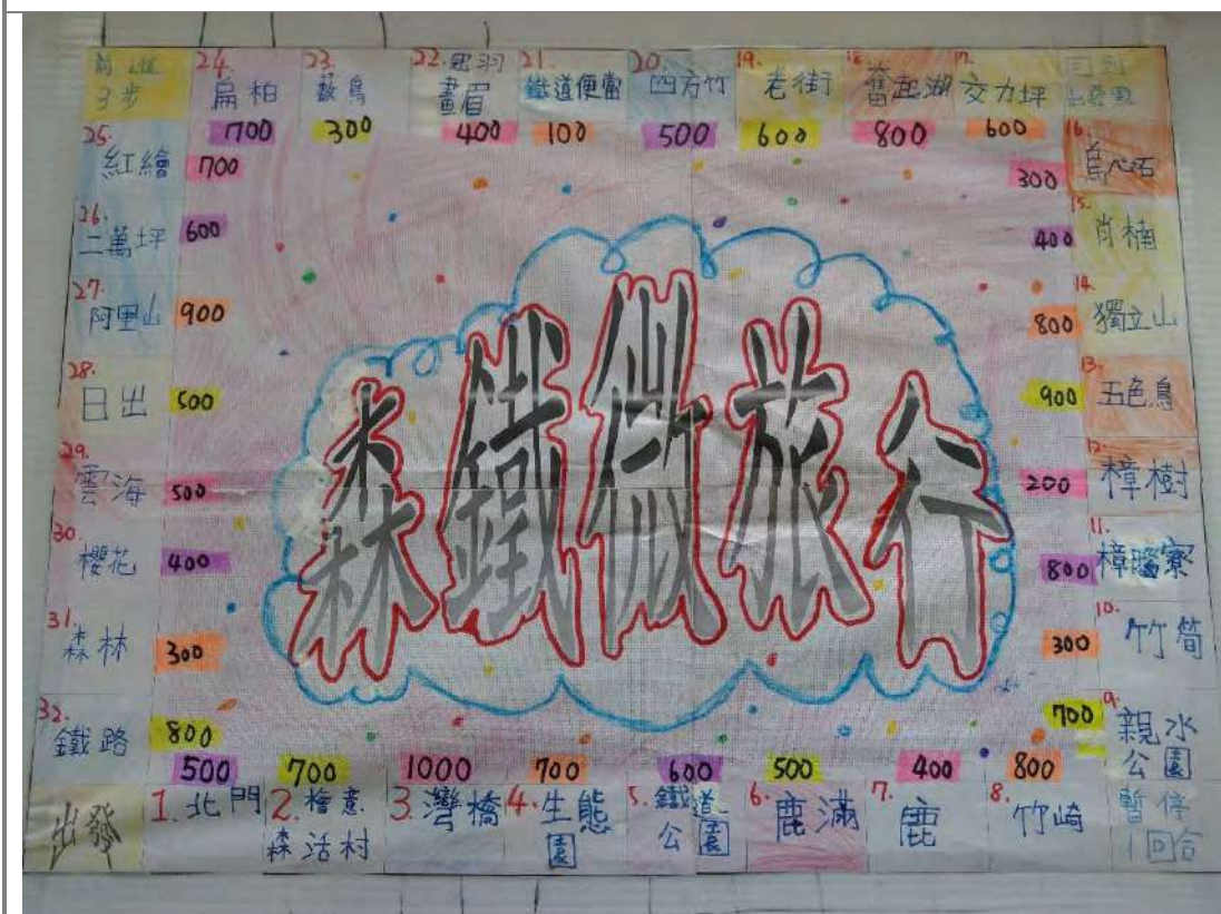
大富翁桌遊作品完成