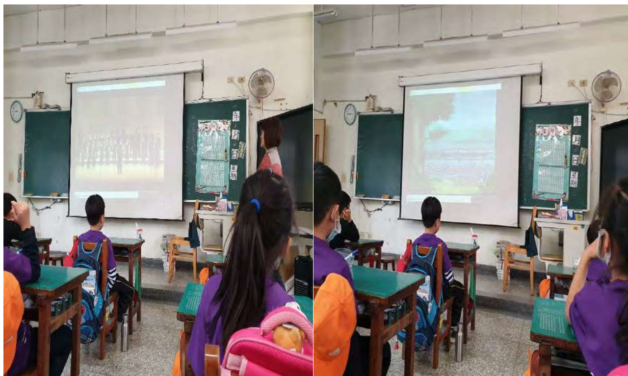
一樣的丟丟銅不一樣的詮釋 合唱版丟丟銅仔與兒歌版丟丟銅仔