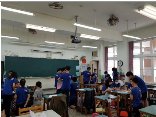
全班分為四組先行選拔