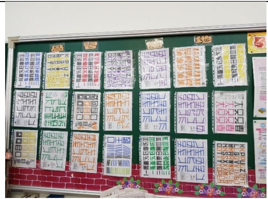
有圖相信大家更掌握設計海報的要素