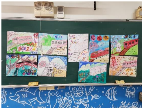
我們精心設計出的作品