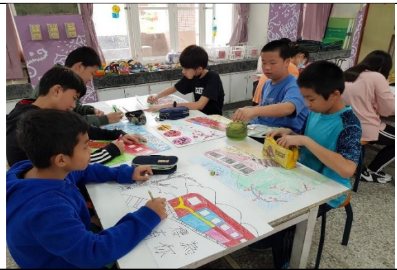
我是林鐵創客達人