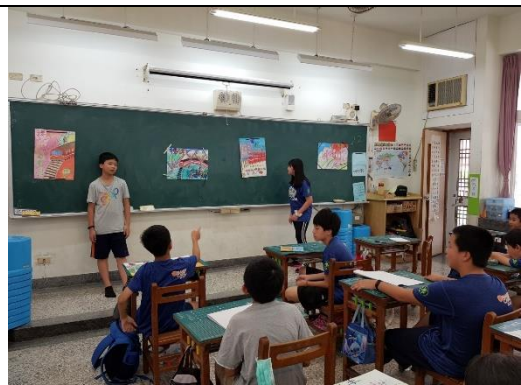
各組代表在他組前分享自己組海報的優勢