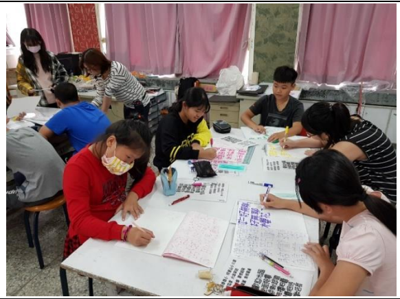
POP 進階習寫全神貫注