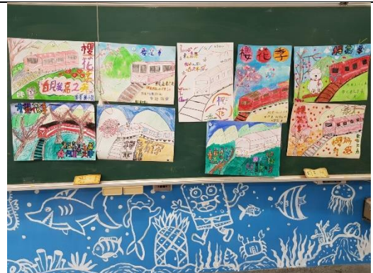
我們瀝心瀝血出的作品