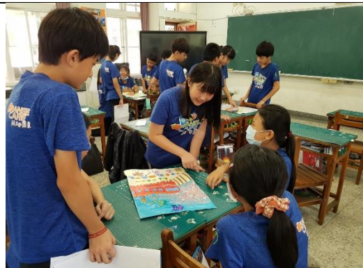
美感海報分享~說服同組的同學能讓我代表分享