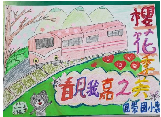
我們瀝心瀝血出的作品