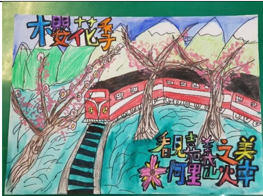
我們精心設計出的作品