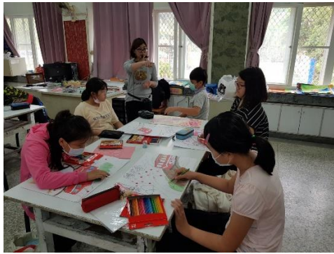
我是林鐵創客達人