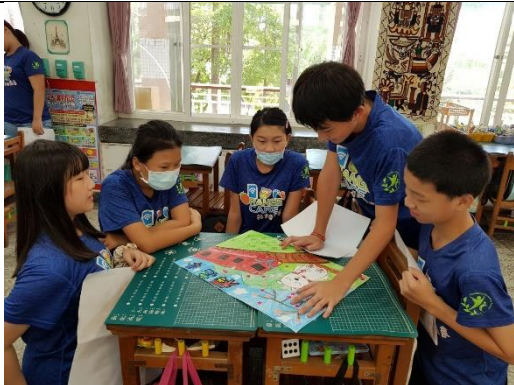
美感海報分享~說服同組的同學能讓我代表分享