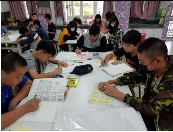
學生認真學習 POP 的進階~變體字！