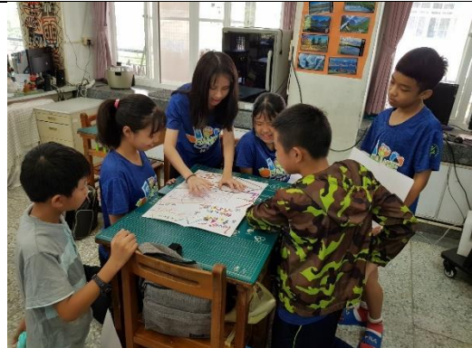
美感海報分享~說服同組的同學能讓我代表分享