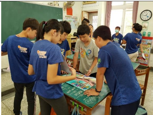
美感海報分享~說服同組的同學能讓我代表分享