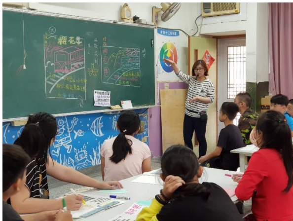
聆聽老師教我們設計海報的基本注意事項