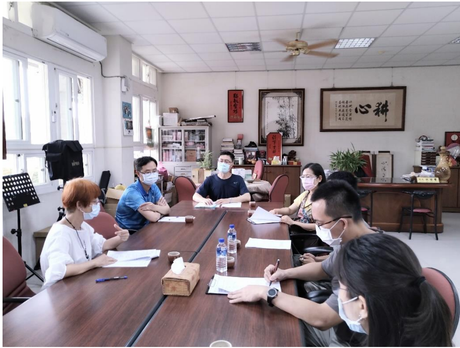
公開授課後教學研討會