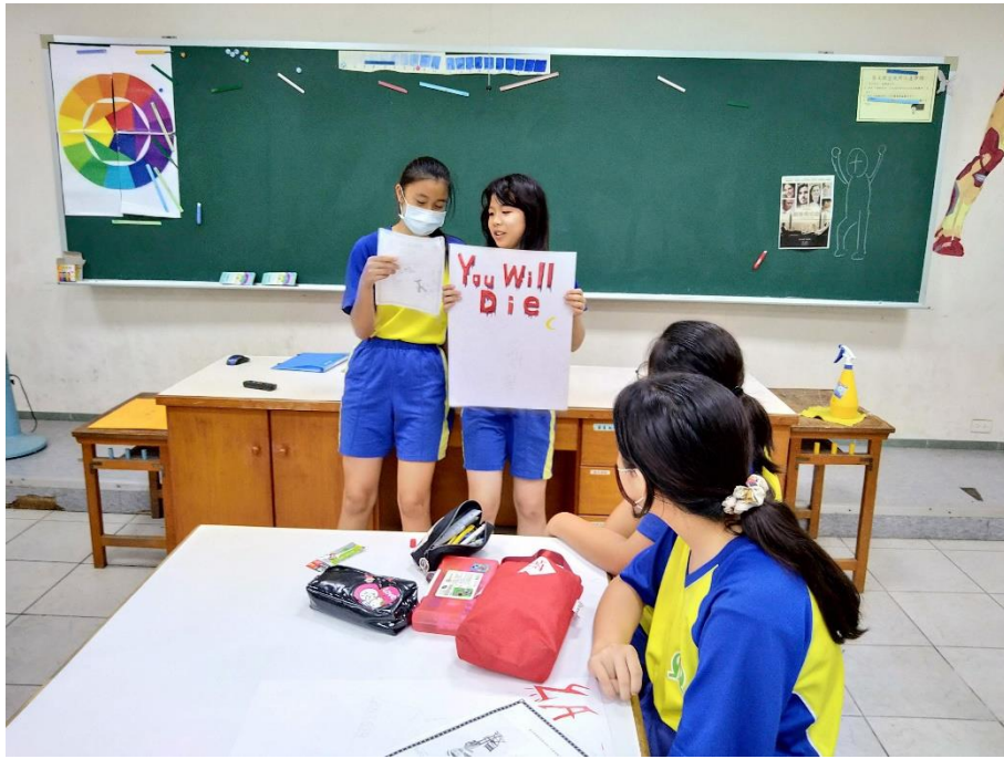
海報設計圖發表與意見回饋