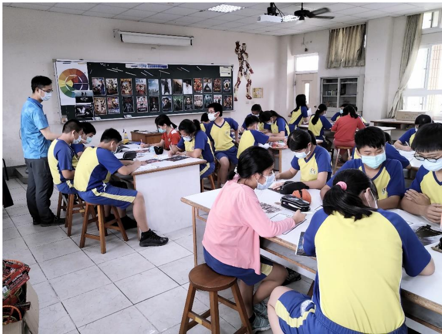
電影海報欣賞與分析