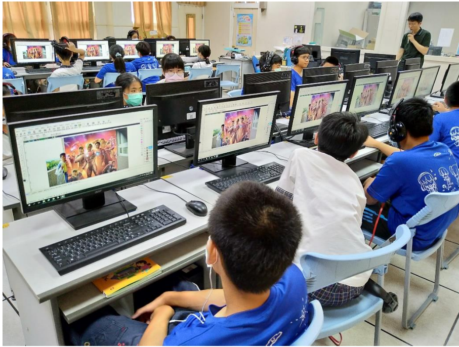
資訊教師解說海報合成及排版