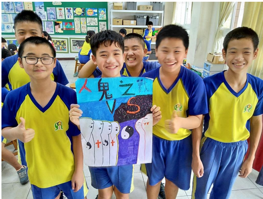
海報設計圖發表與意見回饋