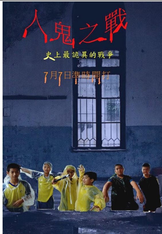
學生設計之電影海報