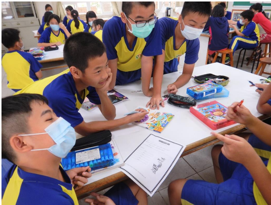
小組討論構思海報設計圖