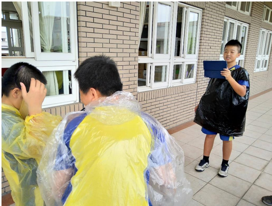
角色裝扮與拍攝劇照