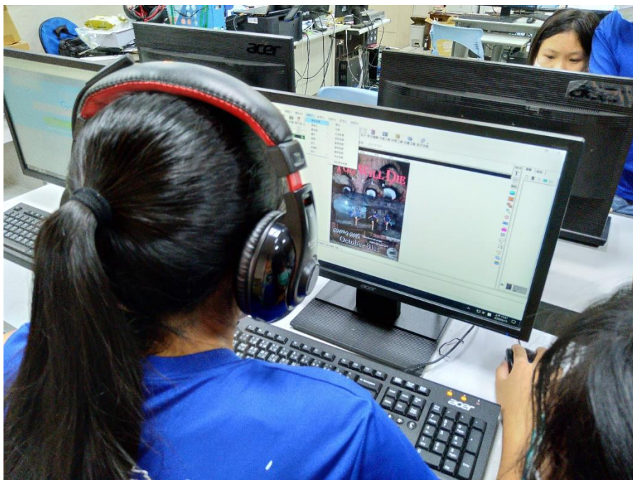
學生進行海報合成及排版