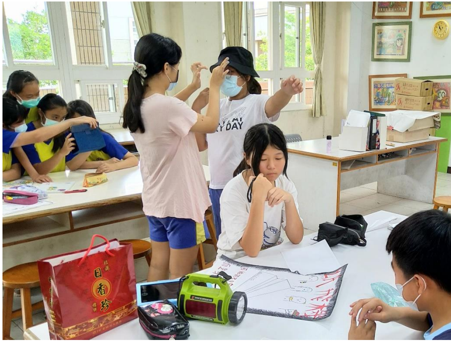
角色裝扮與拍攝劇照