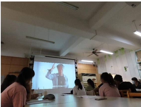
學生觀賞蔣勳美學講座片段