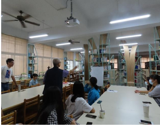
以投擲吸盤球，引發課程興趣