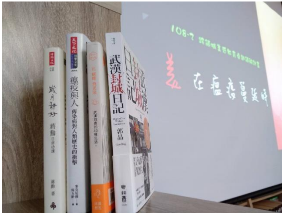
以書籍共讀切入，架構課程四種面向