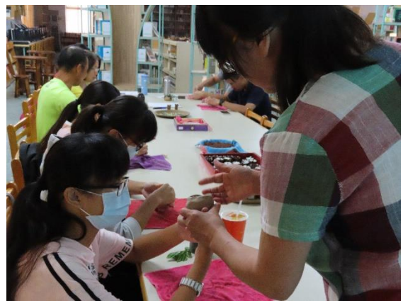
老師指導學生進行陶器手作