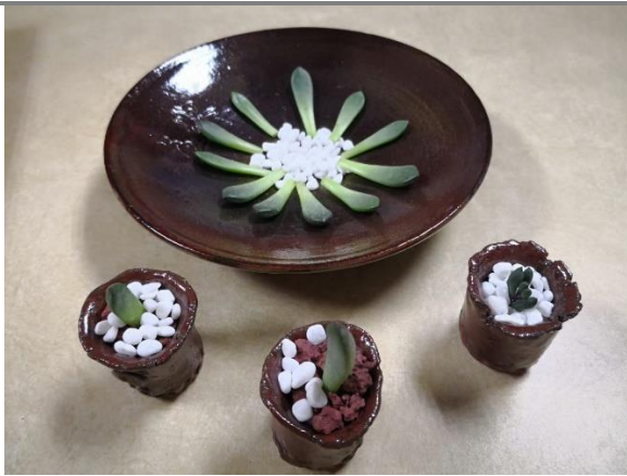
以東石魚塢底泥作為元素之手作陶杯