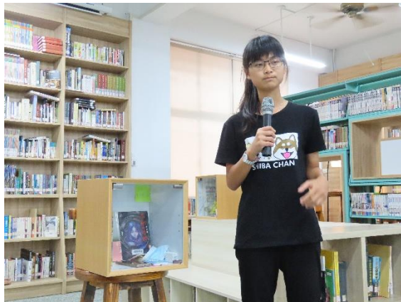
學生闡釋行動藝術裝置櫃內的物品及意念