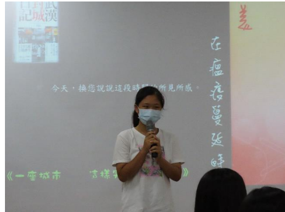
學生分享疫情期間的感受與想法