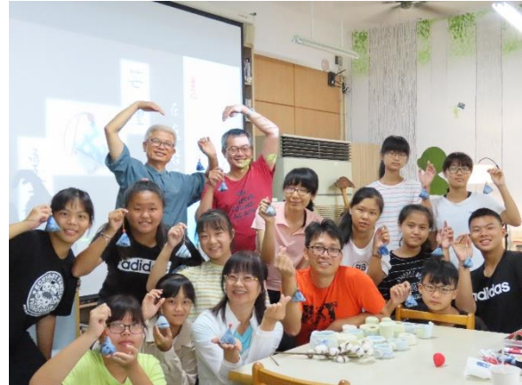
師生展示端午藍染香包成果