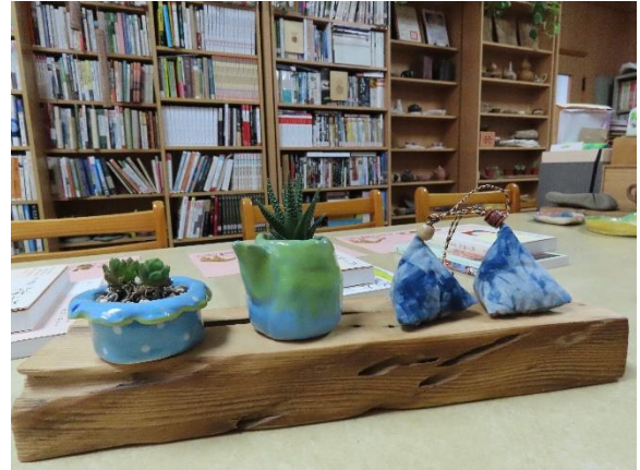
學生陶作與香包作品之結合擺飾

*十二年國教課程綱要參考網址： https://www.naer.edu.tw/files/15-1000-14113.c639-1.php?Lang=zh-tw