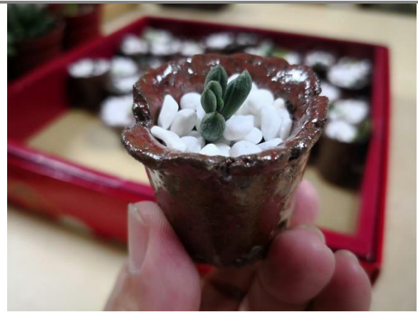
以手作陶杯贈與社區長輩表達連結與關懷