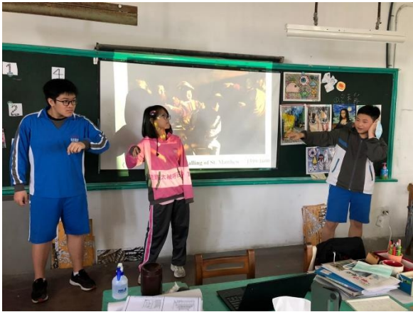
學生體會巴洛克作品中的情感表達