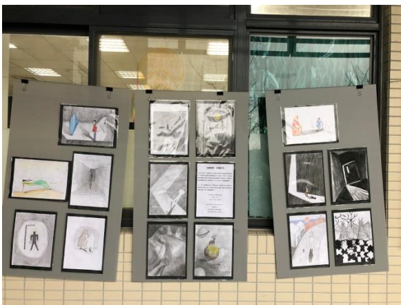
用光與影當作心理感受的比喻