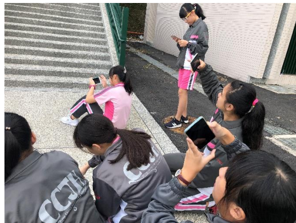
用相機觀察拍攝校園環境