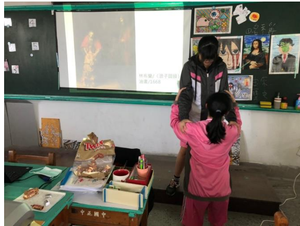
學生體會巴洛克作品中的情感表達