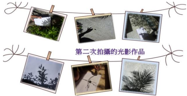
第二次拍攝的光影作品