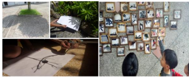
光影戲開鑼了!小組的布置