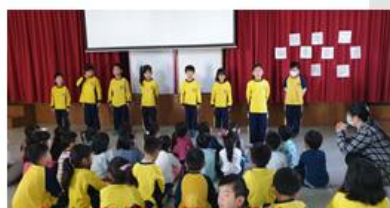
為幼兒園的第一場演出