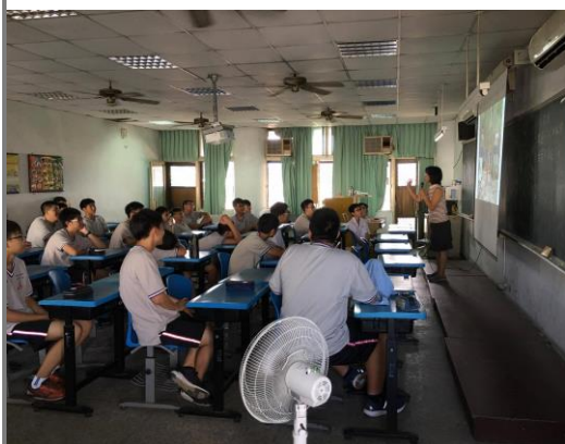
康護老師帶領同學討論環境議題