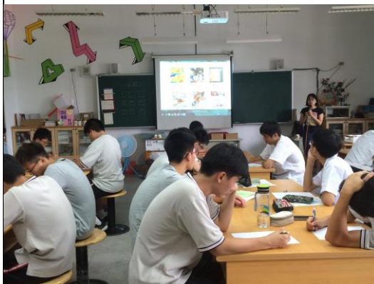
美術老師介紹植物染