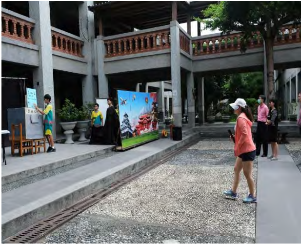
我與未來有約-彩排囉!