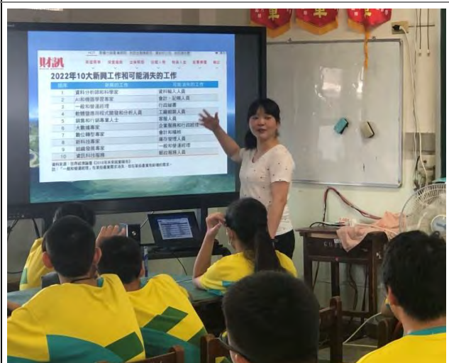
我是未來人-未來的的工作