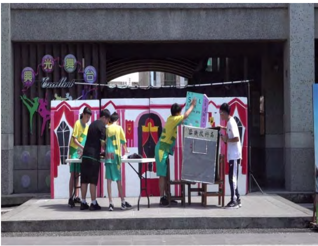
燈亮，請上台-「時間的設計師」演出