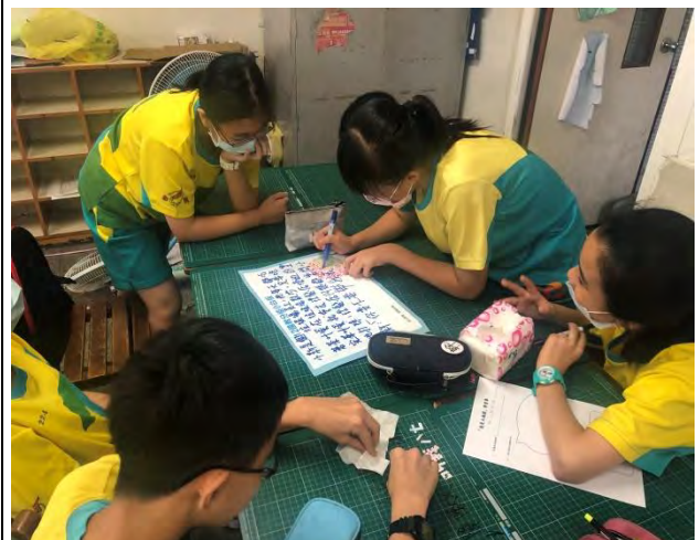
我是大編劇-說故事劇場