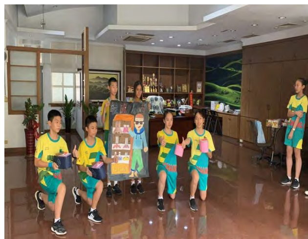
到校長室宣傳「鞋楦人生」