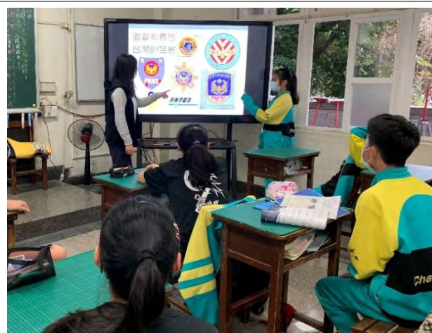
徽章有意思-觀察各行各業的標誌