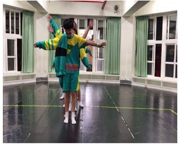
職業數來寶-創意職業數來寶