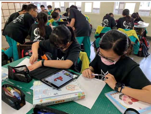
徽章有意思-設計職業的新標誌