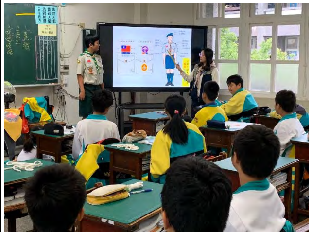
「FUN」手「心」設計-認識童軍徽章制度