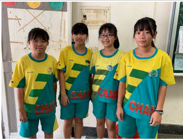
「FUN」手「心」設計-成果展示