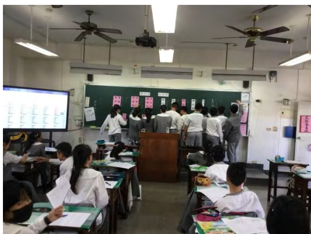
「愛」的主場秀-職業訪談的分類