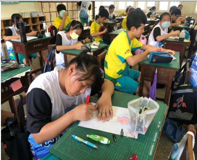
職業服裝大未來-我是最佳服裝設計師