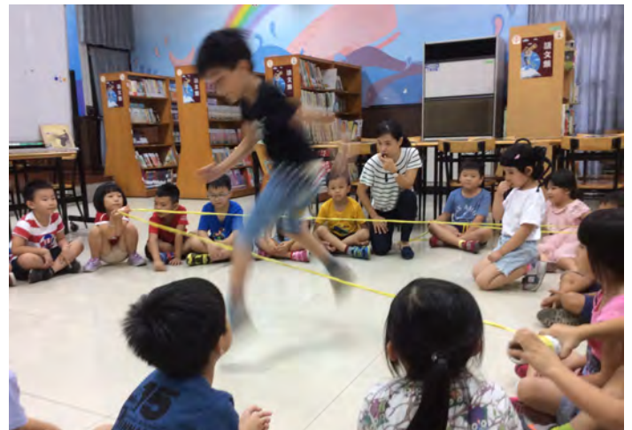
想像繪本主角蜘蛛蘇菲搬家的路線