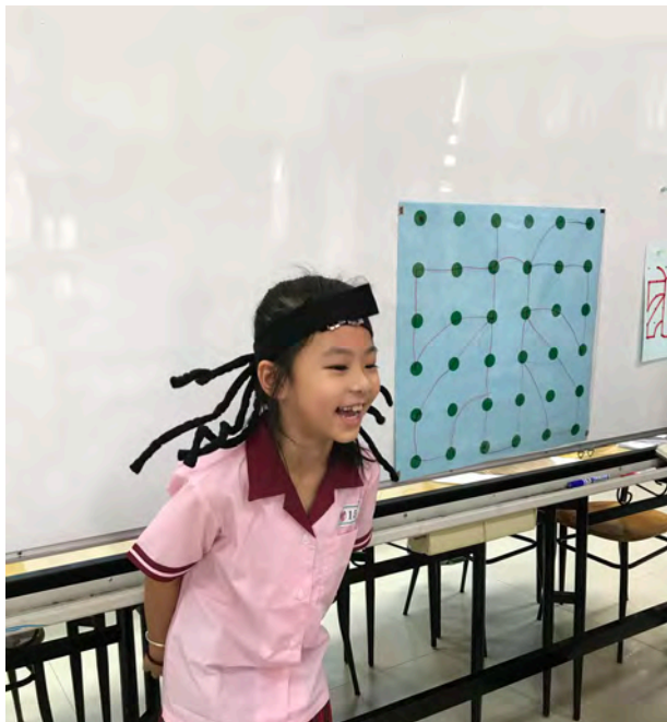
扮演蜘蛛和練習點線圖