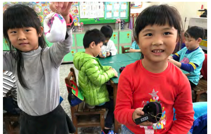
廢材織襪大改造--襪子甜甜圈怪物