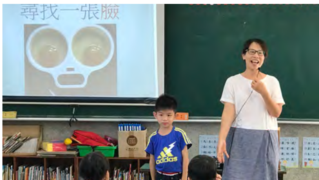
發現生活中的一張臉