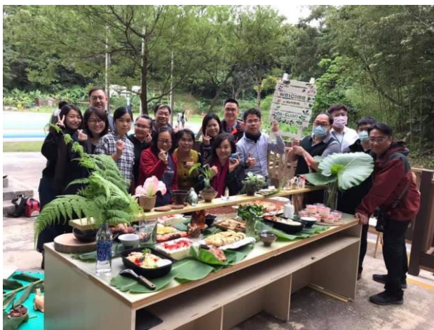
先感動老師，老師才能設計出感動人的課程 （將成果捐給學校的儀式與饗宴）