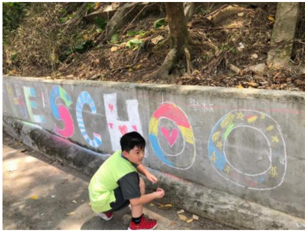
五感藝術市集—彩繪大地