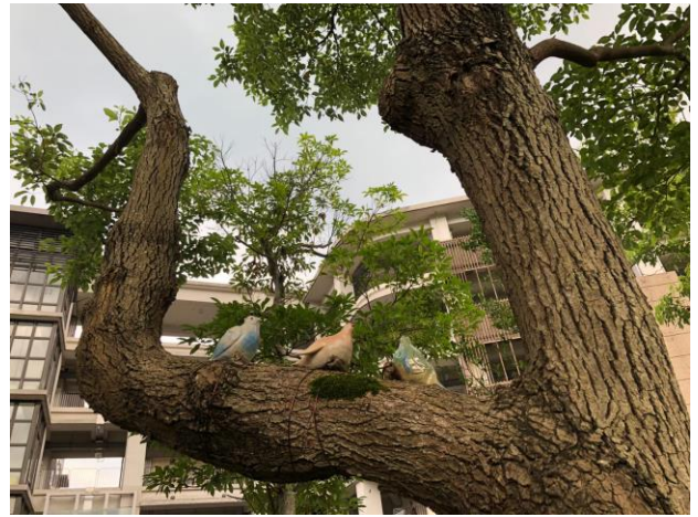
讓校樹更活潑的藝術作品