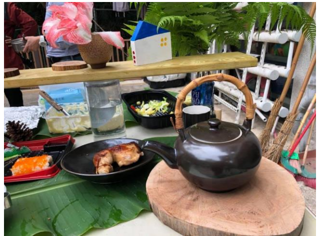
美與美食的饗宴(五感齊開，以美感動社群成員) (安坑陶藝家贊助的作品，藝術作品流浪計畫)