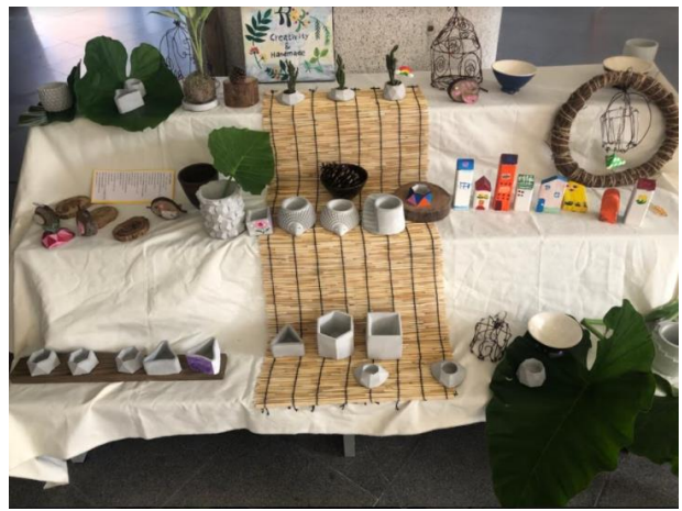
五感藝術市集—攤位陳設