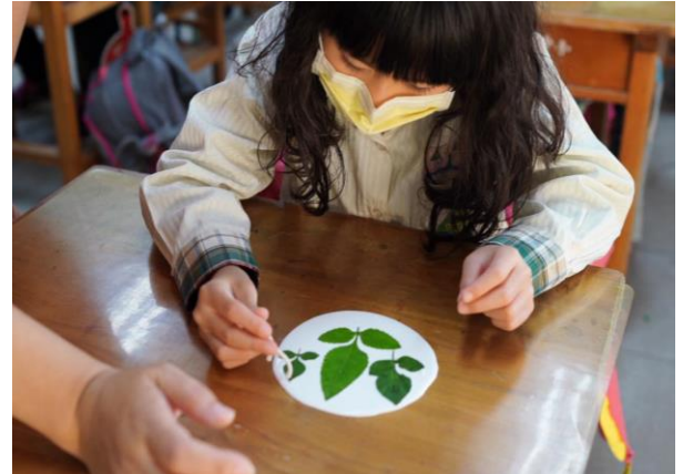
取之於學校環境的素材，創作藝術作品

*十二年國教課程綱要參考網址： https://www.naer.edu.tw/files/15-1000-14113_c639-1.php?Lang=zh-tw