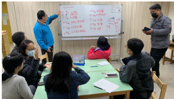
期初會議決定社團的授課大方向