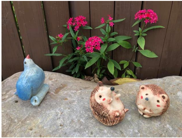
以創作美化校園空間