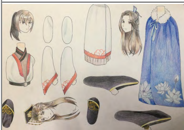
5 人物部位分解上色