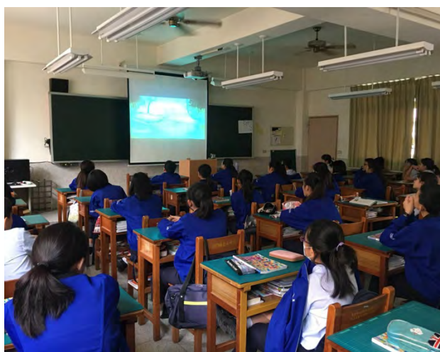
1 故宮文創動畫影片賞析