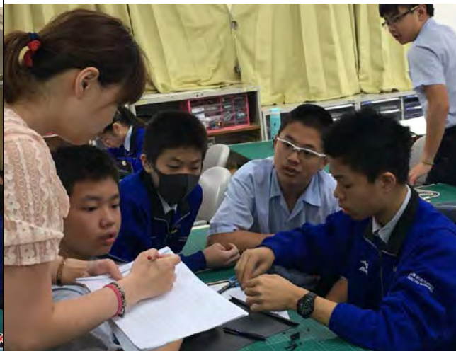
2 分組討論成語劇本：教師分組指導