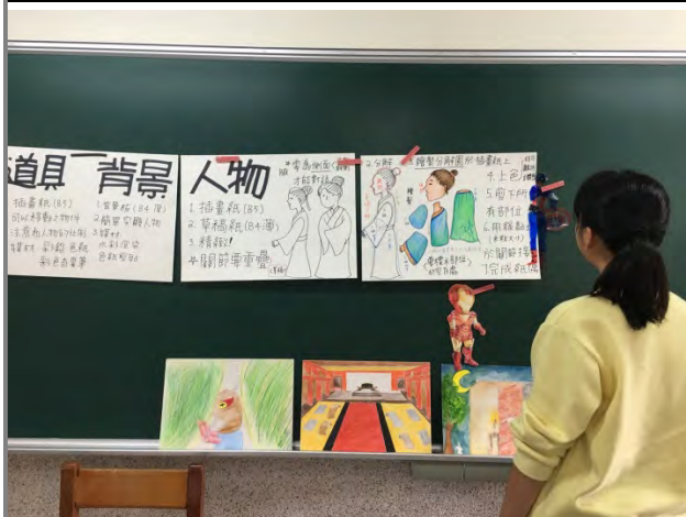
3 道具背景與人物製作說明