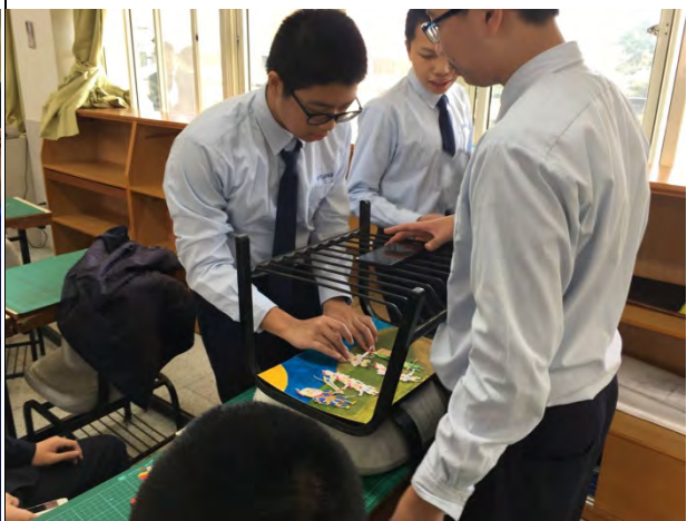
9 用手機 app 將人物道具背景放置於拍攝台上拍攝