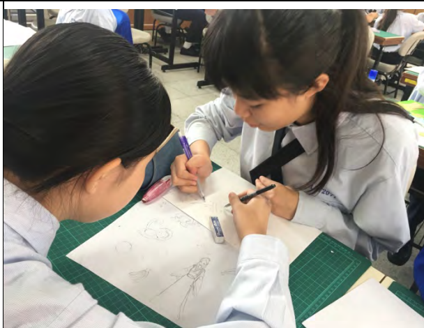
4 討論人物草稿、背景風格與道具大小比例