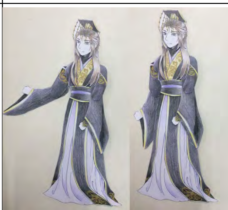
6 人物各部位剪下後用綠色黏土組裝