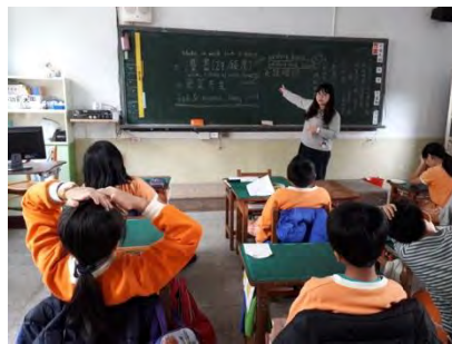
共同討論適合的英語標語