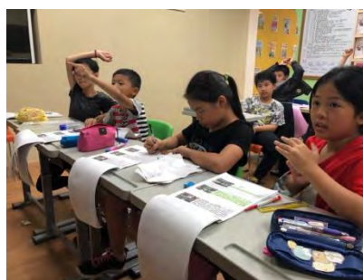
彙整資料，撰寫導覽手稿