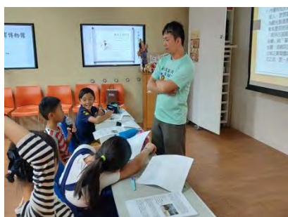
認識導覽工作，學習解說技巧