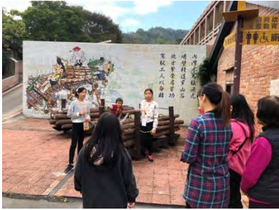
小小導覽員，與家長分享