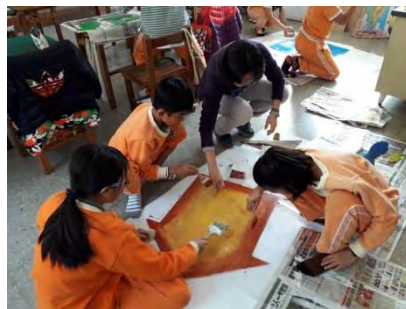
師生共做魚菜共生池標誌