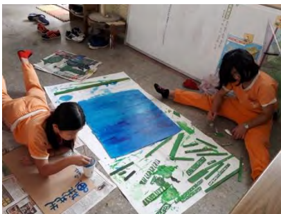
小組合作，製作漂書屋標誌