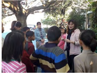
校長驗收導覽成果，回饋鼓勵