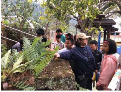
社區導覽員解說示範