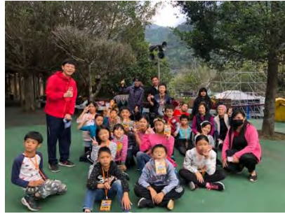
導覽課程完成，全員通過認證