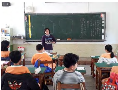
校園特色標誌意象發想