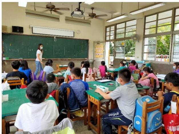
數學領域-利用瓶蓋操作等值分數