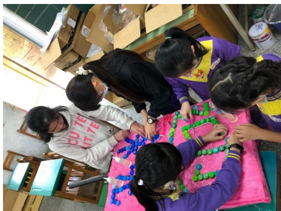
藝閣踩街-喜幛製作