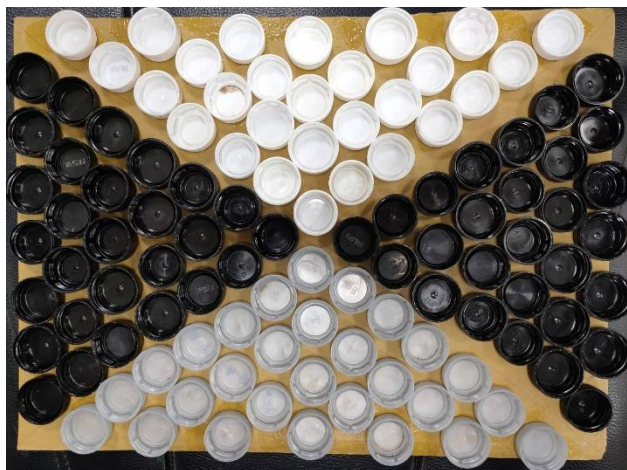
數學-等值分數學習(美的對稱)數