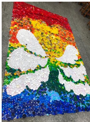
數藝瓶蓋畫創作-展翅高飛