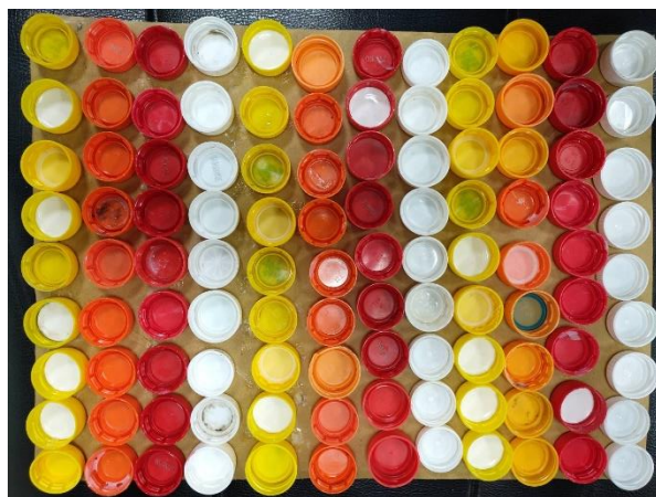
數學-等值分數學習(美的反覆)