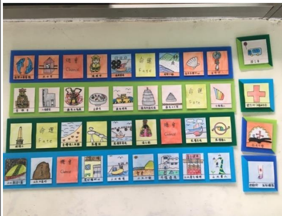
照片 7：桌遊地圖完稿