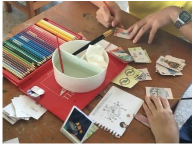
照片 5：桌遊圖案繪製