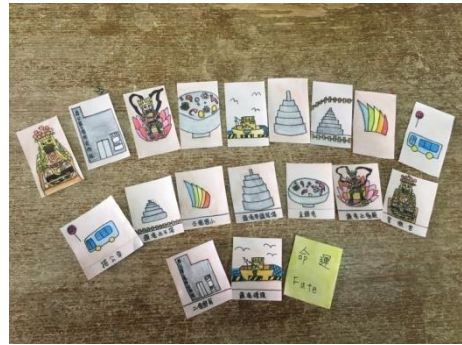
照片 6：桌遊手卡繪製完成品