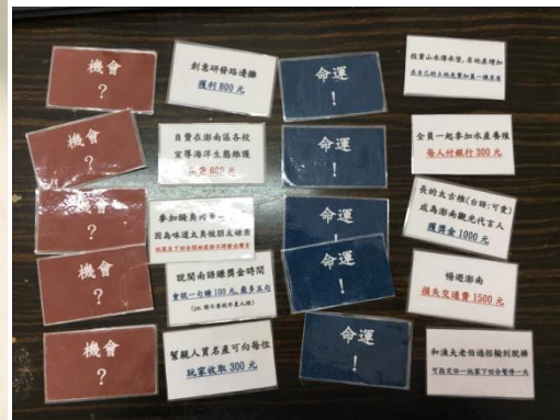
照片 8：機會命運關卡完稿