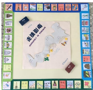
照片 9：走讀澎南成品