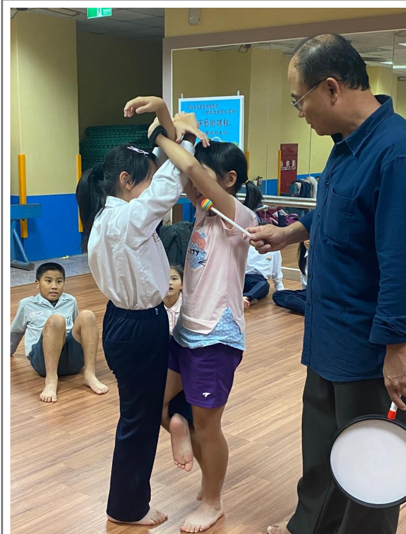
(兩人合作進行多點交錯，呈現肢體之重疊美感！)