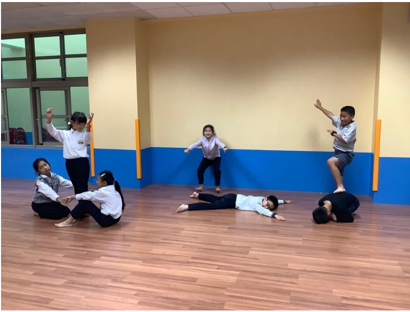
(透過合作，將生活情景定格演出！)