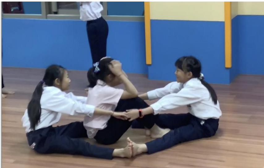
(藉由合作，發揮想像力！再現生活物件與日常生活場景！)