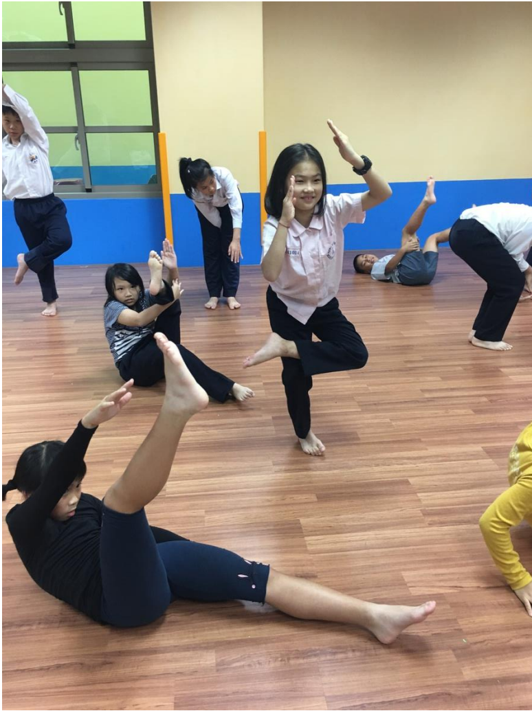
(透過想像，與再詮釋，將肢體造型展現不同種類的生活物品)