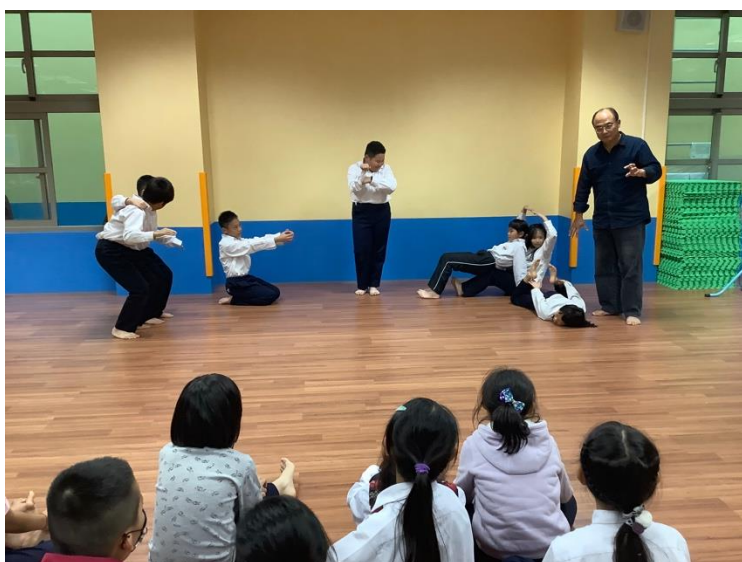
(故事劇場～將故事封面演出來！合作創編找出童話故事中具有代表性的場景定格，並以肢體造型詮釋之)