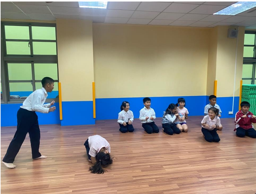
(我演故事你來猜！七隻小羊與大野狼！)