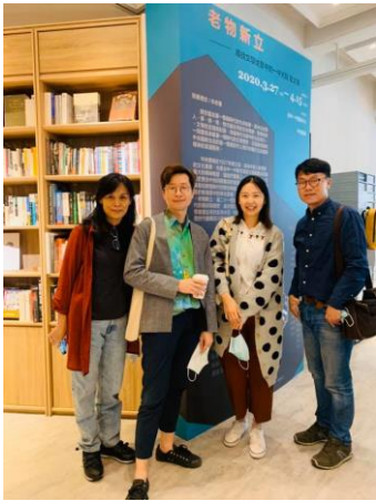
核心教師於中央書局展場合影