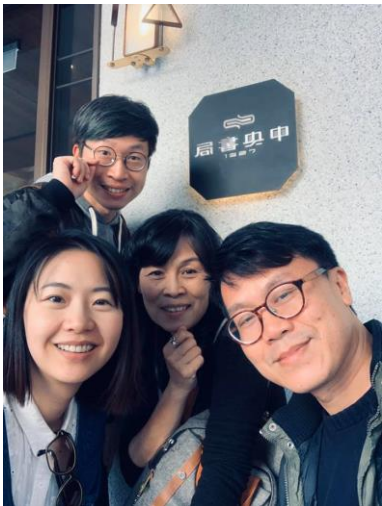
美術教師團隊第一次於中央書局進行現地共備