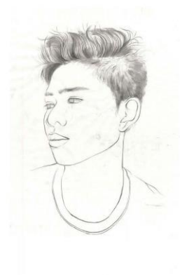
陳有倫 復古打字機 38*26cm 炭筆、素描紙 2020