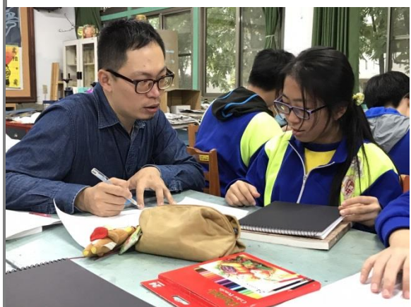
和學生討論畫面的可能性