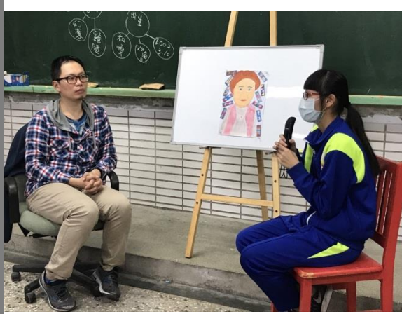
邱海綺同學上台分享作品與阿媽的生命故事