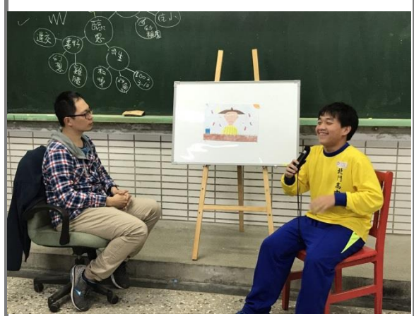
黃建隆同學上台分享作品與阿公的生命故事