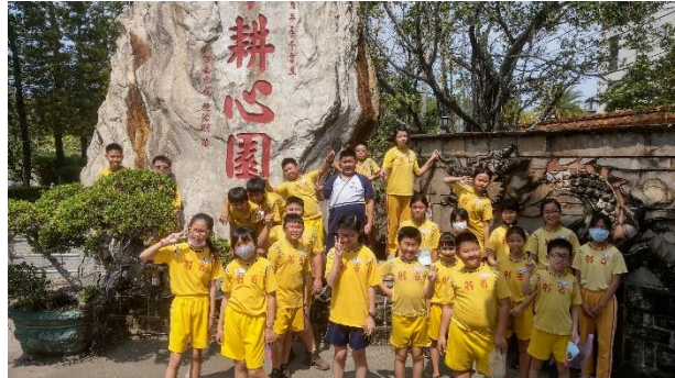
活動結束後開心來張大合照吧！