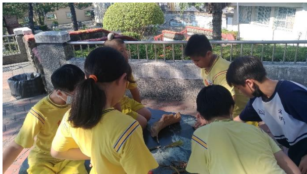
帶學生前往耕心園認識植物及蒐集素材。