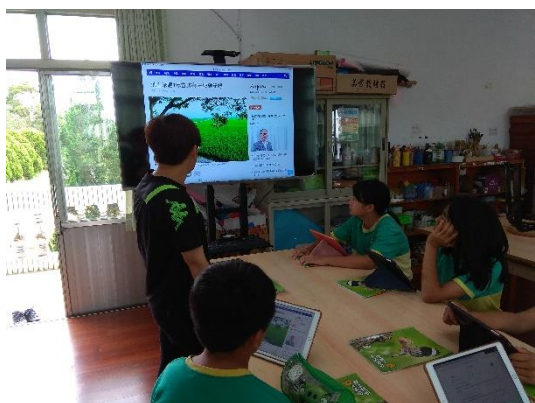
聽音樂長大的米-池上伯朗大道音樂米介紹