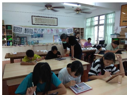
logo 及米包裝設計教學