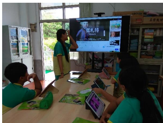
分享選擇稻子聽的音樂並加以說明