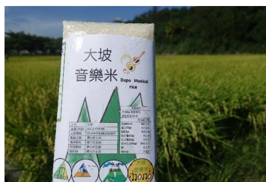
學生 Logo 設計作品