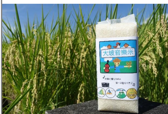
學生 Logo 設計作品