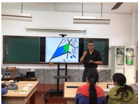
logo 及米包裝設計教學